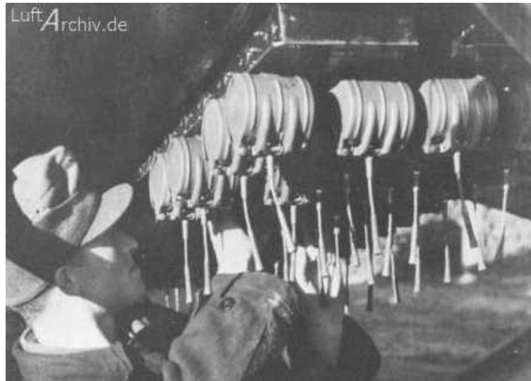
5. ábra. SD2 típusú légi telepítésű akna tárazása 9

A távaknásítási módszerek közül a légi terjedt el először. A németek voltak az elsők a világon, akik légi távaknásító rendszert fejlesztettek ki 1939-ben, a Ju-87 bombázóhoz. A bomba-kazettákba a „Splitterbomben” SD-1, valamint az SD-2 „Schmetterling” robbanószerkezeteket helyezték, melyekhez többféle gyújtószerkezetet is kifejlesztettek: csapódó gyújtót, meghatározott magasság elérésekor robbantó gyújtót, késleltetett gyújtót és olyan gyújtót, mely akkor robbantotta fel a talajon fekvő szerkezetet, ha azt elmozdították a helyéről. 8