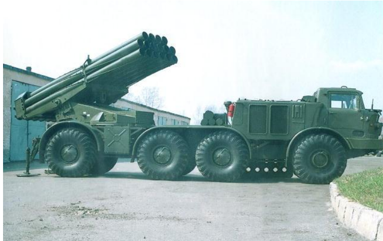
3. ábra. Tüzérségi sorozatvető tüzelési helyzetben (BM–22) 6

A légi aknatelepítő rendszerek rendeltetése a művelet során az ellenség hadműveleti mélységében nagy kiterjedésű szórt aknamezők gyors létrehozása. Alkalmazhatóak az összpontosítási- és megindulási körletek, az előrevonási útvonalak, a szétbontakozási terepszakaszok, a tüzérségi, légvédelmi és más fegyverek tüzelőállásai, a vezetési pontok települési helyei, valamint a fontosabb műtárgyak, átkelőhelyek és azok körzetének aknásítására.