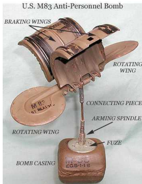
6. ábra. M83 típusú légi telepítésű robbanószerkezet 10

E gyalogság elleni repeszaknák amerikai megfelelője is megjelent az 1950-es évek elején a Koreai háborúban, M83 néven.