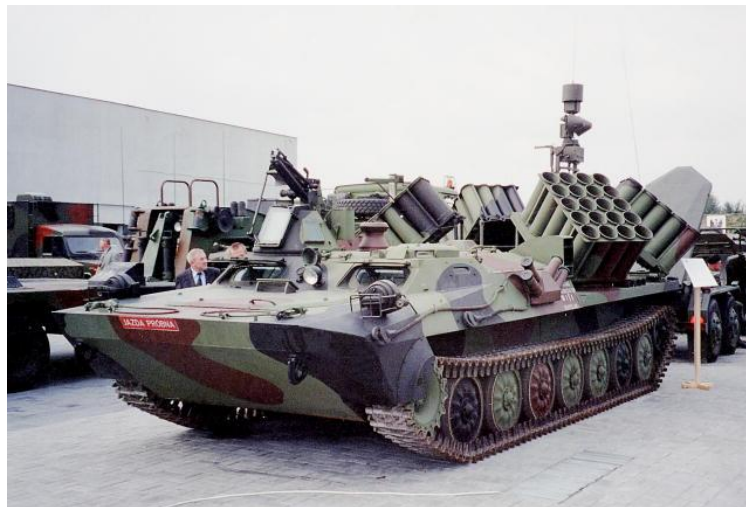
2. ábra. Aknaszóró berendezés MTLB–U lánctalpas járművön 5

A földi bázisú aknatelepítő rendszerek rendeltetése, hogy rövid idő alatt szórt aknamezőket lehessen létrehozni közvetlenül, illetve kis távolságra (50–1000 m) a csapatok állásai előtt a védelmi harc megvívása folyamán. Alkalmazásukra sor kerülhet még a visszavonulás során feladott terepszakaszok aknásításakor, valamint a veszélyeztetett irányok, szárnyak, a már telepített aknamezőkön hagyott átjárók gyors lezárásakor, illetve az aknamezők és más műszaki záruk mélységi kiterjedésének és aknasűrűségének növelése érdekében. Rendkívül nagy előnyeként értékelhető, hogy az ilyen rendszereket minden fegyvernem képes alkalmazni, nincs szükség speciálisan képzett műszaki erőkre.