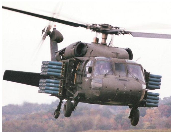
4. ábra. Aknaszóró berendezés helikopterre szerelve (AIR VOLCANO) 7

A rendszer előnye, hogy valójában csak a repülőgépek, helikopterek hatótávolsága szab korlátot a telepítési távolságnak, azonban mindenképpen hátrányként értékelhetjük, hogy a telepítést végző eszközök az ellenséges légvédelem tüzének teszik ki magukat, valamint az aknásításnál „fontosabb” feladatra történő átcsoportosításuk esetén csak a tüzérségi eszközökre lehet támaszkodni a mélységi területek aknásítása során. A speciális bombleteket és szubmuníciókat tartalmazó bombák gyártási költsége igen magas (pl. CBU széria: 15 000 USD/db), ami további hátrányként értékelhető.