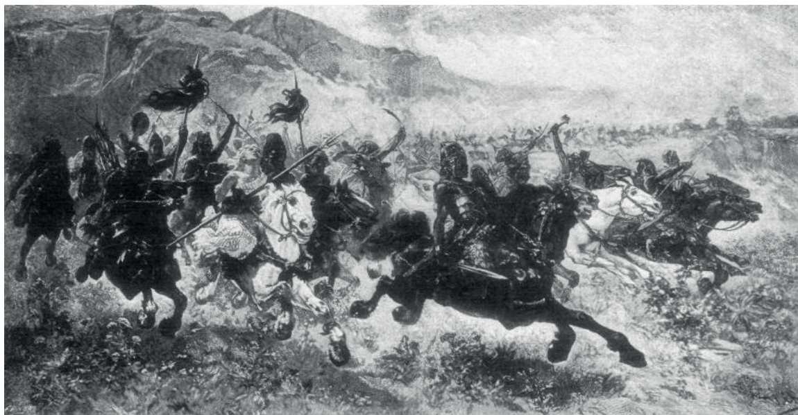
1. ábra: Ulpiano Checa (1860-1916, spanyol festő): Attila Itália ellen vezeti a hun hordákat. = Attila dirigiendo a húno hordas contra Italia (spanyolul) = Els huns, liderats per Àtila, envaeixen Itàlia (katalánul)

Joggal feltételezhető, hogy a fél Európát könyörtelenül feldúló, „vandál” (eredetileg andalúziai!) 3 , illetve barbár pusztítást végbevivő hunok öröksége, a nevükből képzett egyetlen nép- és ország megnevezés, 4 Hungarian, Hungary, Ungarisch, Ungarn, Hongrois, Hongrie, Ungherese, Ungheria, Húngaro, Hungria stb. az amerikai, nyugat-európai társadalmi tudatban még ma is valami olyan képzetet (imázst) kelt, mint a magyarokéban például a tatár, Tatórország. „Jó napot kívánok, tatár vagyok, Tatórországból jövök” – hogy hangzik? Ennél rosszabbul egy európai ország nem is indulhatna az országimázs adottság, az országmárka formázás, és az ország-marketing terén. A továbbiakban lássuk, mi az országimázs, mi az országmárka, és – menthető-e a beteg?