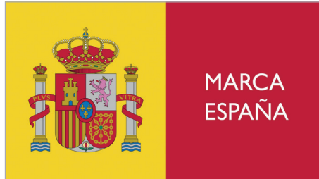
5. ábra: Marca España, a spanyol minőség védjegye

kutatási kört. A másik kutatási körben Spanyolország vezető vállalatai szerepelnek, mint például a Balay , Campofrío , Aviva , Ernst and Young . A MESÍAS projekt első felmérése a spanyol exportőrök, valamint a Spanyolországból származó termékek és szolgáltatások nemzetközi piacon való megítélésére irányult, amely alapján a Marca España Confidence Index (Spanyol Márka Bizalmi Indexe) alakul.