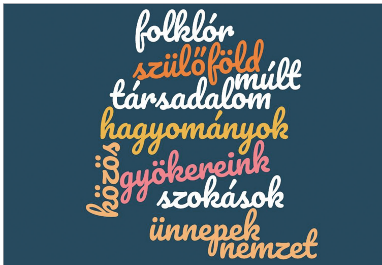
7. ábra: Hungarikum-szófelhő