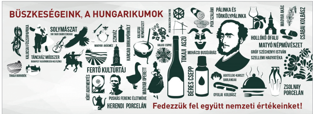
6. ábra: Büszkeségeink, a hungarikumok

helyezni az állami, a vállalkozói és a magánszféra együttműködése által, a három szektor együttműködése elengedhetetlen a fejlesztéshez. Ennek koordinálásában az értéktár bizottság aktivitása nélkülözhetetlen.