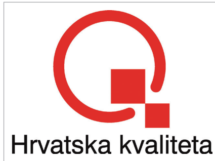
4. ábra: Hrvatska kvaliteta (Horvát Minőség)

megerősítése hivatott szolgálni. A Made in Britain civil kezdeményezésű szervezet célja a Nagy-Britannia és Észak-Írország területén gyártott, bármilyen formában előállított termékek megkülönböztetése más, exportált árucikkektől, továbbá az Egyesült Királyság turisztikai termékként való népszerűsítéséért a Visit Britain és Visit England szervezet felelős. A Hrvatska kvaliteta , azaz a Horvát Minőség jelölés olyan termék csomagolására helyezhető fel, illetve olyan szolgáltatás népszerűsítésében használható, amely megfelel a minőségi előírásoknak, valamint előállítása Horvátországban történik.