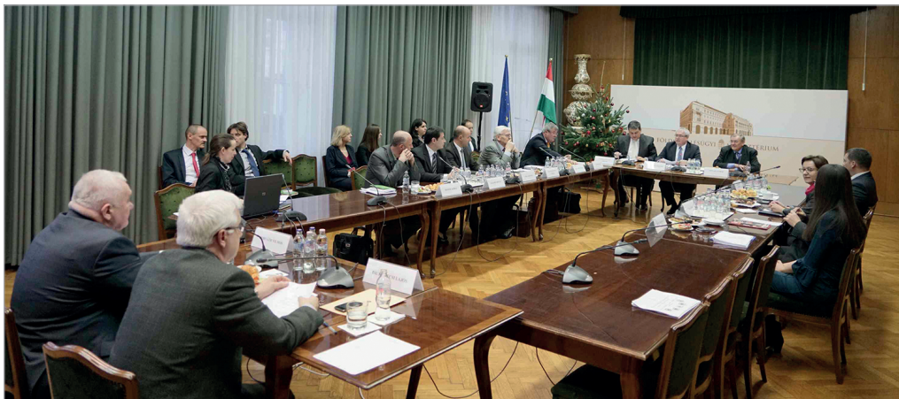
4. ábra: Ülészék a Hungarikum Bizottság