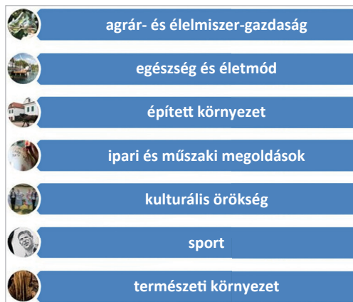
3. ábra: Szakterületi kategóriák

A külhoni magyarság értéktárai az egységesség érdekében ugyanezeket a szakterületenkénti besorolásokat alkalmazhatják.