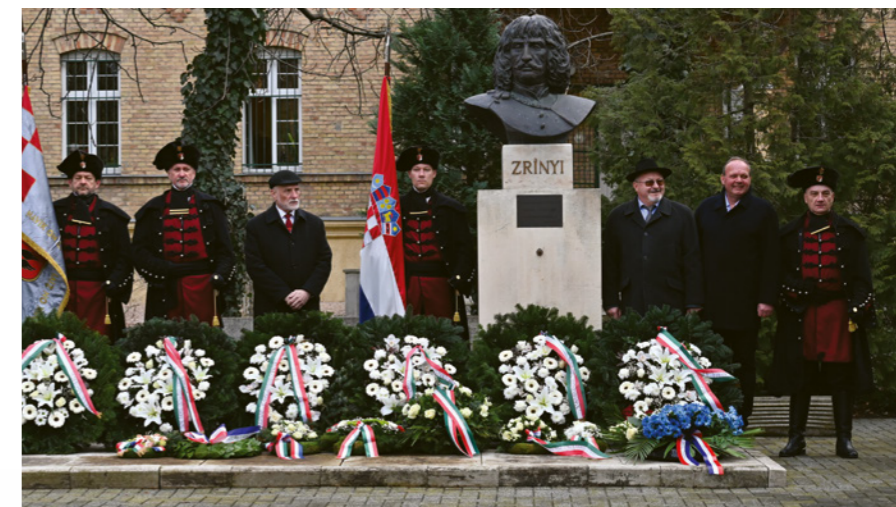
A történelmi hagyományörző Csáktornyai Gárda tagjai is részt vettek az ünnepségen