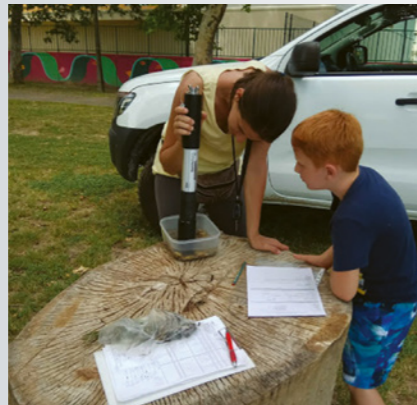
A bevonat klorofill koncentrációjának mérése Benthos Torch készülékkel