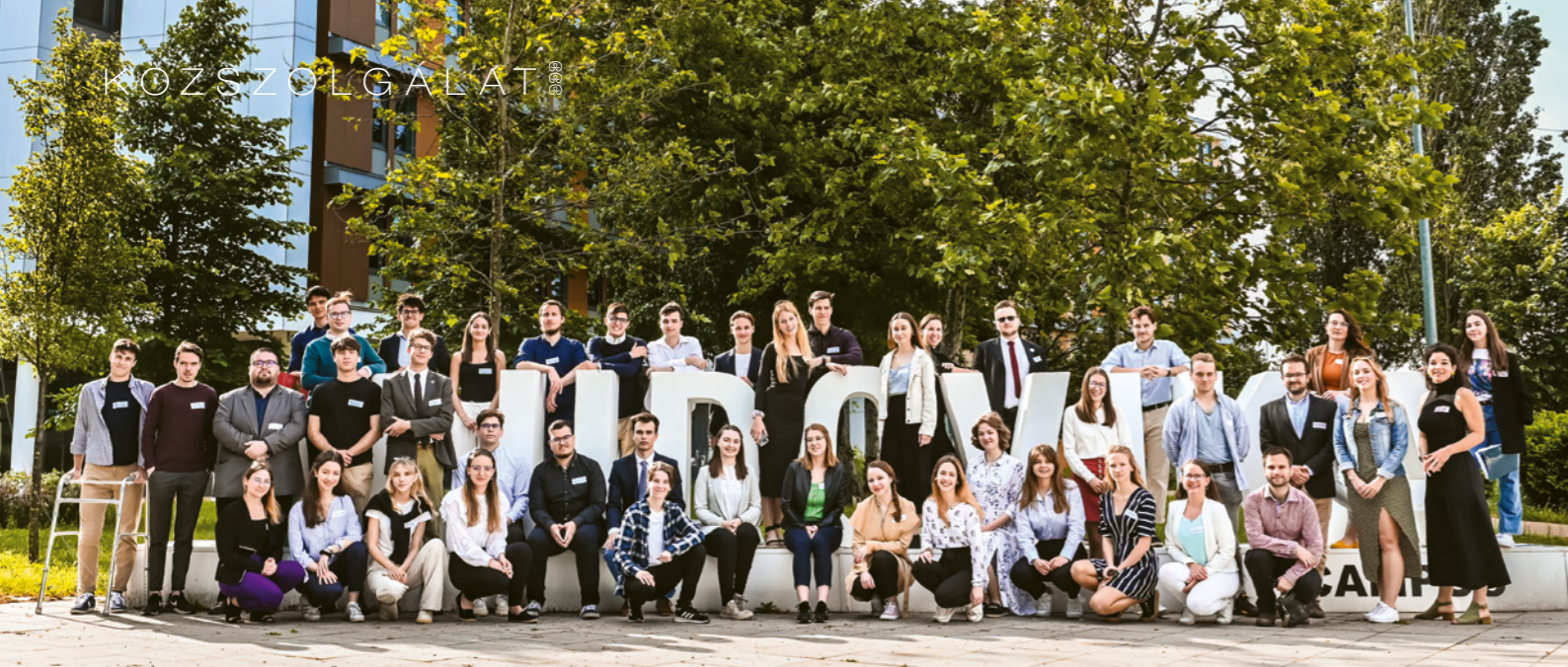
A Ludovika Collegium negyedik évfolyamába felvételiző fiatalok az NKE campusán

nyelvvizsgálója, annak térítésmentesen biztosítunk lehetőséget tudásának fejlesztésére mindaddig, ameddig meg nem szerzi a bizonyítványt” – jelentette ki Velkey György László. Elmondta, hogy igény szerint más nyelvek oktatását is lehetővé teszik a nyelvi lektorátussal együttműködve.