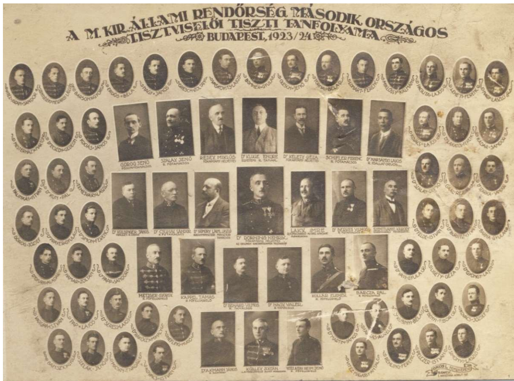
7. sz. képmelléklet

A M. Kir. Állami Rendőrség második országos tisztviselői tiszti tanfolyamának tablója, 1923/1924.