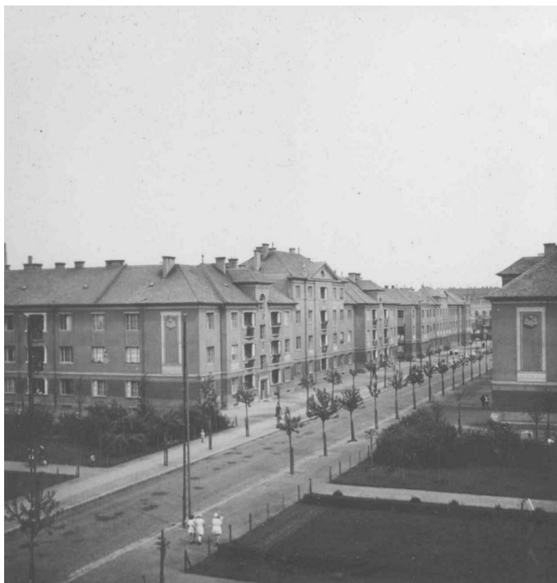
11. sz. képmelléklet A Dagály utcai rendőr lakótelep, 1933.