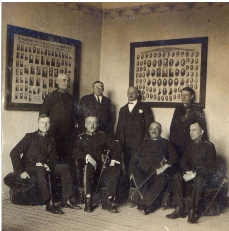
8. sz. képmelléklet

A M. Kir. Állami Rendőrség második országos tisztviselői tiszti tanfolyamának tablója, 1923/1924.