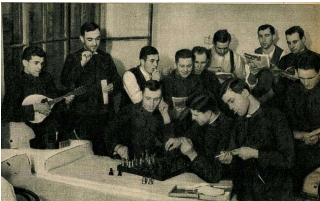
4. sz. képmelléklet Délutáni „szabadfoglalkozás” a kisrendőrök laktanyájában. Sakkoznak, muzsikálnak, olvasnak és szórakoznak a jövő rendőrei, 1938.