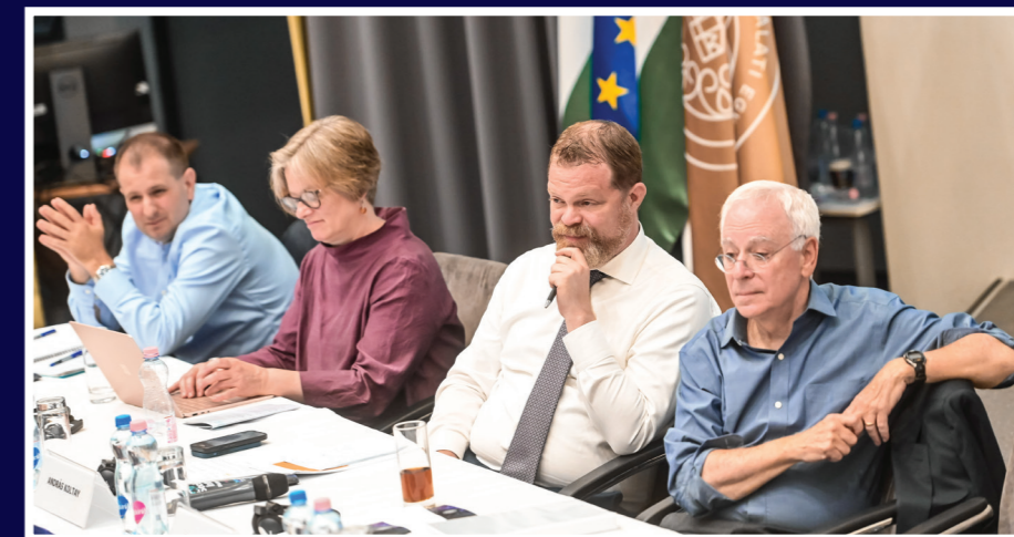
Koltay András, az NMHH elnöke (j2) és Robert Post, a Yale Law School professzora (j1)

a munkajog) és a kommunikációhoz és társadalomhoz kötődőt (ez a tartalom-moderálás vagy a fake news kérdéseit veti fel). Az előadó az átláthatósággal kapcsolatos kihívásokat részletesen ismertette, majd az ezekre adható megoldásokról – egyebek mellett az elszámoltathatóságról, a szankciókról, az auditálhatóságról, a megfigyelhetőség feltételeiről – szólt. Az új jogi megközelítések kapcsán bemutatta az uniós és a japán szabályozást, és említést tett a távol-keleti gyakorlatról is. Zódi Zsolt, az NKE EJJK ITKI tudományos főmunkatársa a digitális