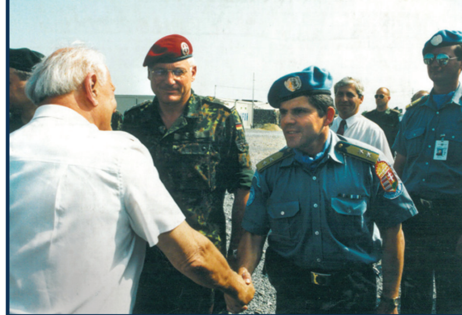
Göncz Árpád köztársasági elnökkel Okucaniban

2015-ben kapóra jött a Rendészettudományi Kar (RTK) dékáni pályázata, mert szerettem volna a nyugdíjazás felső korhatáráig – 65 éves koromig – szolgálni. Nem ismertem a felsőoktatást, de eredményes, szép három