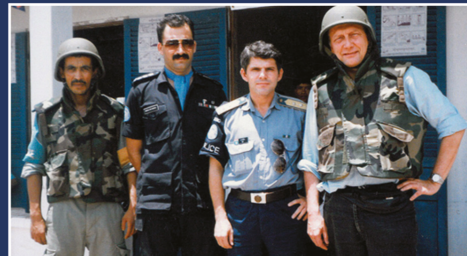
Kambodzsában, mint megyei rendőrfőkapitány

Visszautasíthatatlan ajánlatot kaptam: előléptetést, lakást, fizetésemelést és USA-beli kiképzést. Ennek ellenére kikértem katonai előjáróim véleményét, hiszen nagyon szerettem volna a szolnoki mélységi felderítő alakulat parancsnoka lenni; azonban már zajlott a honvédség leépítése, így ott nem kaphattam parancsnoki beosztást. Az RKSZ egy igazán fegyelmezett, jól felkészült, különleges rendőri alakulattá vált. Számos sikeres elfogást (elsősorban veszélyes, fegyveres bűnözők) és biztosítást (pápalátogatás, izraeli rendőrfőnök látogatása stb.) tudhattunk magunk mögött.