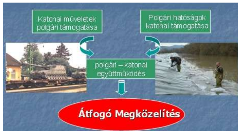
1. ábra. A Polgári Veszélyhelyzeti Tervezés feladatrendszer. (Keszely László, 2013.)

A kollektív védelemi erőfeszítések terén napjainkban is a szárazföldi, tengeri és légi szállítás civil eszközökkel történő támogatása az egyik legjellemzőbb feladat. Mellette azonban egyre nagyobb jelentőségre tesz szert a kritikus infrastruktúrák védelme, vagy a terrorizmus elleni harc. Ez utóbbira jó példa az Active Endeavour fedőnevű, V. Cikkely szerinti terrorellenes művelet a mediterrán térségben, ahol civil hajózási szakértők adnak tanácsot a szövetséges haditengerészeti erők részére a hajók átkutatásával kapcsolatos kereskedelmi és nemzetközi jogi szabályokról, eljárásokról.[3]