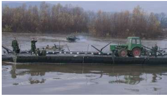
14. ábra. A Tisza zászlóalj gyakorlata.

Megemlítendő még, hogy a magyar katonák nemzetközi együttműködés formájában is részt vesznek a katasztrófavédelmi feladatokban. 1999-ben jött létre Magyarország, Románia és Ukrajna részvételével a „Tisza” Többnemzeti Műszaki Zászlóalj, amelyhez később Szlovákia is csatlakozott. Az erre vonatkozó nemzetközi egyezmény nyitott a régió bármely állama részére, amely hajlandó és képes részt venni az alakulat tevékenységében. A zászlóalj megalakításának célja egy olyan többnemzeti katonai képesség létrehozása és működtetése, amelyben az egyes nemzetekből kijelölt erők támogatják egymást a Tisza vízgyűjtő területén bekövetkezett katasztrófa esetén, továbbá részt vesznek a következmények felszámolásában, a károk enyhítésében, megszüntetésében. A zászlóaljat alkotó nemzetek képviselői rendszeresen találkoznak az alakulat működtetésével kapcsolatos kérdések megvitatása, közös tapasztalatcsere, illetve közös gyakorlatok végrehajtása céljából. Az viszont elgondolkoztató, hogy a Tisza Zászlóalj éles helyzetben történő bevetésére eddig nem volt példa, holott a megalakulása óta nagyobb árvíz többször is előfordult a Tiszán és környékén.