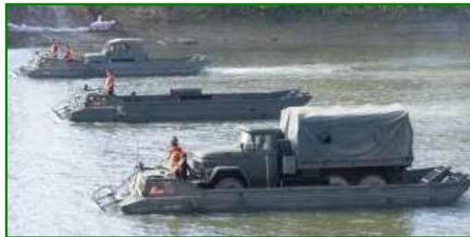
12. ábra. Nehéz kételtű mentő csoport

A nehéz kételtű mentő csoport árvízi katasztrófák esetén nehezen járható terepen és vízen felderítési, szállítási és mentési feladatokat tud végrehajtani.