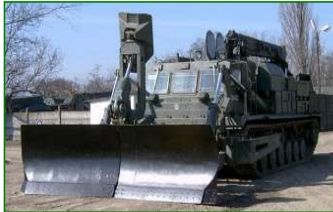
11. ábra. Nehéz földmunkagép és gépi romeltakarító csoport

A nehéz földmunkagép- és gépi romeltakarító csoport eszközei különböző talajmozgatási, romeltakarítási, tereprendezési feladatok végzésére képesek.