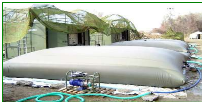
13. ábra. víztisztító csoport eszközei

A víztisztító csoport víznyerés, víztisztítás és ivóvízzel való ellátás biztosítására, és ezzel járványok megelőzésére is alkalmazható. Munkájuk mind a lakosság, mind a beavatkozó állomány ellátásának alapjául szolgálhat. A HKR a szükséges eszközök transzportjának megoldását is biztosítani tudja.