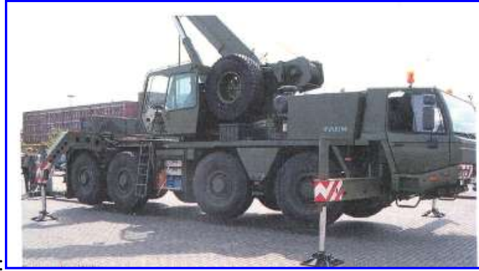
8. ábra. Emelőgép csoport