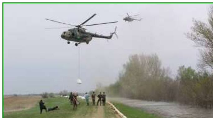
10. ábra. Légi csoport

A légi csoport feladatai közé tartozik a légi felderítés, személyek mentése és gyógyintézetbe szállítása, elzárt körzetek élelmiszerrel, gyógyszerrel történő ellátása, levegőből történő gátmegerősítés, valamint tűzoltásban való részvétel.