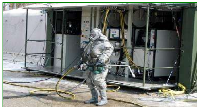
7. ábra. Atom-, biológiai-, vegyi mentesítő csoport (forrás: A honvédelmi katasztrófavédelmi rendszer végrehajtó erői, összetétele és képessége, előadás HM Vezetési és Doktrinális Központ, 2013)

Az atom-, biológiai-, vegyi mentesítő csoport feladata technikai eszközök, személyi állomány, anyagok és felszerelések, szilárd burkolatú utak, objektumok sugármentesítése.