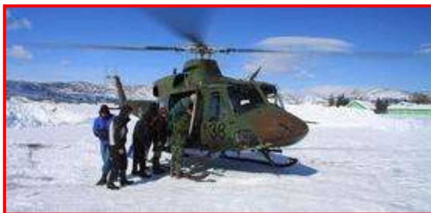
2. ábra. NATO segítség hóhelyzetben, Montenegró 2012.

1998-ban jött létre az Euro-atlanti Katasztrófavédelmi Koordinációs Központ (EADRCC), amely a CEPC operatív szervének szerepét tölti be. A nemzetek elsősorban a központhoz fordulhatnak katasztrófa esetén, amely a beérkezett igényeket összehangolt módon továbbítja a tagállamokhoz és a partner országokhoz. A legfrissebb adatokat tekintve az EADRCC 2012-ben két szövetséges (Albánia, Törökország), és két partner ország (Jordánia, Montenegró) kérésére nyújtott segítséget. Albánia és Montenegró esetében a rendkívüli téli időjárási körülmények, a nagy mennyiségű hó által okozott nehézségek leküzdésében közvetített a központ a szövetségesek és partnerek között. Törökország és Jordánia kérésére a Szíriából tömegesen érkező menekültek elhelyezését, ellátását megkönnyítő nemzeti hozzájárulásokat segítették elő az EADRCC munkatársai. A menekültek nem szűnő áradata miatt ezek az EADRCC 2013-ra áthúzódó feladatai közé tartoznak.[4] A központ által szervezett „GEORGIA 2012” nemzetközi következménykezelési gyakorlaton az átfogó megközelítés szellemében első alkalommal került sorkatonai elem bevetésére a NATO Katonai Komponens CBRN Védelmi Erő formájában.[5]