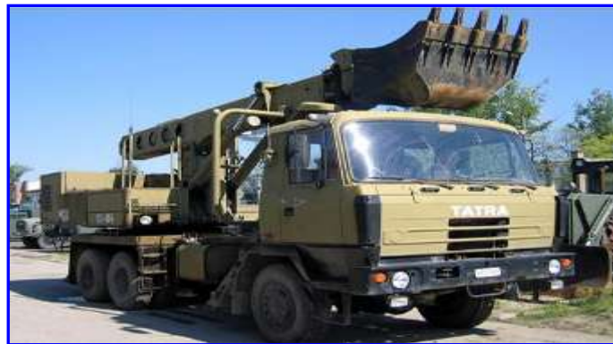
9. ábra. Könnyű földmunkagép és gépi romeltakarító csoport

A könnyű földmunkagép- és gépi romeltakarító csoport különböző talajmozgatási, épületbontási és romeltakarítást célzó feladatok végrehajtása, és utak iszaptól való megtisztítása során jól alkalmazható.