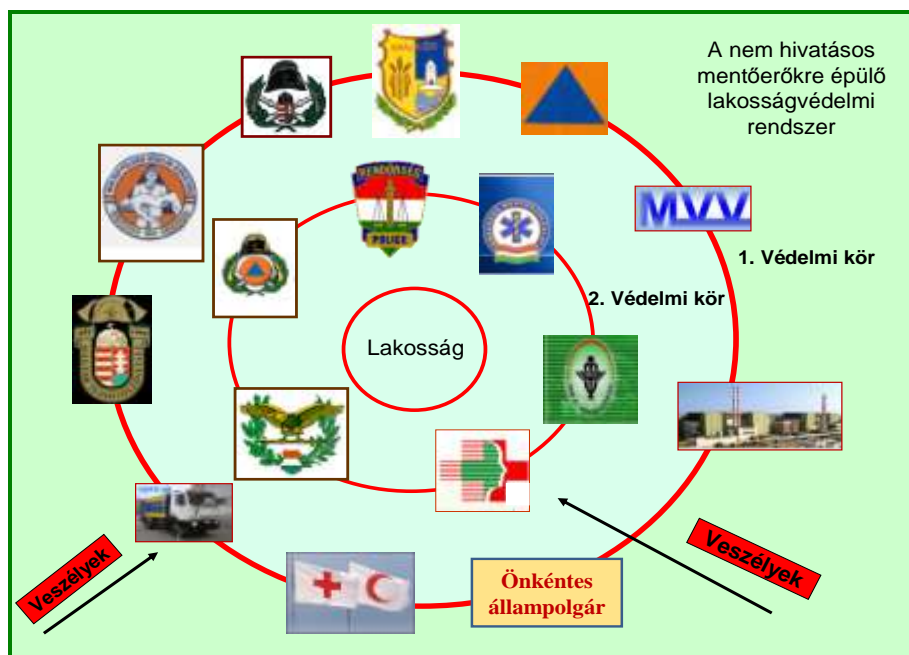
4. ábra. A nem hivatásos mentőerőkre alapozott lakosságvédelem védelmi körei.

Sok ország nem a hivatásos mentőerőkre alapozott lakosságvédelmi rendszert alakított ki, hanem a települések védelmi képességeit (eszköz, erő, védelmi tervek, felkészültség, védelmi vezetési rendszer stb.), és az állampolgárok abban való aktív közreműködésére fektette a fő hangsúlyt. Ebben az esetben az elsődleges védelmi kört a különböző társadalmi és civil mentőszervezetek, a településeken található gazdálkodó szervezetek védelmi egységei jelentik, továbbá a felkészült és fejlett önmentési képességekkel rendelkező lakosságra alapoz. Az állami, hivatásos mentőerők, a védelem 2. köréként, csak akkor avatkoznak be, amikor a helyi erők nem elegendők, illetve csak olyan mértékben, amely a helyzet eszkalálódásának megakadályozásához és a kárelhárításhoz szükséges. Ezt a helyzetet mutatja be a 4. sz. ábra. Hazánkban sok szakember ezt a védelmi formát tartja ideálisnak, mert szerintük ez csökkenti az állami kiadásokat, és a helyi lakosok aktivitásával hatékonyabb és eredményesebb védekezés jöhet létre. Hátrányként említik meg viszont azt a tényt, hogy a települések eltérő védelmi képességekkel fognak rendelkezni, és ez egy több településre kiterjedő katasztrófa esetén komoly problémát és zavart okozhat a védekezés megszervezése terén.