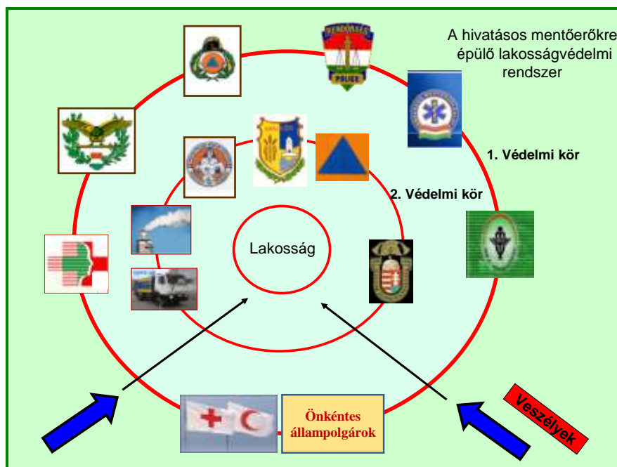
3. ábra. A hivatásos mentőerőkre alapozott lakosságvédelem védelmi körei

Tovább ronthatja a helyzetet, ha az állampolgárok nincsenek felkészítve, és nem rendelkeznek megfelelő szintű önmentési, túlélési képességekkel (tartalékok képzése, megfelelő ismeretek, védelmi igények elfogadása stb.).