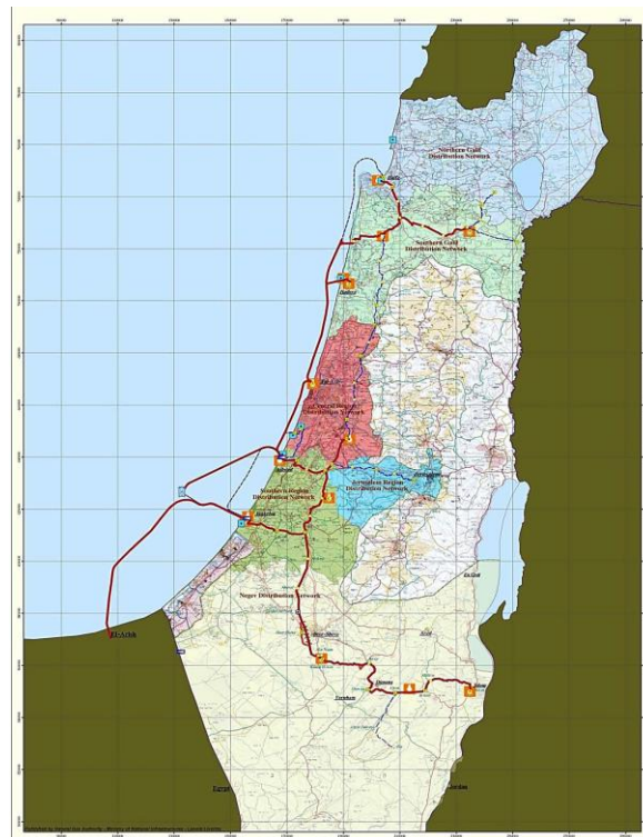
2. sz. ábra: Izrael szárazföldi földgázvezetéke.

Az izraeli szárazföldi földgázvezetékek hossza 400 km, a tenger alatt további 90 km hosszú vezeték húzódik, amelyek a tengerparti Askelon városából kiindulva összekötik az ipari vállalatokat, mint az Izrael Vegyiműveket, a Holt-tenger Üzemet, a Nesher Izraeli Cement Vállalatot, az asdodi kőolaj-finomítót, a Hadera Papírgyárat, a Haifa melletti hagiti erőművet, valamint az IEC további állomásait. 24