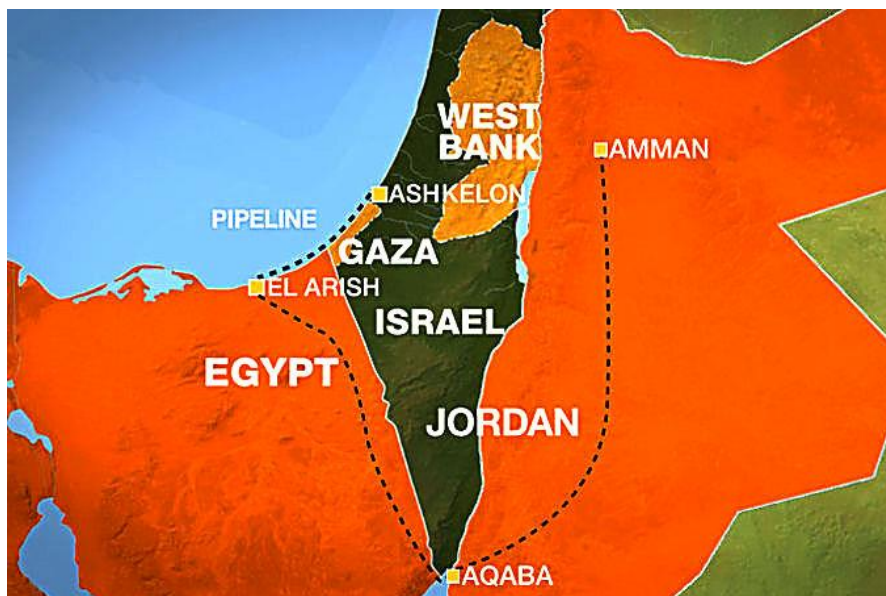
3. sz. ábra: Az egyiptomi földgázvezeték

Az izraeli gazdaság a saját gáztermelésén kívül korábban Egyiptomtól szerezte be szükségleteinek 40%-át. Izraelnek újabb földgáz beszerzési partner után kell néznie, mivel az egyiptomi szállítás egyre bizonytalanabbá vált és folyamatos nehézségekkel járt. A gázvezeték a Sínai-félszigeten fekvő egyiptomi al-Arish és az izraeli Askelon városok között a tengerben húzódik. 2005-ben létrejött a 15 évre (és további 5 évre) szóló kereskedelmi megállapodás 25 évi 1,7 milliárd köbméter gáz szállításáról az egyiptomi East Mediterranean Gas SAE (EMG) 26 és az izraeli Israel Electric Corporation Ltd. (IEC) között. Az EMG 2008 közepén kezdte el teljesíteni a szerződésben foglaltakat, de egy évre rá már megszegte a megállapodást. A vállalat indokai között szerepelt az új mezők kiaknázásának késedelve, az időjárás miatt megnövekedett gázfogyasztás és az ellátórendszer működési zavarai. Az IEC felülvizsgálta a 2005-ben kötött szerződést, és néhány pontban módosítást hajtott végre az EMG-vel egyetértésben: a szerződésben megállapított rögzített ár helyett bevezették az időszakos árkorrekciót (figyelembe véve a földgáz világszintű árának változását), csökkentették az egyiptomi fél által exportált földgáz mennyiségét, vállalták, hogy hatékony intézkedéseket vezetnek be a gáz akadálytalan szállítása érdekében. 27 Az EMG további elektromos áramszolgáltatással is foglalkozó izraeli partnerrel, a Dorad Group-pal is szerződött – 17 évre, évi 0,75 milliárd köbméter gáz exportjára. 28