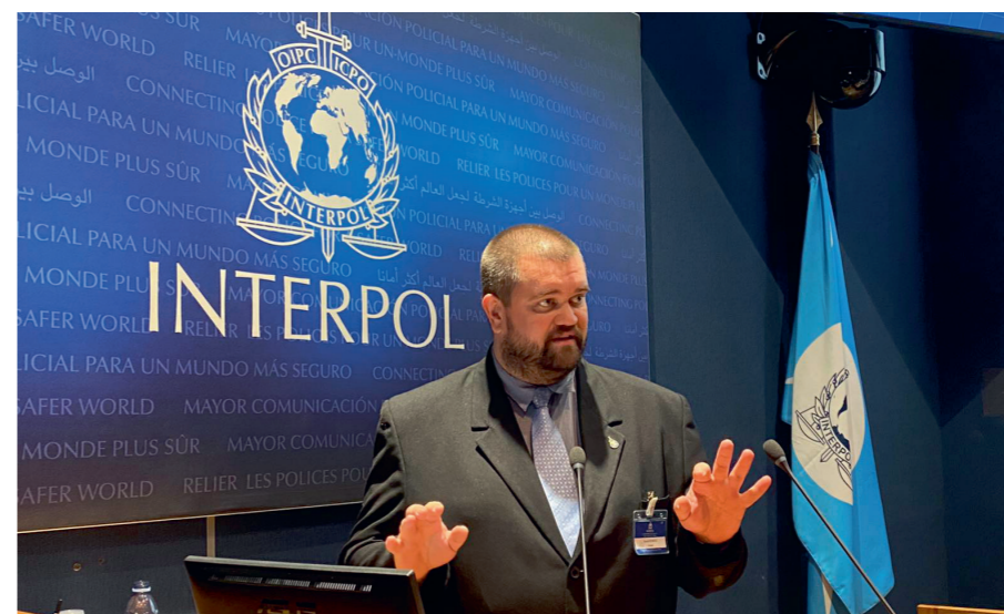
DVI-előadás Lyonban az Interpol parancsnokságán

Megyei Rendőr-főkapitányságon teljesítette. Itt ismerkedett össze a pályafutása szempontjából fontos szerepet betöltő oktatóval, aki javasolta, ismerkedjen a bűnügyi technikával, közérthetőbben: a helyszíneléssel. „Az egyetemi évek alatt vizsgáló szerettem volna lenni, mert olyan méltóságteljesnek tűnt a kép, ahogy ülök az irodában és irányítom a kihallgatást, ez rendkívül tetszett” – emeli ki, majd hozzáteszi: „tudtam, hogy hiába végzem el a jogot, kvázi az utcáról beesve nem dolgozhatom egy megyei vizsgálaton, ahol mondjuk emberöléssel kell foglalkozni.” Így vetődött fel, hogy a bűnügyi technikával kezdjen dolgozni, ahol rengeteg hasznos tapasztalatot szerzett a nyomozás alapjairól, amelyek elősegítették későbbi vizsgálói munkáját. Először a megyei, majd, a hivatásos fokozat megszerzése után, a pécsi városi ügyekkel kellett megbirkóznia. „Annyira beleszerettem a technikába, hogy amikor bő egy év után lehetőségem volt elmenni vizsgálatra, szinte rossz szájjal váltottam; egy újabb év múlva visszakértem magam, a megyei