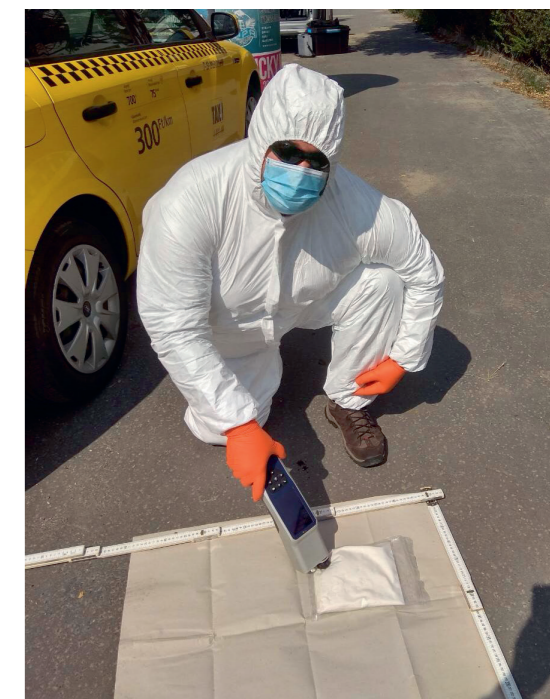
Helyszínelés Zsámbokon 2017-ben

történt: hogy fröccsent, hogy csorgott, mint Dexternek a tévében.” Elmesélte, hogy az Interpol tömegszerencsétlenségek áldozatainak azonosításával foglalkozó protokolljának mintájára létrehozott magyar DVI-egység (disaster victims identification), azaz áldozatazonosítási csoport egyik alapító tagjaként első komolyabb bevetése a 2019-ben bekövetkezett Hableány hajót érintő katasztrófa áldozatazonosítási munkáiban való részvétel volt. Emellett emlékezetes marad számára egy 2009-es pécsi kettős öngyilkosság helyszínelése során szerzett tapasztalata is. »