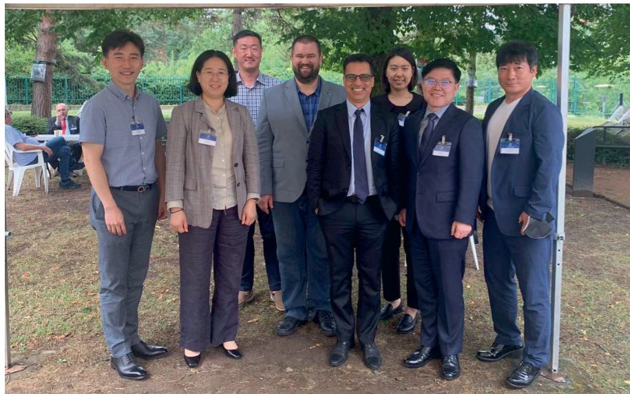
Koreai DVI-csapat Lyonban az Interpolnál