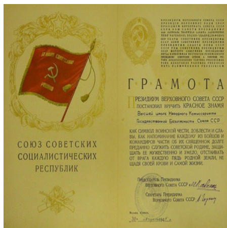
4. ábra: Vörös Zászló és azt tanúsító oklevél