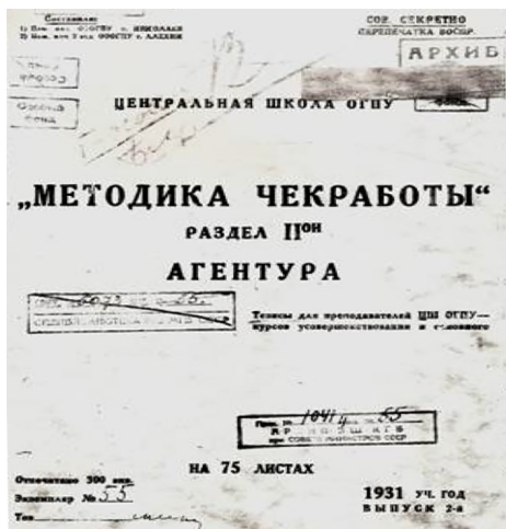
3. ábra: Az operatív munka módszertana

Az 1920-as évektől kezdve folyamatosan jelentek meg az előadások és a normatív dokumentumok mellett az első oktatási segédanyagok (3. ábra).