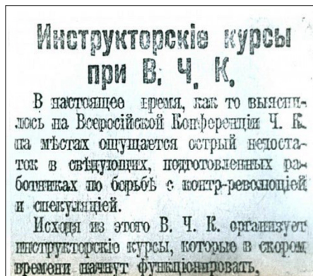
1. ábra: Kiképző kurzusok indítása a Cseka alatt

A Cseka képzési rendszer létrehozásának komoly lépése az első tanfolyamok megnyitása volt 1918. szeptemberben. A résztvevők a bizottságok alkalmazottai, párt- és szovjet munkások voltak. Belőlük kerültek ki a Cseka későbbi osztályainak vezetői, nyomozói, biztosai, hírszerzői és kiképzői (1. ábra).