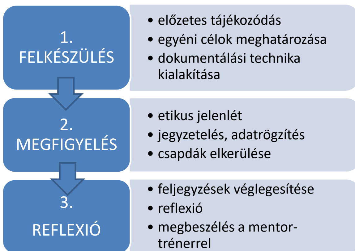
1. ábra: A hospitálás szakaszai és akciólépései

A hospitálás három jól elkülöníthető szakaszra tagolható: felkészülés, megfigyelés, reflexió. A három szakasz mindegyike további lépésekre bontható, az egyes lépésekhez konkrét feladatok kapcsolódnak. Ezért is állítottuk korábban azt, hogy a hospitálás nem passzív megfigyelést, hanem aktív, önálló tanulói munkát feltételez, amely felelősséggel jár. A tananyag további részében a hospitálás szakaszait és az egyes szakaszokhoz kapcsolódó feladatokat részletezzük az alábbi sorrendben: