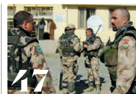
A karácsony mindenkinek jár