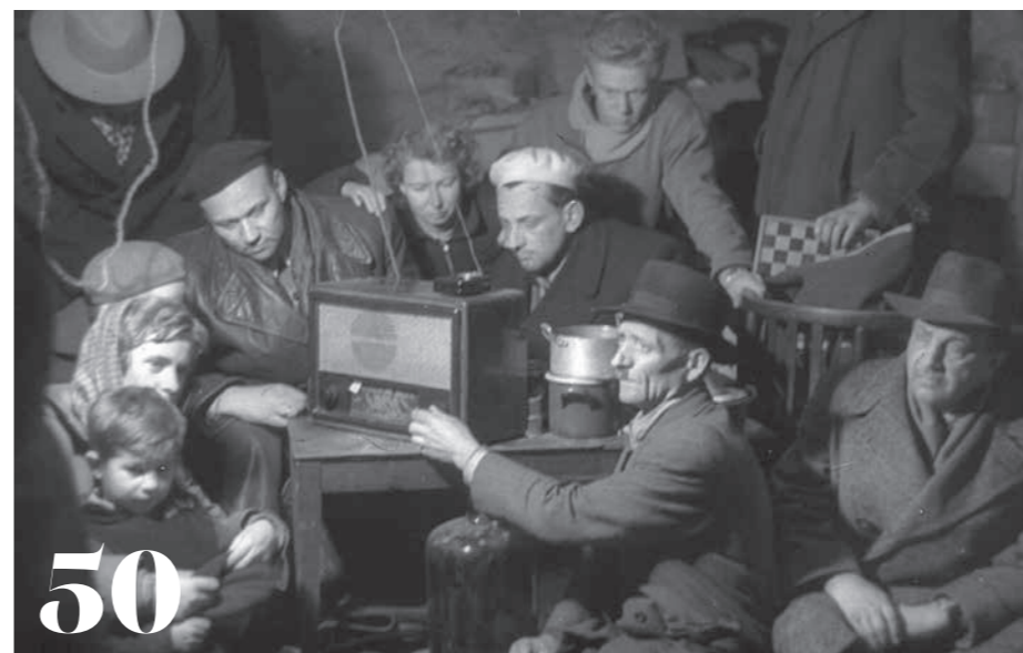
„Szól a rádió...” – énekelte meg az LGT a rádiózás történetét a hetvenes évek végén, s akkor még valóban úgy szólt a rádió, hogy igazi közösségszervező ereje is volt. Azóta nagyot változott a világ, de szerencsére a rádiózást nem felejtettük el, csak a rövidhullámról az internetre költöztettük. A magyar rádiózás idén 90 éves.