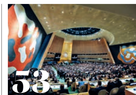
„Egyedülálló, felbecsülhetetlen értékű és nélkülözhetetlen lett az ENSZ”