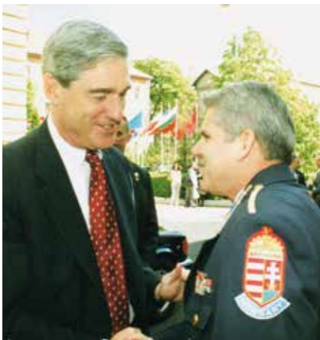
ROBERT S. MUELLER FBI-IGAZGATÓVAL, 2005.