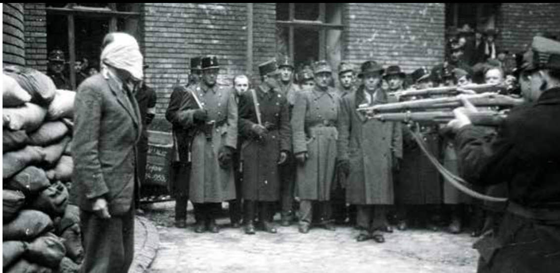
IMRÉDY BÉLA KIVÉGZÉSE / OSZK

A pereket, különösen a kirakatpereket, mindig végigkísérte egy korábban ismeretlen intenzitású sajtókampány. A legkülönbözőbb formában: vezércikkek, tudósítások, „olvasói levelek”, regények, novellák, versek, alkalmi csaszustukák stb. követelték útszéli hangnemben a vádlottakkal szembeni minél kíméletlenebb eljárást és ítéletet. Leírták például a letartóztatott korábbi nevét, ezzel is az ideggyűlöletet, antiszemizmust sugallták. Minden eszközzel igyekeztek lejáratni a vádlottakat.