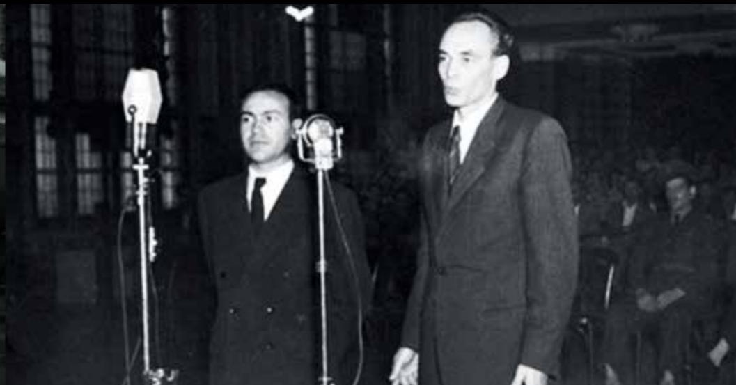
RAJK LÁSZLÓ PERE

Ezeknél a pereknél a forgatókönyv elkészítésekor fordított sorrendet alkalmaztak. Először a politikai vezetés vagy a politikai rendőrség kitalálta a koncepciót: kit és milyen tényállás alapján kell elítélni. Ezután indították meg a gyanúsított ellen az eljárást, gyűjtötték össze a hamis bizonyítékokat, kényszerítették ki a beismerő vallomást, készítettek el a vádiratot és hozták meg végül az ítéletet. Az ítéletek az idegen hatalom részére történt kémkedésről, a fennálló rendszer elleni összeesküvésről, izgatásról, deviza-bűncselekményről szóltak, esetleg árufelhalmozással és spekulációval vagy kuláksággal vádolták meg az áldozatokat. Az egyszerű állampolgárok ellen lefolytatott tömeges eljárásnál gyors és hatásos módszert alkalmaztak. Házkutatás esetében fegyvert vagy valutát „találtak náluk”, vagy ami még ennél is egyszerűbb megoldásnak bizonyult, elítélték őket „tiltott határátlépés kísérletéért”. Sokakat nem politikai, hanem valamilyen köztörvényes bűncselekménnyel vádoltak meg.