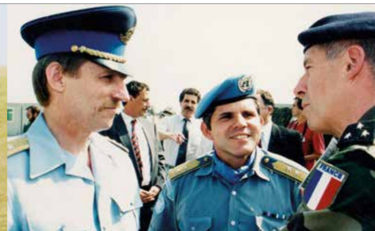
ENSZ RÉGIÓ RENDŐRFŐKAPITÁNYKÉNT BOSZNIA-HERCEGOVINÁBAN (1996-1997)

A többire viszont már saját magam választhattam ki és készíthettem fel az állományt. Mindvégig megpróbáltam gondoskodni róluk, és igyekeztem példát mutatni számukra.