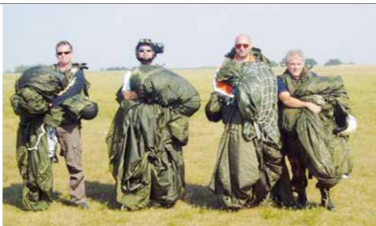
KISKUNFÉLHEGYHÁZA 2007., UGRÁS UTÁN A RENDŐRCSAPATTAL A MEBSZ VETERÁN VERSENYÉN

B. J. A példamutatás. A vezetői képzéseken sok hasznos ismerettel gazdagodtunk. Aki ezeket a magáévá tudta tenni, jó vezető lett belőle. Fontos alapelvnek tartom, hogy annyi tisztelet adjunk meg mindenkinek, mint amennyit másoktól elvárunk. Egy jó vezetőnek megfelelő tudással, intelligenciával és a kulturális különbségek ismeretével is rendelkeznie kell. Kiemelten fontosnak tartom a vezetők részére az idegen nyelv és a szakmai ismeretek elsajátítását is. Tapasztalatom szerint ahhoz, hogy egy szervezet sikeres legyen, be kell vonni az állományt a döntéshozatal megelőző parancsnoki munkába. Ki kell kérni a véleményüket, és csak utána lehet megalapozott döntést hozni a körülmények figyelembevételével. Együttműködőkre van szükség, szövetségeseiket kell keresni, lehetőség szerint befolyásos szövetségeseiket, akiknek a segítségével a kitűzött célok megvalósíthatók.