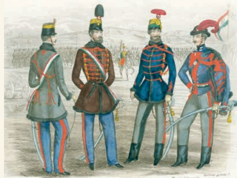
EGYENRUHARAJZOK A SZABADSÁGHARCÓL

Minden regiment más-más színű ruházatot hordott: ahány regiment, annyi színvariáns, sok a piros és a kék, ritkábban zöld, néha sárga s ezek megannyi árnyalata. Nem ritka, hogy egy-egy huszáröltözet négy-öt vagy még több színt vegyített; más és más volt a süveg, a mente és a dolmány, a nadrág és a salavári, a csizma, a zsinór, a tarsolyfedél, a lótakaró színe. Kezdetben az ezredtulajdonosok egyezkedtek a színekről, a század második felében azonban már az Udvari Haditanács döntött. 1768-ban a menték és dolmányok számára négy főszínt állapítottak meg: sötétkéket, világoskéket, sötétzöldet, világoszöldet. A kék árnyalatokhoz ugyanolyan színű, azaz sötét- vagy világoskék, a zöldekhez pedig