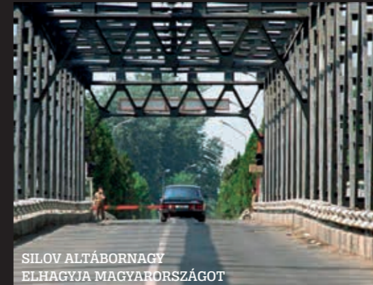
SILOV ALTÁBORNAGY ELHAGYJA MAGYARORSZÁGOT

Takács alezredes szerint az orosz altábornagy sértődöttségének az is az oka lehetett, hogy szovjet részről nem úgy alakultak a pénzügyi kompenzációkról szóló tárgyalások, ahogy azt ők szerették volna. Silov pár nappal később egyébként civilben visszatért Magyarországra, hiszen a szovjet vezetés őt jelölte ki a tárgyalódelegáció egyik vezetőjének. Silov legfőbb feladata az volt, hogy gondoskodjon az anyagi javak teljes körű hazaszállításáról. Takács alezredes szerint ez teljesen ésszerűtlen és gazdaságtalan is volt. A szovjetek ugyanis a laktanyáikat általában otthonról hozott téglákból építették, amit a kivonuláskor tulajdonképpen hazautaztattak. „Mondtam is az egyik szovjet kollégámnak, hogy ezeket a téglákat már aranyárban mérik, hiszen rengeteg pénzbe kerülhetett