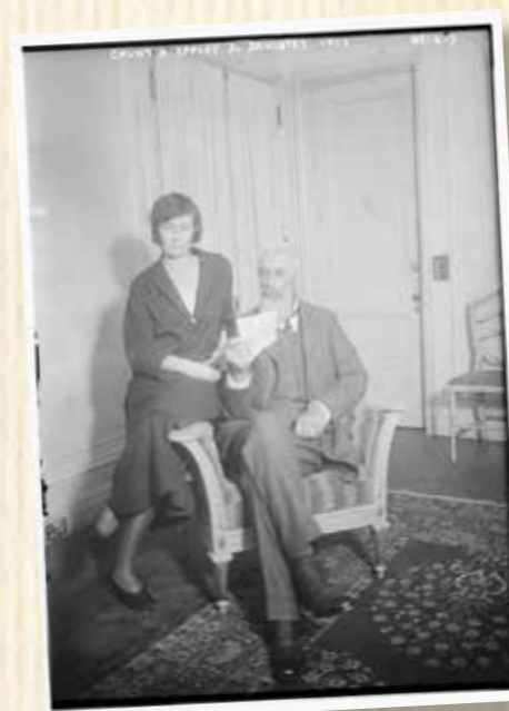
Apponyi Albert és lánya 1923-ban

Apponyi politikai kvalitásait a külföldi politikai élet is elismerte és respektálta. A nemzetközi fórumokon mint a „nemzet ügyvédje” lépett fel, s számtalan beszédben és írásban bírálta a trianoni békeszerződést, tudatosan törekedve arra, hogy a magyarság és a „magyar igazság” ügyének egyetemes érvényességet vívjon ki. A nemzetgyűlés 1922. évi feloszlásának napján az ellenzék az alkotmányvédő bizottság elnökévé választotta. Kétszer volt korelnök, először 1922 júniusában a nemzetgyűlés, illetve 1931 júliusában a képviselőház első ülésén.