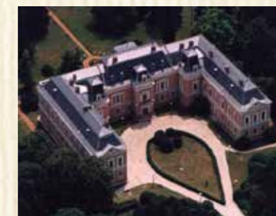
Az Apponyi család hógérszi birtoka, családi címere és lengyel kastélya

főként Németországban, Angliában és Franciaországban, ahol nemzetgazdasági és politikai, valamint képzőművészeti tanulmányokat folytatott. Külföldi útján igazán a francia arisztokraták közül kivált Montalembert gróf volt rá nagy hatással. Az ő házában ismerkedett meg Pierre Guillaume Frédéric le Play-vel, a híres konzervatív szociológussal, akinek munkái komolyan befolyásolták további szellemi fejlődését. 1869 őszén jelen volt a Szezei-csatorna megnyitásánál.