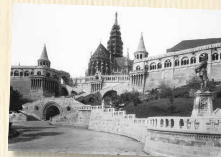
A Mátyás-templomban temették el Apponyit 1933-ban

Apponyi Albert több mint hatvan éven keresztül volt a magyar közélet meghatározó alakja, akit sokan „a legnagyobb élő magyarként” tiszteltek. Gazdag életpálya után, 87 éves korában halt meg Genfben, 1933. február 7-én. Az Országház kupolatermében ravatalozták fel, a budai Mátyás-templomban temették el. „Egész életét a nemzetének áldozta” – írta róla halálakor Herczeg Ferenc.