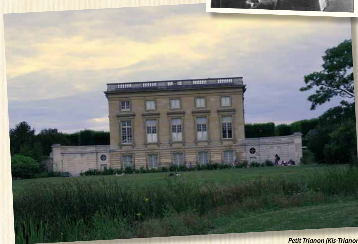
Petit Trianon (Kis-Trianon)

Apponyi politikai kvalitásait a külföldi politikai élet is elismerte és respektálta. A nemzetközi fórumokon mint a „nemzet ügyvédje” lépett fel, s számtalan beszédben és írásban bírálta a trianoni békeszerződést, tudatosan törekedve arra, hogy a magyarság és a „magyar igazság” ügyének egyetemes érvényességet vívjon ki. A nemzetgyűlés 1922. évi feloszlásának napján az ellenzék az alkotmányvédő bizottság elnökévé választotta. Kétszer volt korelnök, először 1922 júniusában a nemzetgyűlés, illetve 1931 júliusában a képviselőház első ülésén.