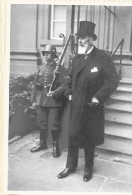
Apponyi Albert mint a nemzet ügyvédje

Kiemelkedő parlamenti és párttevékenysége mellett Apponyi más területeken is jelentős aktivitást fejtett ki. Így külpolitikai, kereskedelmi és közgazdasági ügyekkel is foglalkozott, munkatársa volt a Kelet Népe, a Magyarország és az Ország-Világ című lapoknak, két kötetben pedig kiadta Emlékirataim című munkáját, amelyben bemutatta a kor politikai életét, ismertette politikai nézeteit. Tagja volt a Magyar Földhitelintézet felügyelőbizottságának, a Kisfaludy Társaságnak, az Erdélyrészi Magyar Közművelődési Egyesület (EMKE) választmányának, valamint a Magyar Tudományos Akadémiának is. Elnöke volt a Magyar Közművelődési Egyesületnek, a Budapesti Poliklinikai Egyesületnek, az Országos Katolikus Kongruatanácsnak és a Magyar Védő Egyesületnek. Sokrétű tevékenységét jellemzi, hogy az 1920-as évek első felében Budapest törvényhatósági bizottsága rendes tagjának is megválasztották, de elnöke volt a Szent István Akadémiának, a Magyar Külügyi Társaságnak és a Magyar–Amerikai Társaságnak is. 1901-től valóságos belső titkos tanácsos, 1921 júniusában IV. Károly Hersteinben az Aranygyapjas-rend lovagjává nevezte ki, később megkapta a Lipót-rend nagykeresztjét is. 1929-ben mint a nemzet ügyvédjét beválasztották a Budapesti Ügyvédi Kamarába.