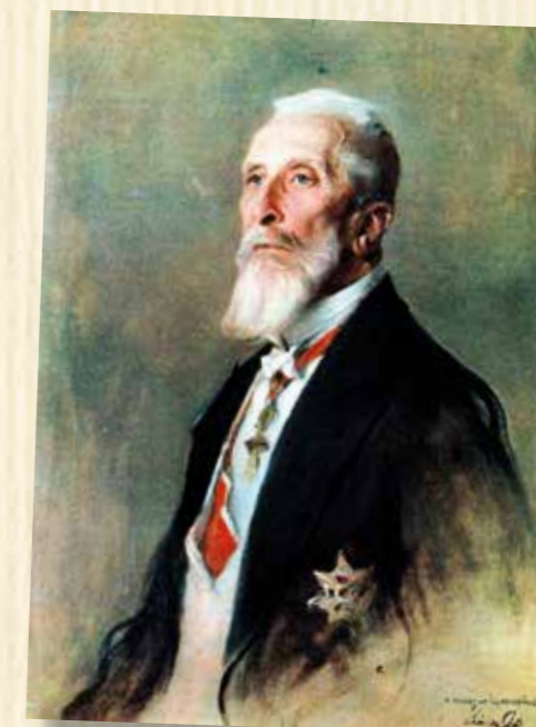
gróf Apponyi Albert portréja László Fülöp Elek festményén

tásügyi miniszteri posztot. Miniszterségének kiemelkedő eredménye a néptanítók fizetésemelése, az állami és az egyházi elemi iskolák jogviszonyának szabályozása, a népoktatás ingyenességéről szóló törvények hitoktatási nyelvredeletével tágabb teret engedett a magyar nyelvnek. Ezeket az iskolai törvényeket „lex Apponyi” néven sok támadás érte a nemzetiségi politikusok részéről. Sokan állították, hogy az elrontott nemzetiségi politika hozzájárult a trianoni tragédiához, így – leegyszerűsítve a történetet – Apponyi korábbi nemzetiségi politikájával veszített Trianonban, nem pedig békedelegatúsi szereplésével.