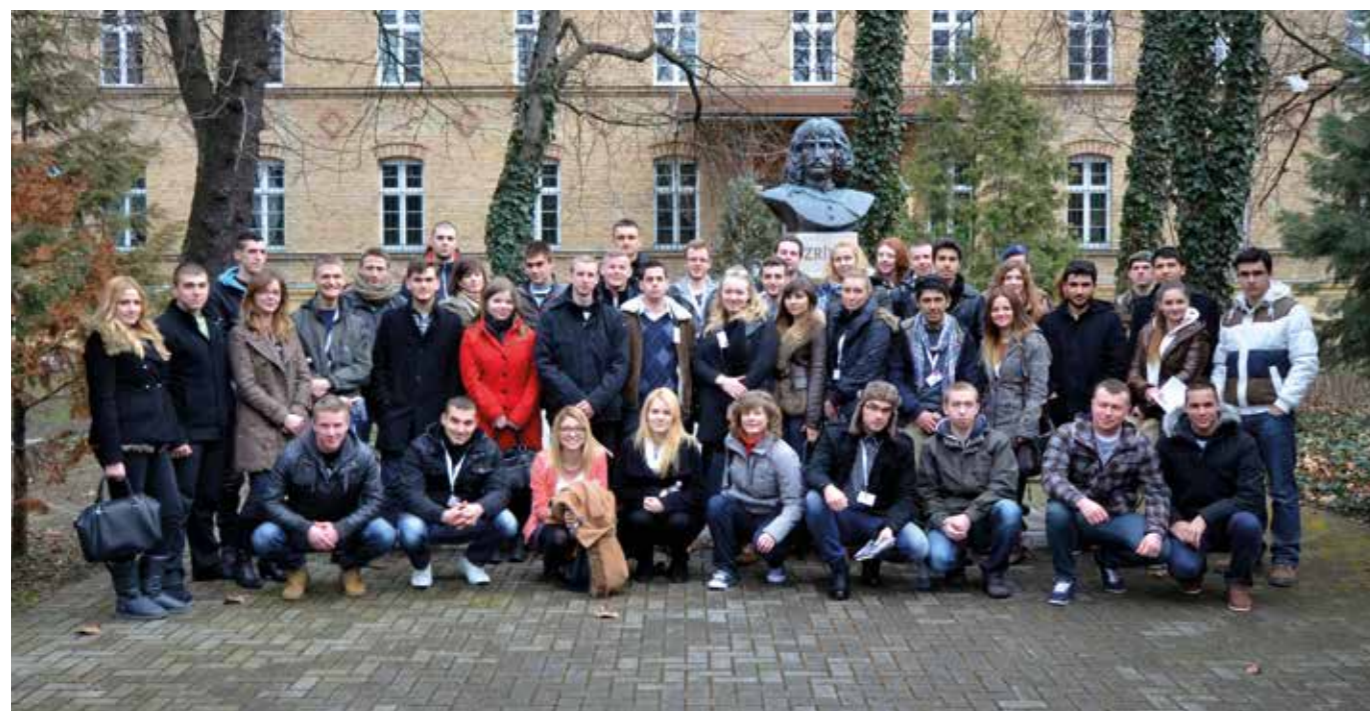
Új erasmusos diákok az egyetemen

Az ösztöndíj-összegek növekednek, megjelenik az európai diákhitel-konstrukció.