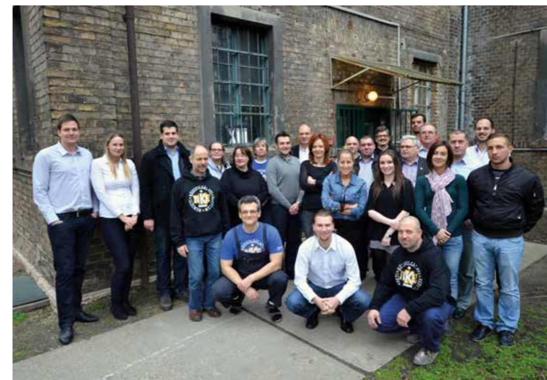
Kell egy csapat!