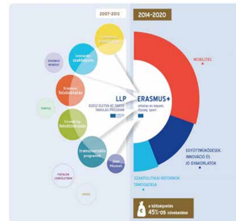
Így alakult át az Erasmus program szerkezete

Az egyéni mobilitás tekintetében a hallgatókat érintő legfőbb változás, hogy a mobilitás időtartama maximum tizenkét hónapra módosul, így egy hallgató egy ciklusban (azaz BA-, MA- vagy PhD-tanulmányai alatt) többször is pályázhat külföldi tanulmányra vagy szakmai gyakorlatra. A lényeg hogy összesen legfeljebb tizenkét hónapot tartózkodhat külföldön a program keretében. Nagyon fontos, hogy szem előtt tartjuk a résztanulmányi mobilitás esszenciáját, a kreditbeszámítást. Ezért az egyetem megkezdte a partnerportfólió áttekintését, a rendelkezésre álló kapcsolatokat minőségi alapon szelektálja, megújítja, vagy új partnereket keres meg.