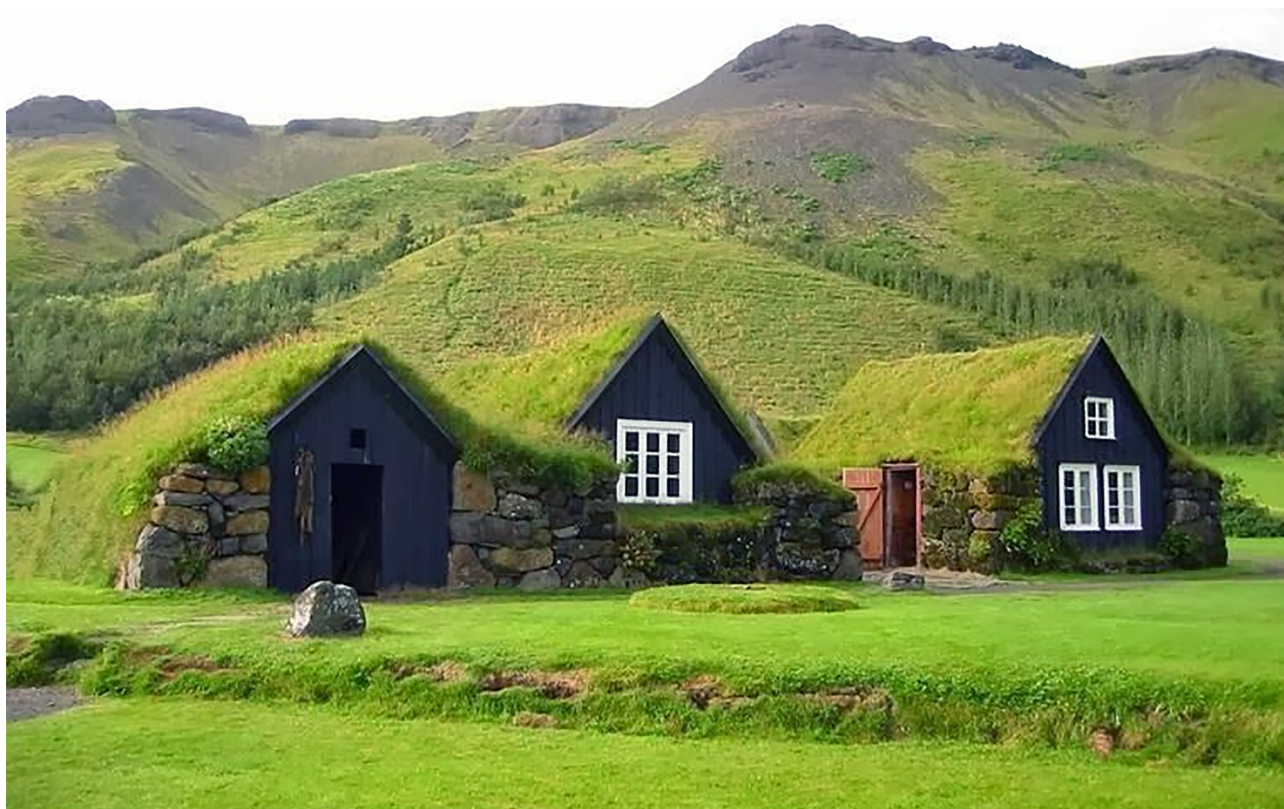
2. ábra: Izlandi zöldtetők

Több kutatás is folyt már a növényzet hűtő hatását vizsgálva, és arra a következtetésre jutott szinte minden ezzel foglalkozó vizsgálat, hogy a jövőben az „ingyen klímaként” működő növényborítás kedvező hatásait használva lehet közeledni a fenntartható települési működés felé, mert a fák hűtő hatása természetes ciklusra épül, amely nem igényel további energiabefektetést. 15 További érdekes kezdeményezés a tetőkertek és a zöld tetők elterjedése. Északi népeknél már régóta általánosan elterjedt, hogy a tetőn földréteg van, amelyben dús fűfélék tenyésznek. Ez a megoldás az északi éghajlaton főként a hideg ellen védett, de manapság már a nyári hőség ellen is elképzelhetőnek tartják az építészek a hasonló megoldásokat, hiszen a növényzet párologtató hatása hűt.