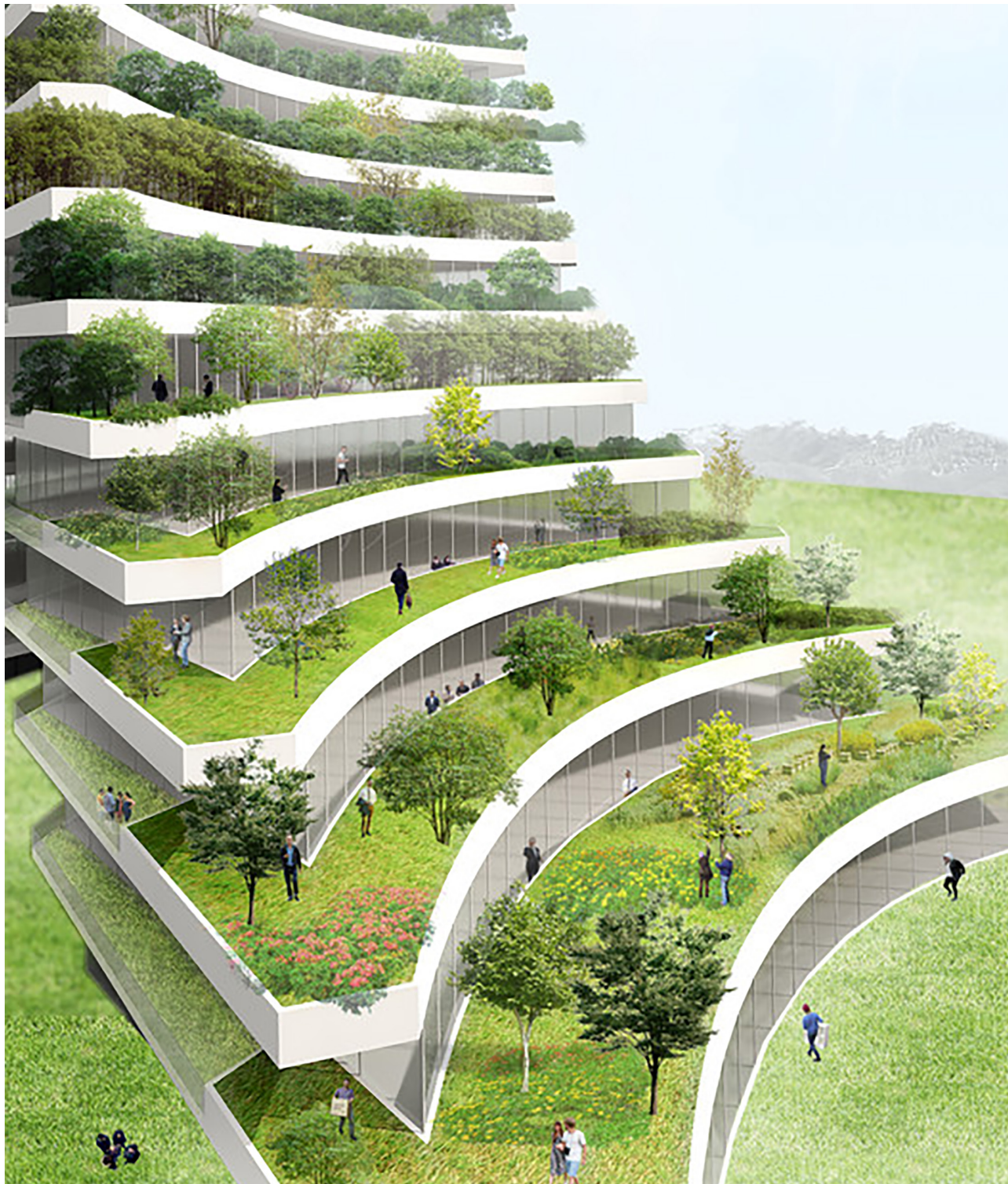
3. ábra. Futurisztikus városi látkép

Jelenleg létezik egy olyan építészeti és várostervezési irányzat is, ahol az épületek és a zöld növényzet egyfajta szimbiózist eredményezve magasabb szintre emeli a megszokott zöld felületek fogalmát, és a zöldfelület funkciója messze több a rekreációs feladatok ellátásánál: a város energiatermelésében is részt vesz (algák segítségével), az épületek hűtés-fűtésének passzív vagy aktív részese (az árnyéktól a víz körforgásában való részvételen át a szigetelésig stb.).