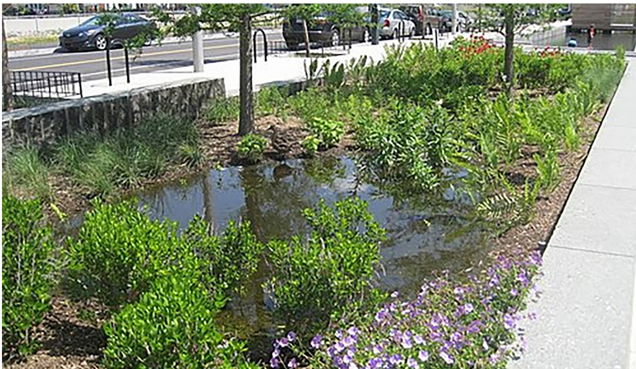
4. ábra. Esőkert

Előfordulhatnak olyan esetek is, amikor a településnek kevesebb ráhatása van a környező felszínborításra, vagy a felszínborítás megfelelő volta ellenére kialakulnak villámárvizek. Az infrastruktúra ezeket nem képes minden esetben kezelni, így célszerű például esőkerteket és bioárokot létesíteni, amelyek a villámárvizek kezelésében segítenek. Az esőkertek gyakorlatilag olyan, a város egy sík részén kialakított mélyedések, amelyekben nincs mesterséges felszínborítás (beton, aszfalt, térkő stb.), hanem talaj és gyorsan növvő növényzet jellemzi őket. A talaj sokszor nagyobb mélységig mesterségesen porózus anyagból áll, hogy a hirtelen érkező nagy mennyiségű esővizet gyorsan el tudja nyelni és a növényzet számára tárolja. Az esőkert nemcsak megköti a csapadékvizet, hanem tisztítja is azt. Városi környezetben az utcán folyó esővíz legtöbbször szennyeződik, ennek megtisztításában az esőkert talaja és növényzete jelentős segítséget nyújt. Amennyiben az ilyen létesítményeket bioárok kötik össze, illetve a városban bioárok is jelen vannak, azok tovább segíthetik a villámárvizek felfogását, hatásának mérséklését. A bioárok olyan lejtős vízelvezető, ahol az árok oldala nem beton vagy más mesterséges elem, hanem növényzet, fűvek, cserjék, fák. Ezek vízmegkötő, lefolyáslassító hatása is tompítja egy gyors lefutású esőzés hatását.