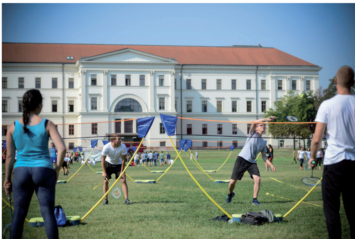
Egyetemi Sportnap 2018. szeptember 20.