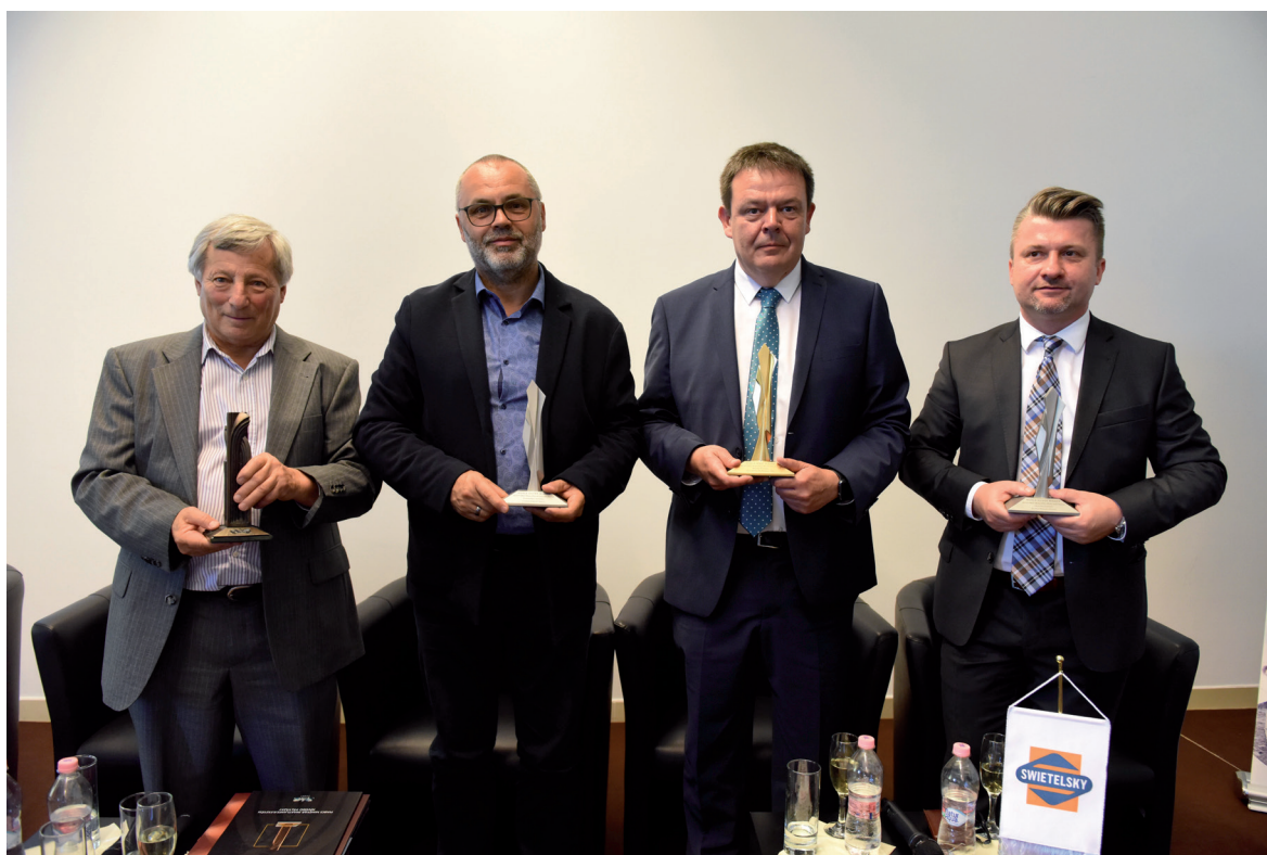
Nemzetközi Ingatlanfejlesztési Nívódíjat kapott a Ludovika Campus 2019. június 4.