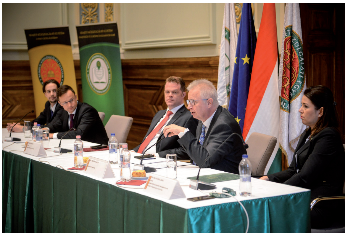
NETK Kari Nap 2019. május 9.