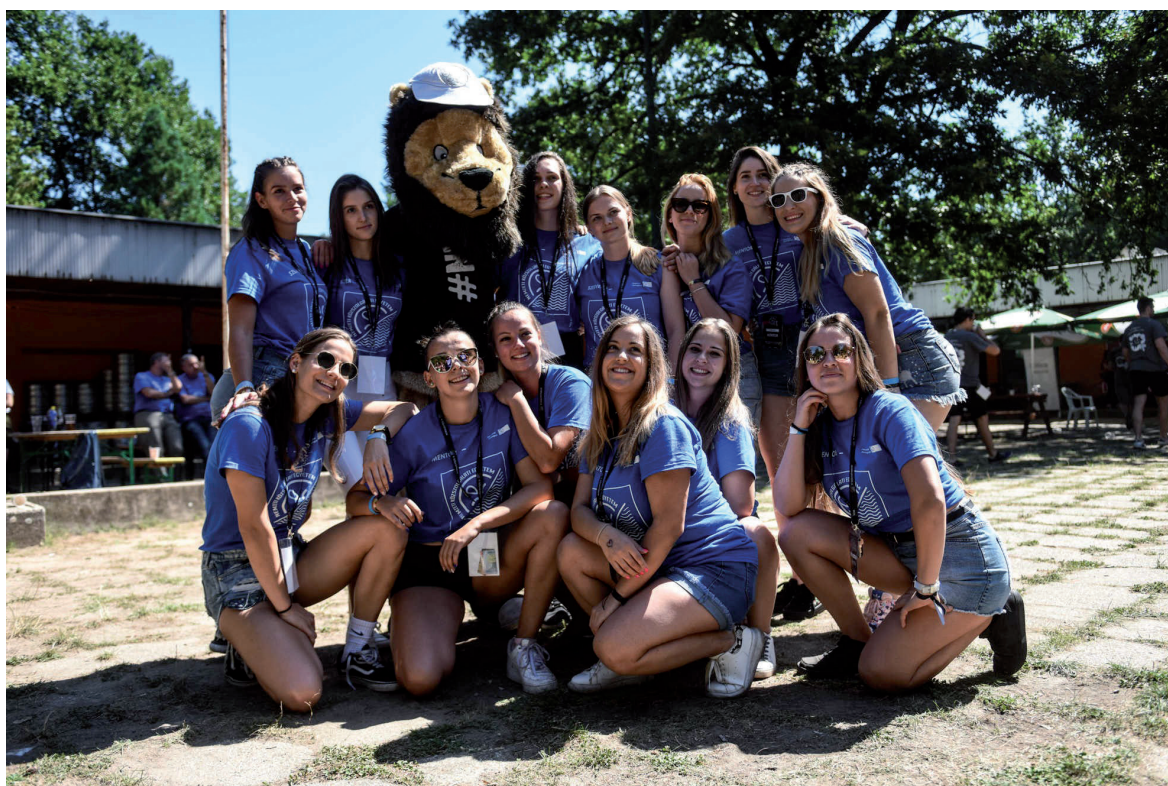
Gólyatábor 2019. augusztus 7–10.