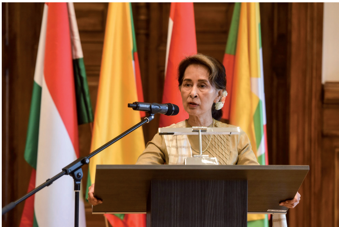
Aun Szan Szu Kji államtanácsos előadása 2019. június 6.