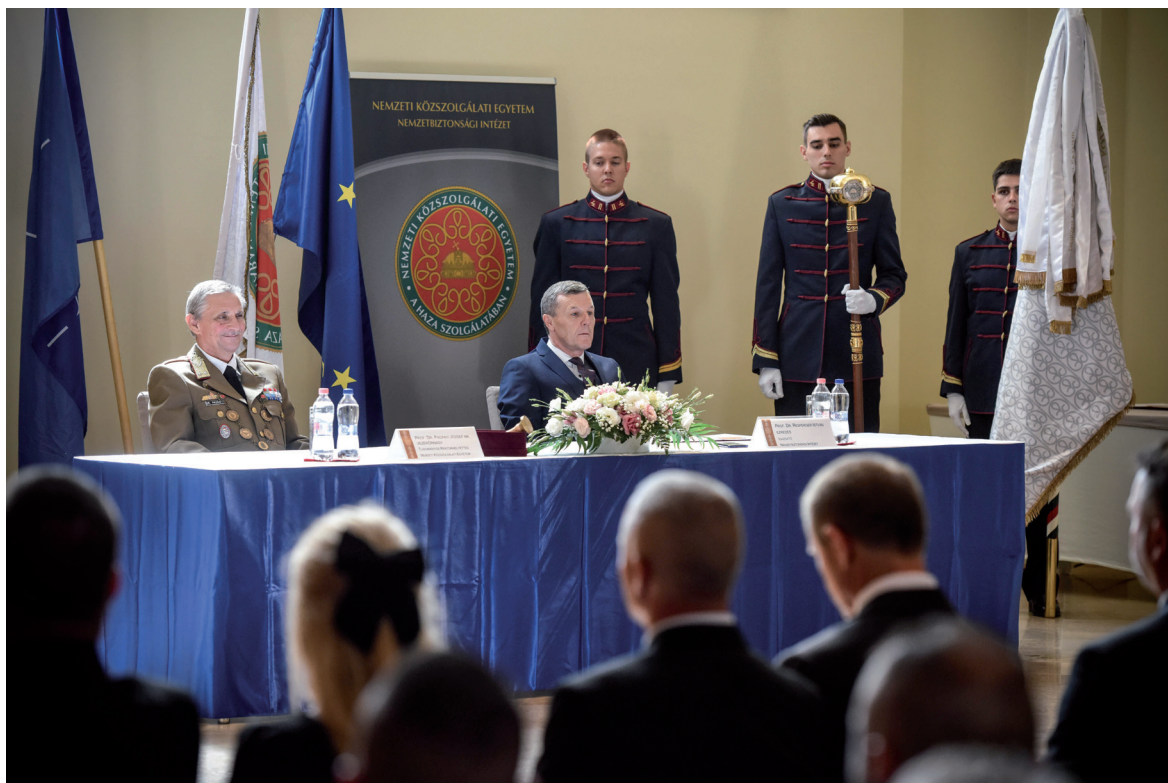
NBI oklevélátadó ünnepség 2019. július 4.