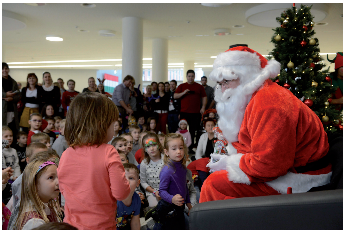
Mikulás-ünnepség 2018. december 9.