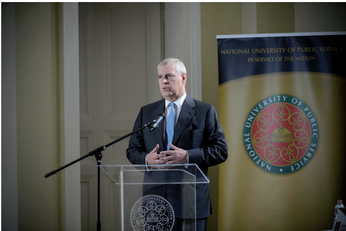
András yorki herceg látogatása az NKE-n 2018. szeptember 11.