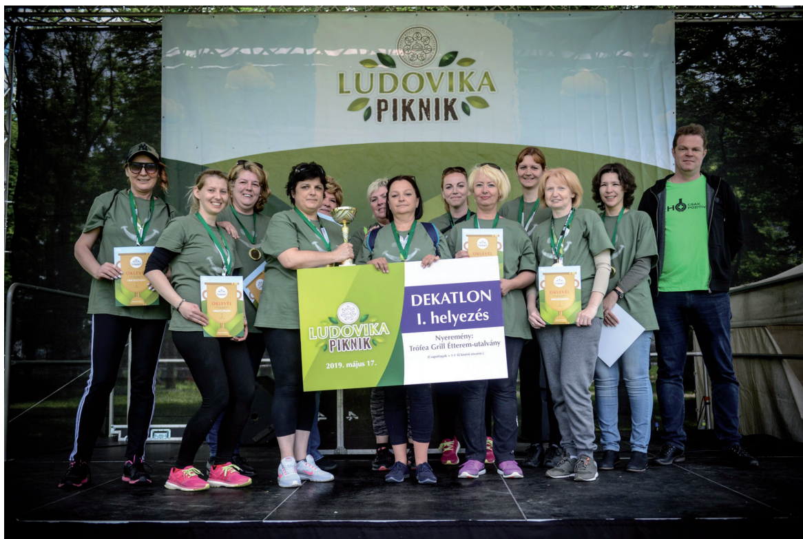
Ludovika Piknik 2019. május 17.