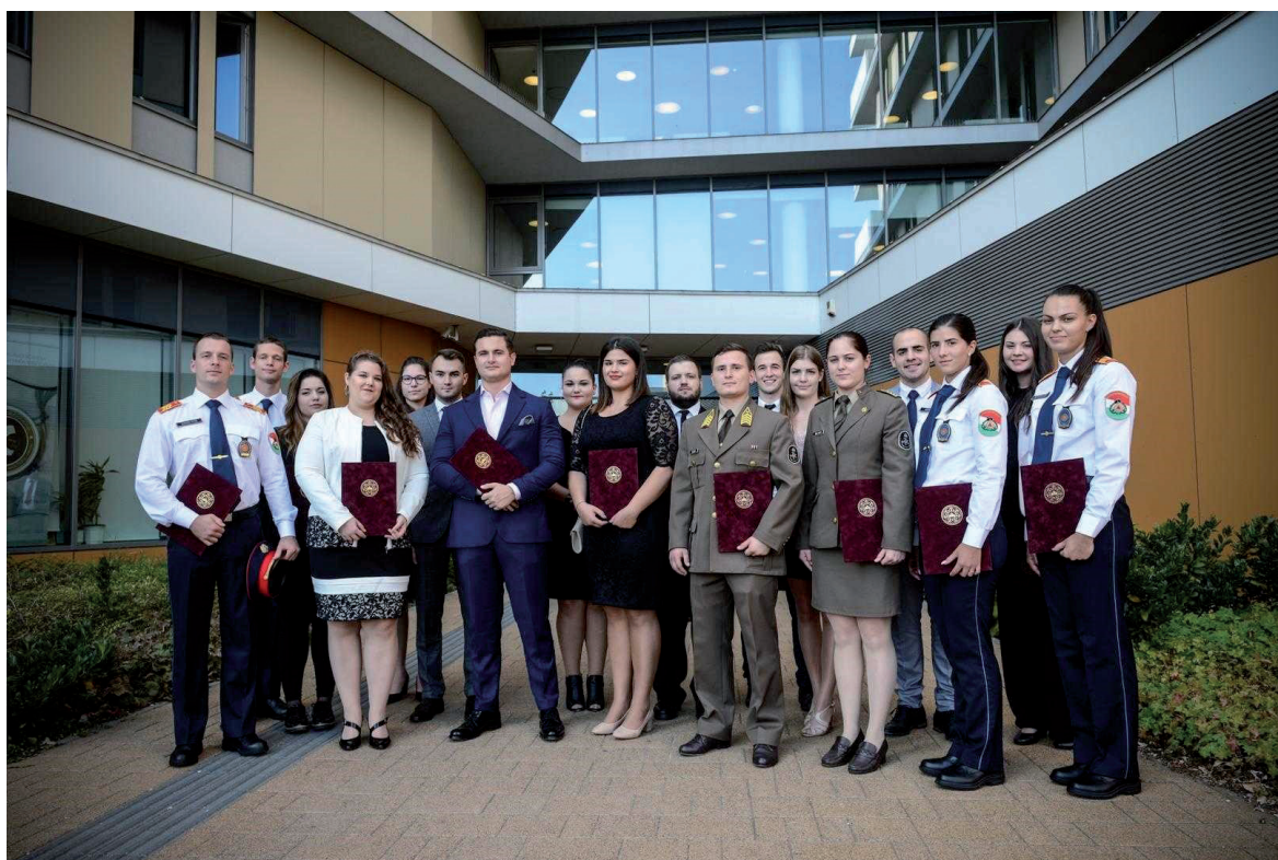
Nemzeti Felsőoktatási Ösztöndíj átadóünnepség 2018. október 10.