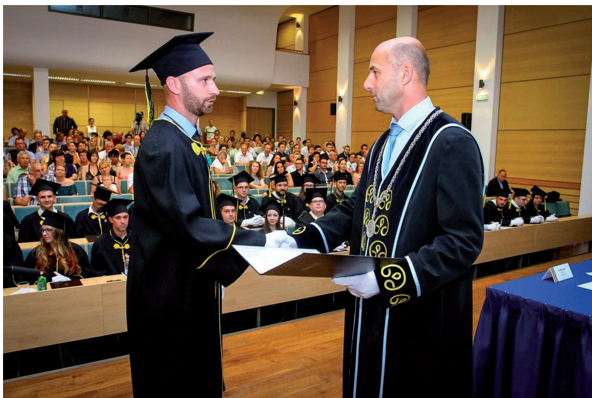
VTK oklevéltadó ünnepség 2019. június 27.