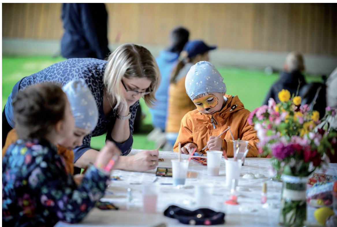
Húsvét a Campuson 2019. április 14.