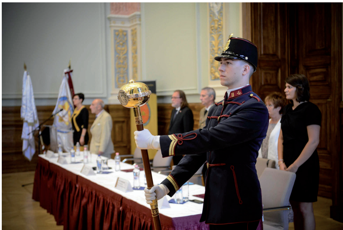
Doktori tanévnyitó ünnepség 2018. szeptember 18.