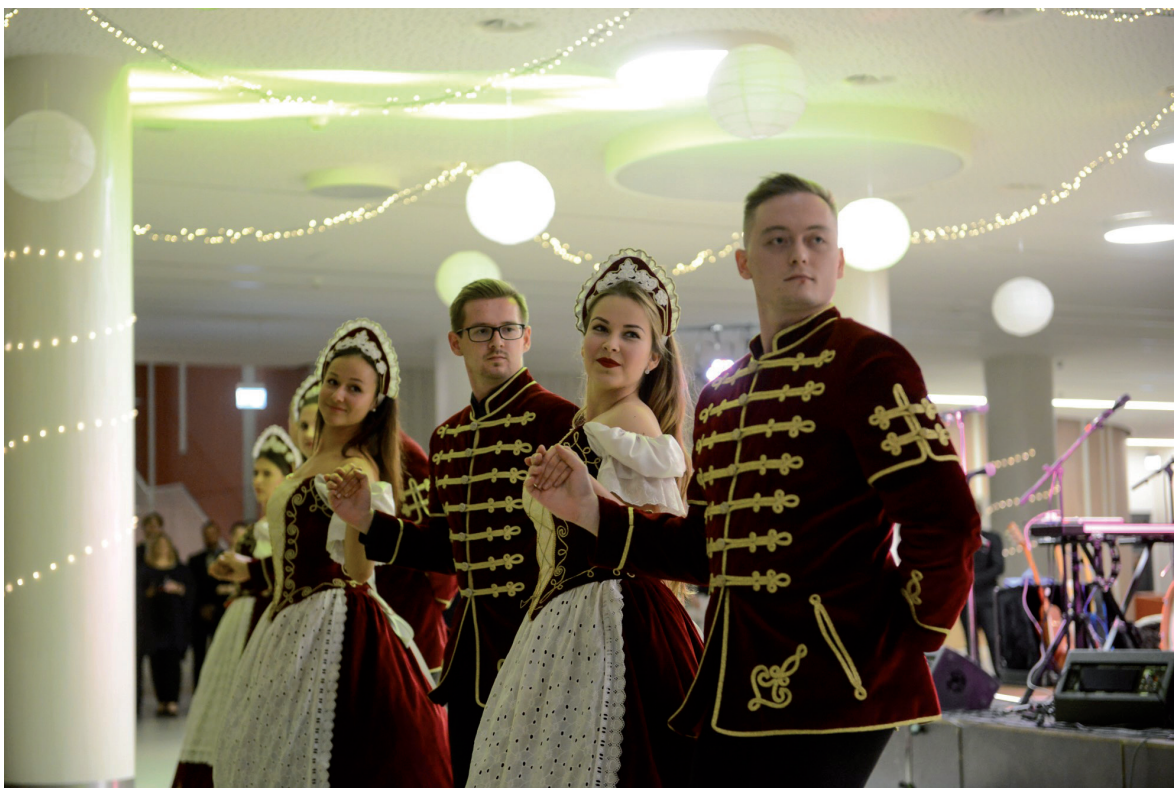
Gyűrűavató bál 2019. május 15.