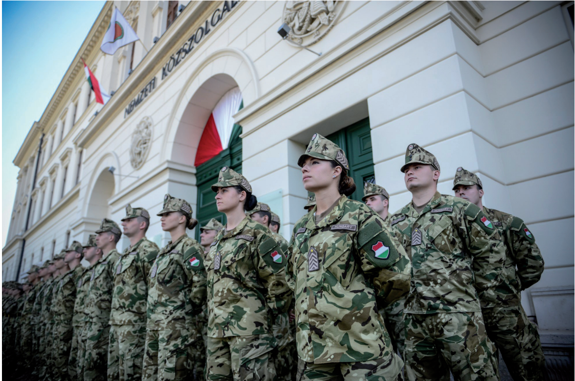
Száznapos Ünnepség, Ludovika Fesztivál 2019. május 11.