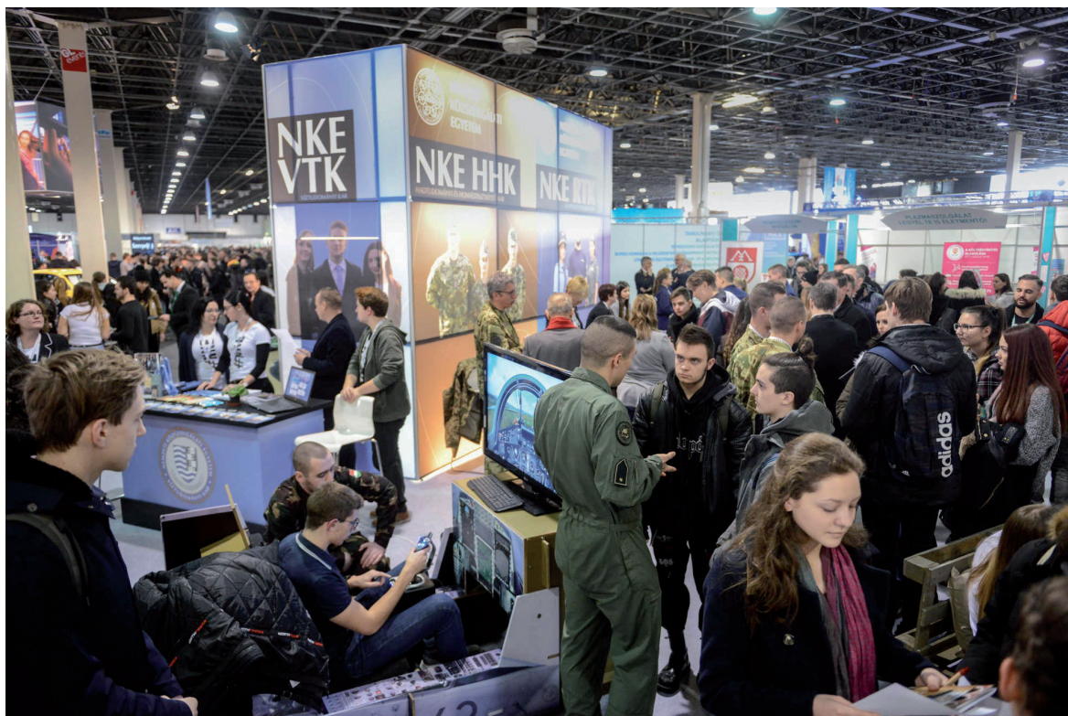
Educatio 2019 2019. január 10–12.