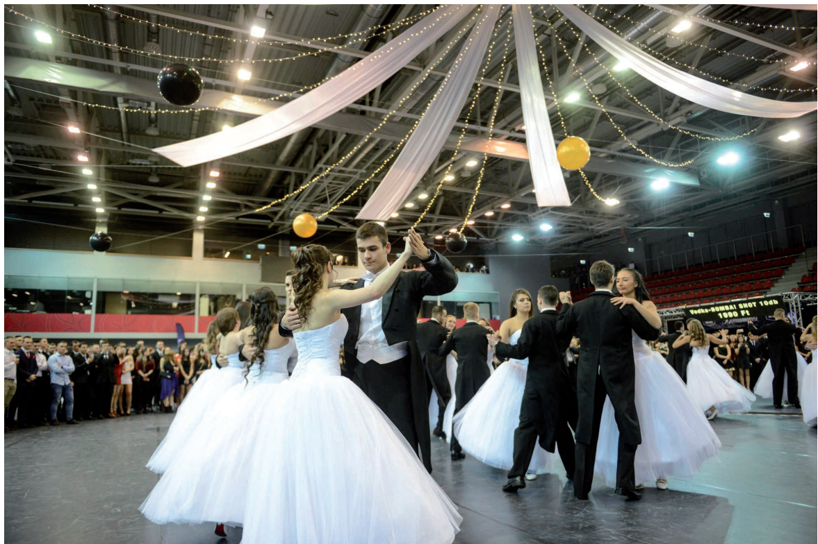
Egyetemi gólyabál 2018. november 29.