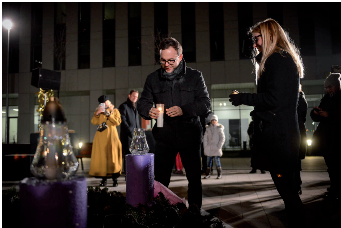
Advent a Campuson 2018. december 2–20.