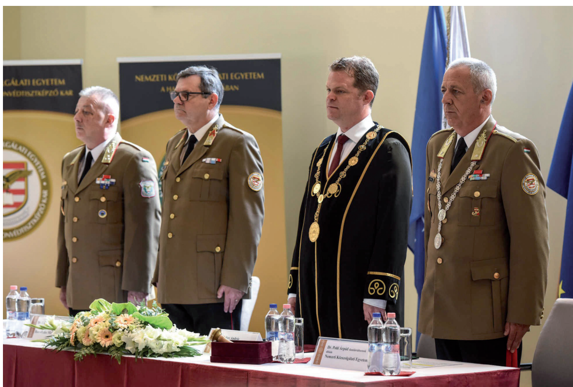
HHK oklevélátadó ünnepség 2019. július 5.