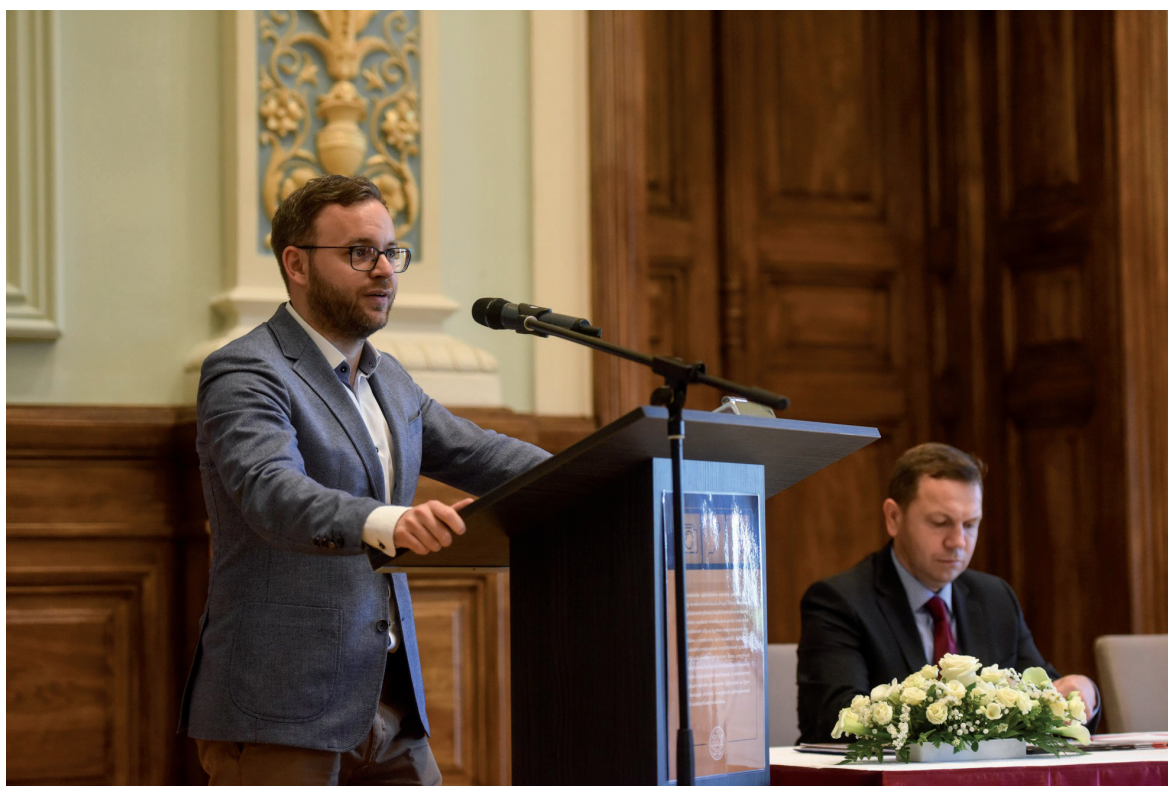
Magyary Napok 2019 2019. június 12–14.