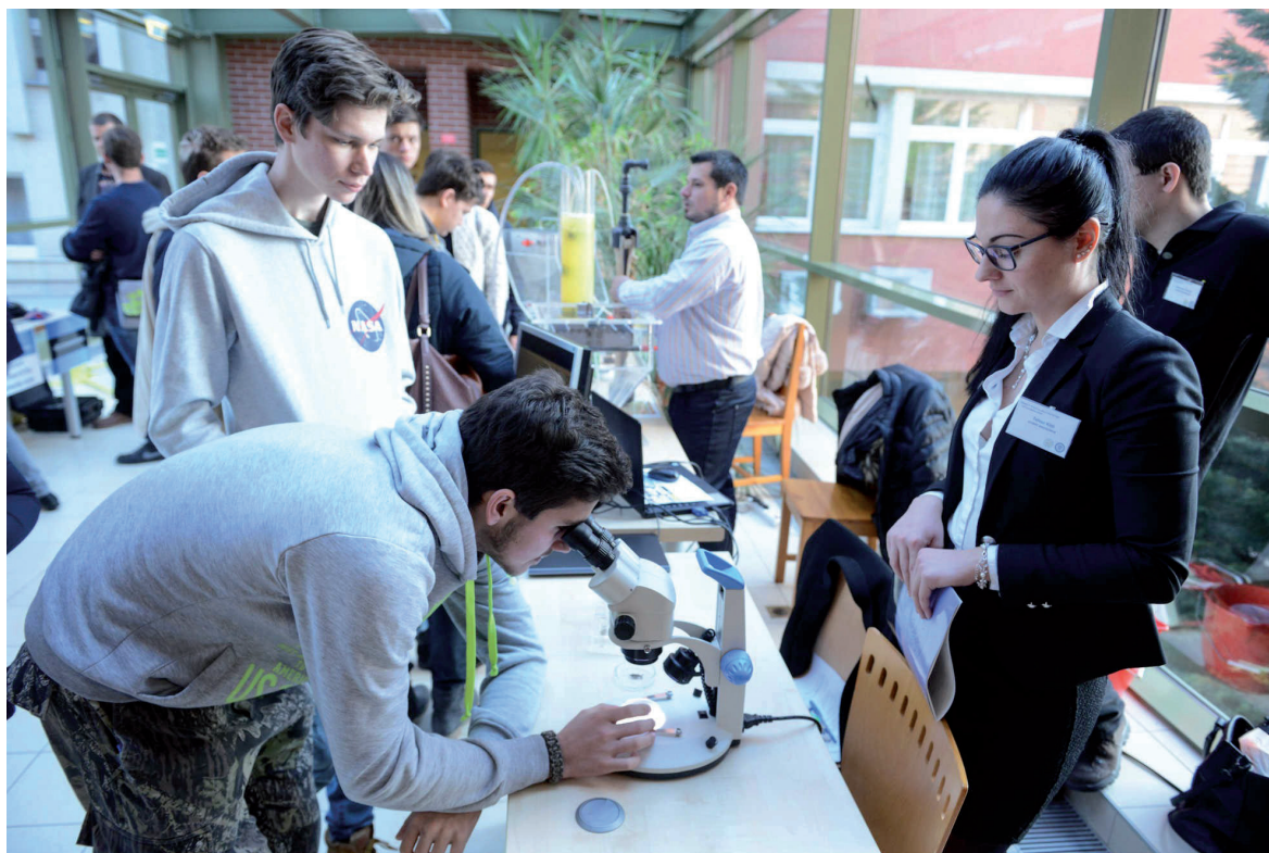
Nyílt nap a VTK-n 2019. január 17.