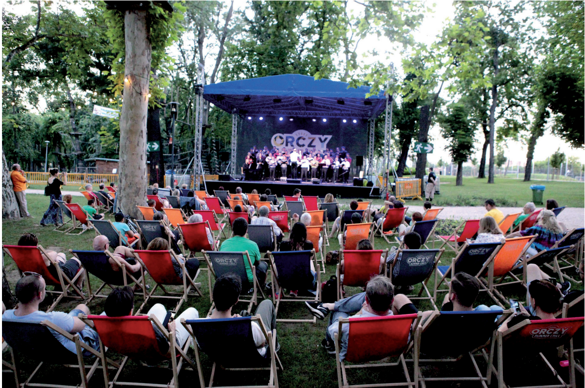
Orczy Summer Chill 2019. június–augusztus