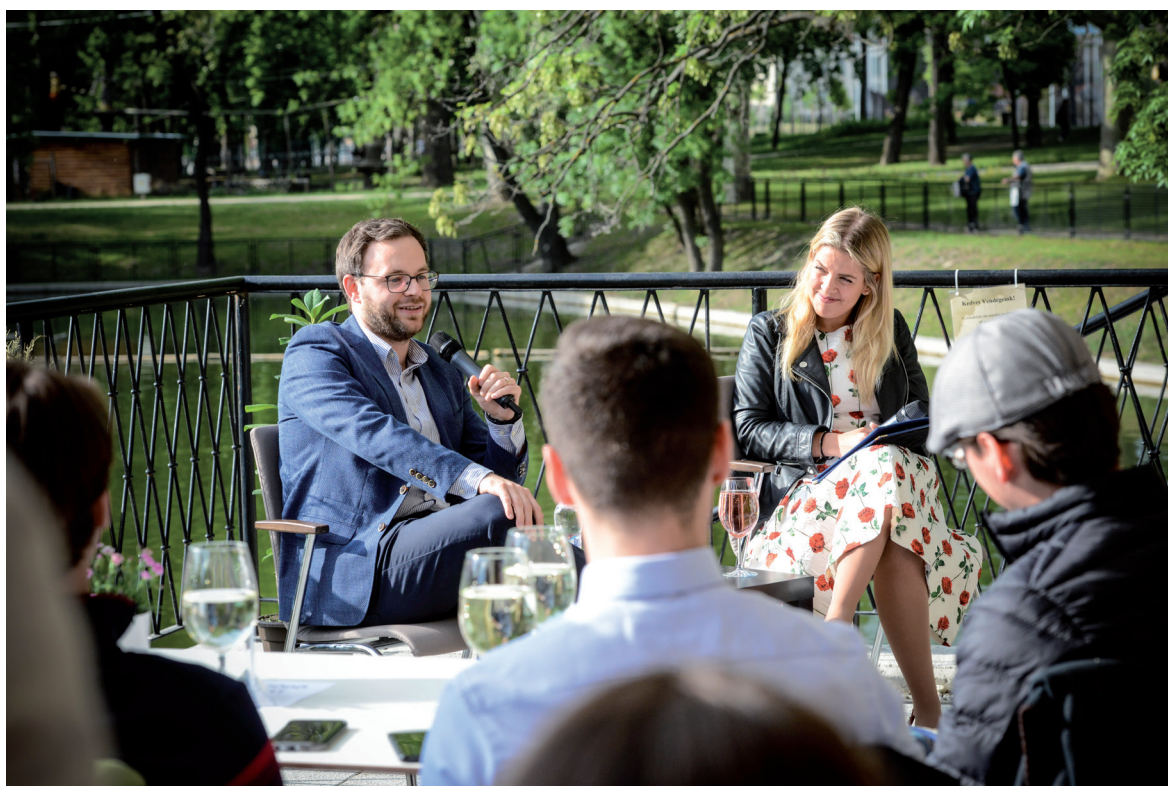
Fiatalok a közigazgatásban: dr. Orbán Balázs 2019. április 24.