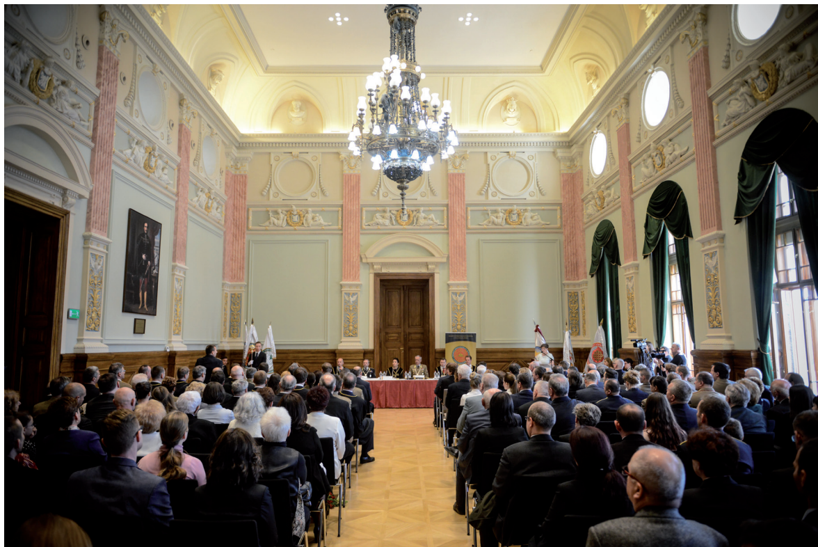
Egyetem Napja és a Szenátus ünnepi ülése 2019. március 28.