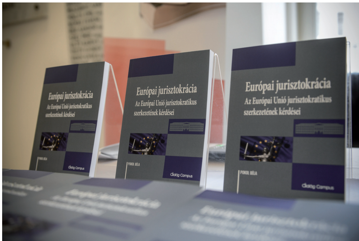
Konferencia az uniós jurisztokráciáról 2019. április 5.