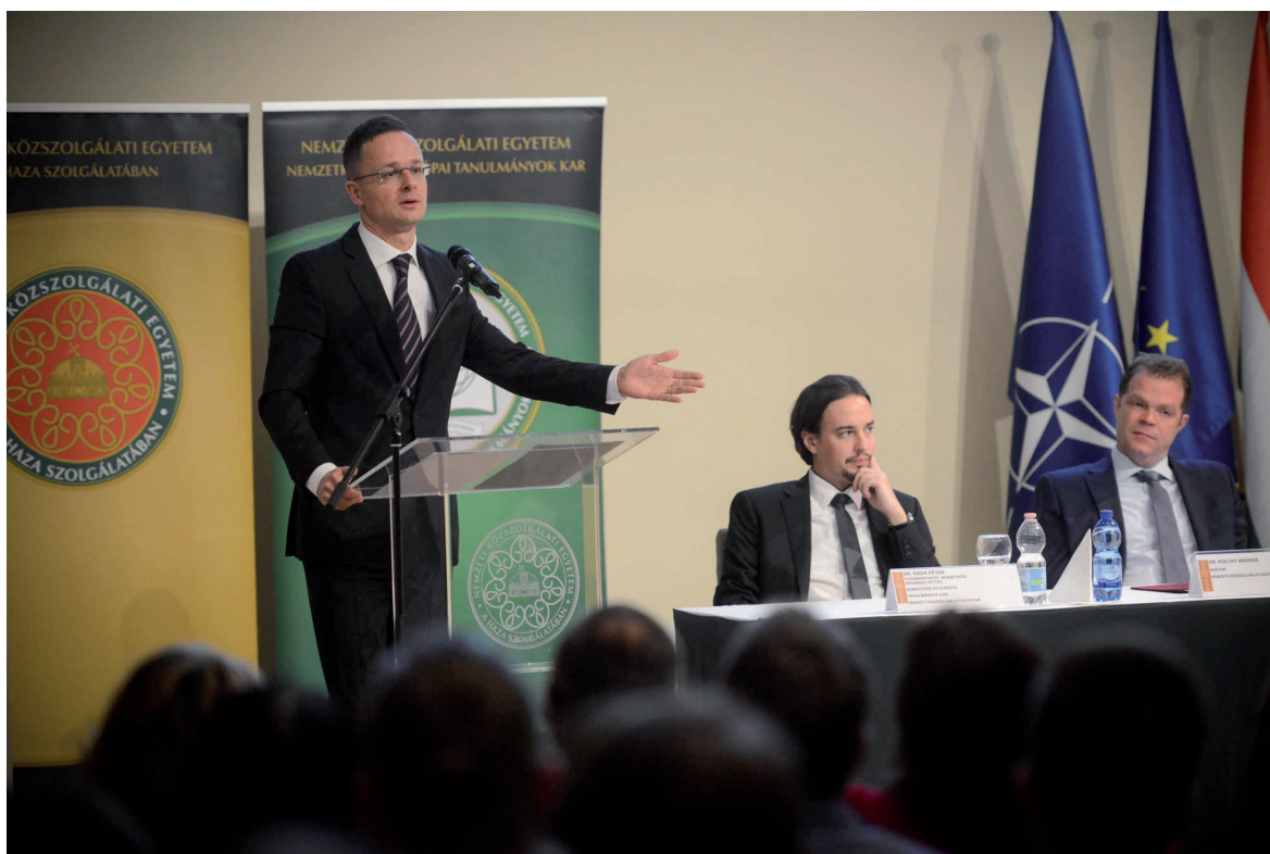
Magyar Diplomácia Napja 2018. november 21.