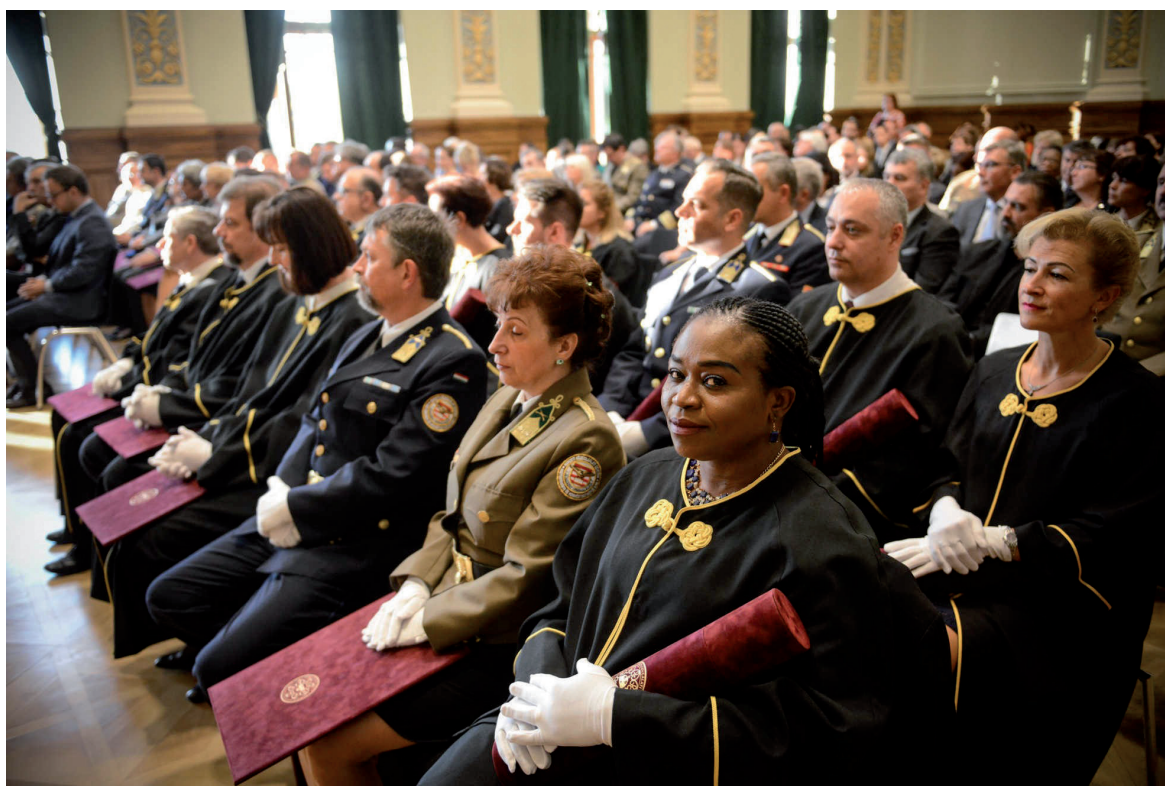
A Szenátus ünnepi ülése 2018. november 6.