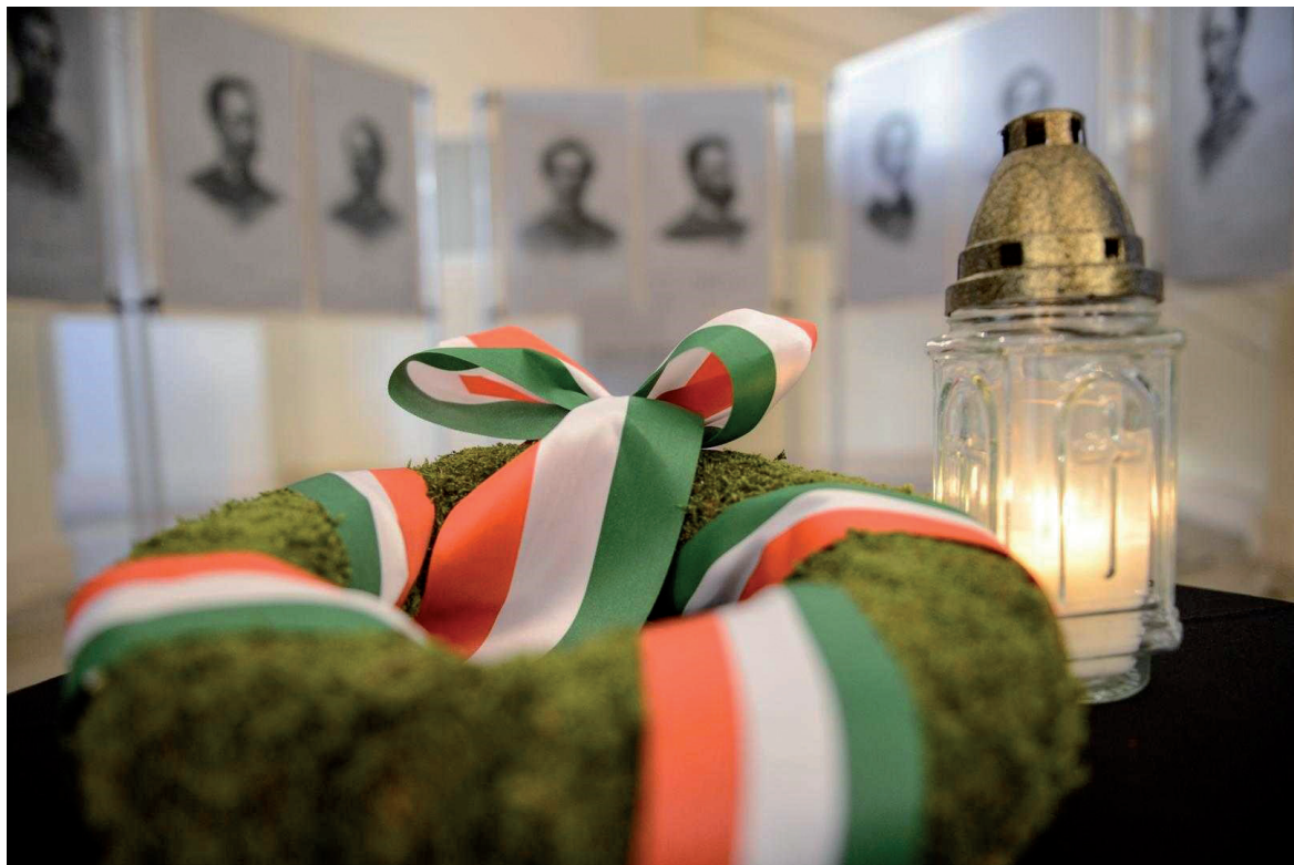
Megemlékezés az aradi vértanúkról 2018. október 6.