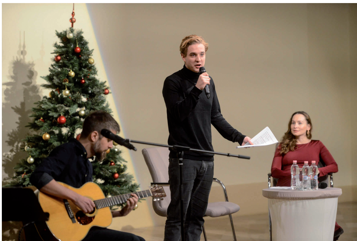
Központi karácsonyi ünnepség 2018. december 20.