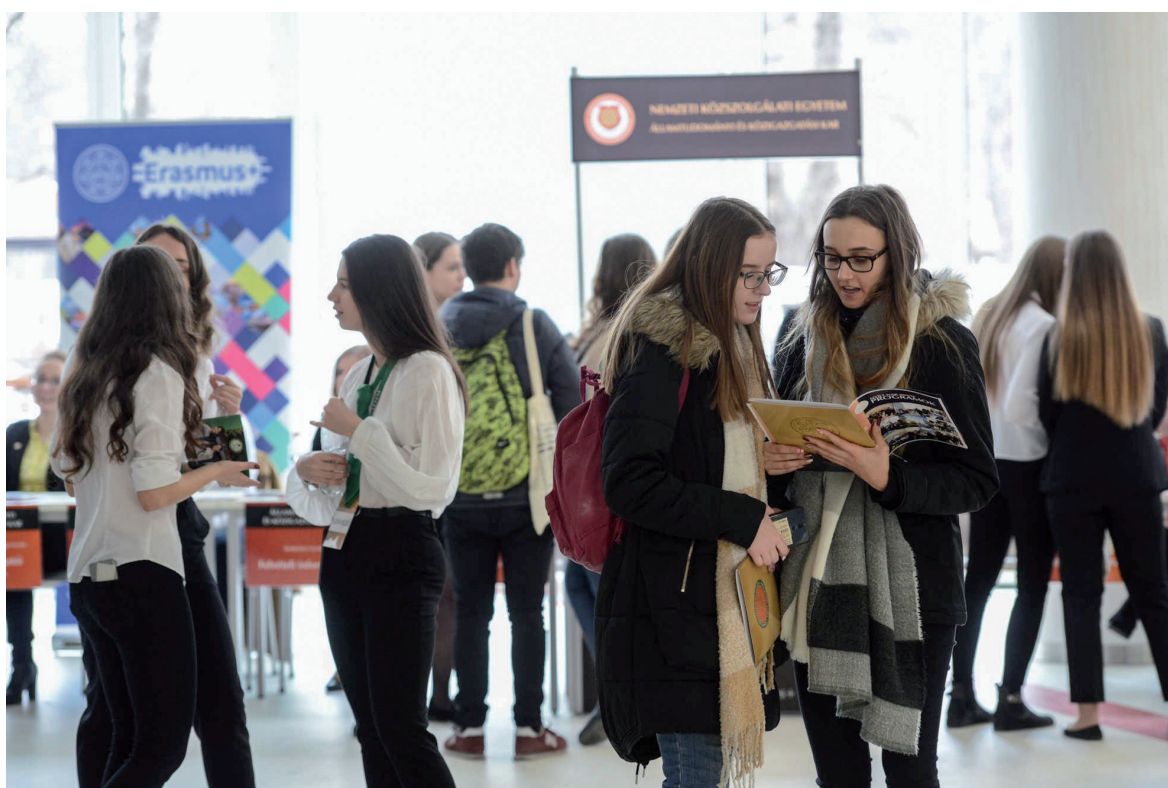
NKE nyílt nap 2019. január 26.