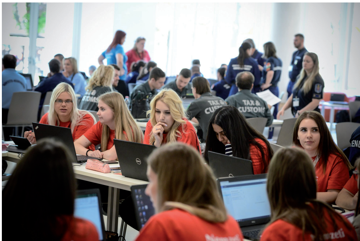
Közös Közzolgálati Gyakorlat – Vírus 2019 2019. április 15.