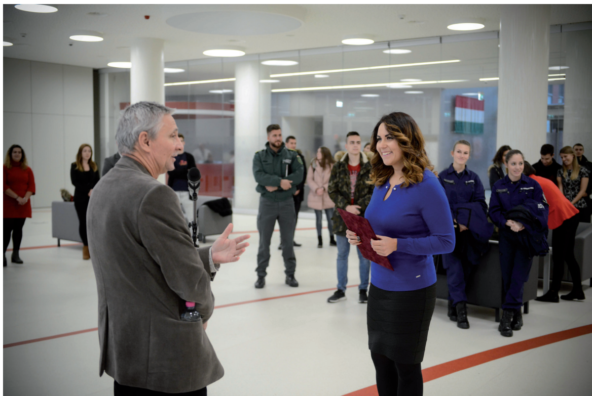
NKE a világ körül című fotópályázat eredményhirdetése 2018. november 19.