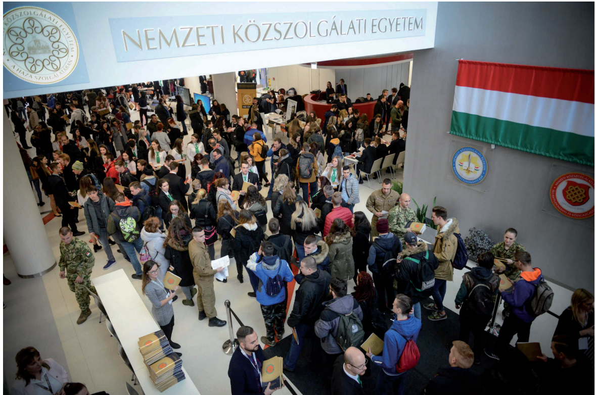
Első központi nyílt nap 2018. november 23.