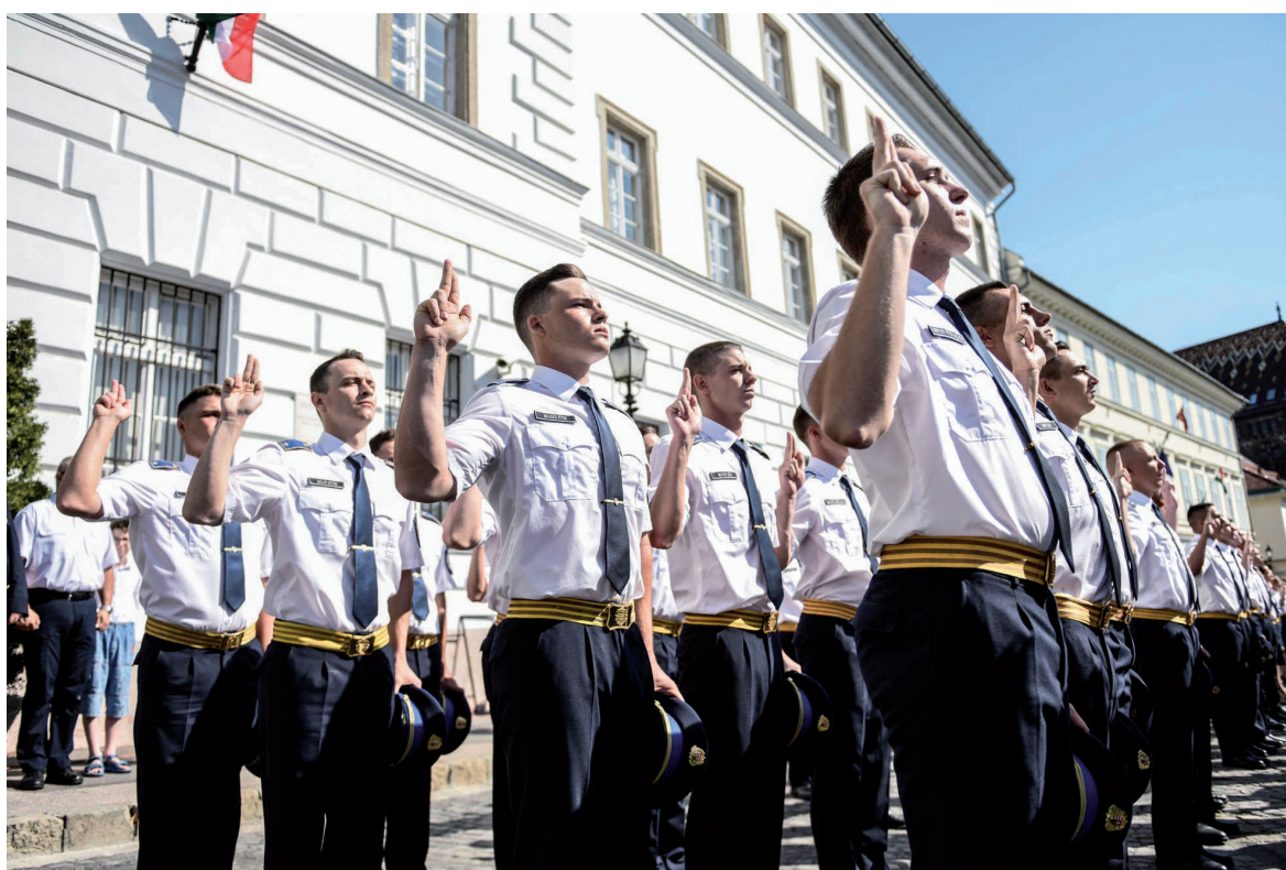
RTK-tisztavatás 2019. június 29.