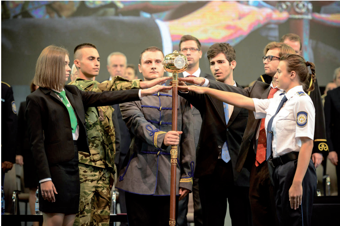
Egyetemi tanévnyitó ünnepség 2018. szeptember 7.