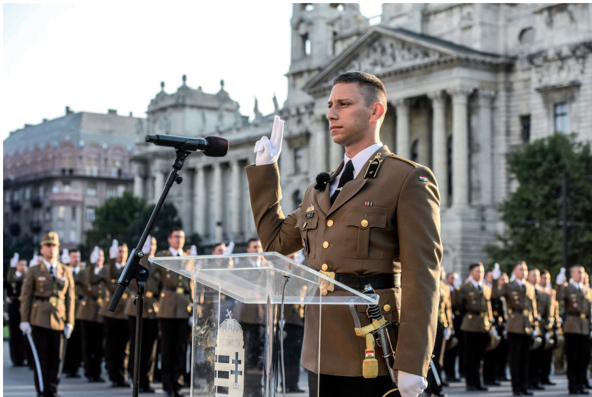
Honvédtisztavatás 2019. augusztus 20.