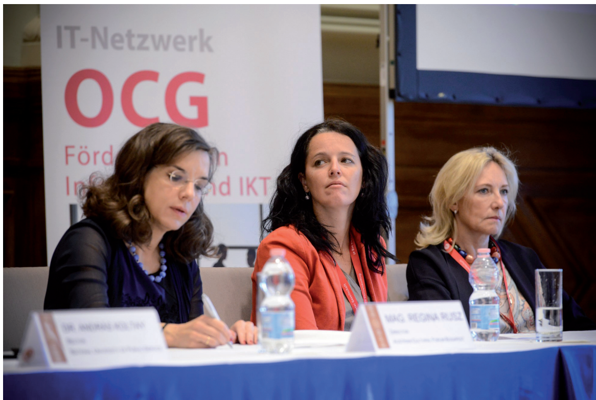
CeeGov 2019. 2019. május 2–3.