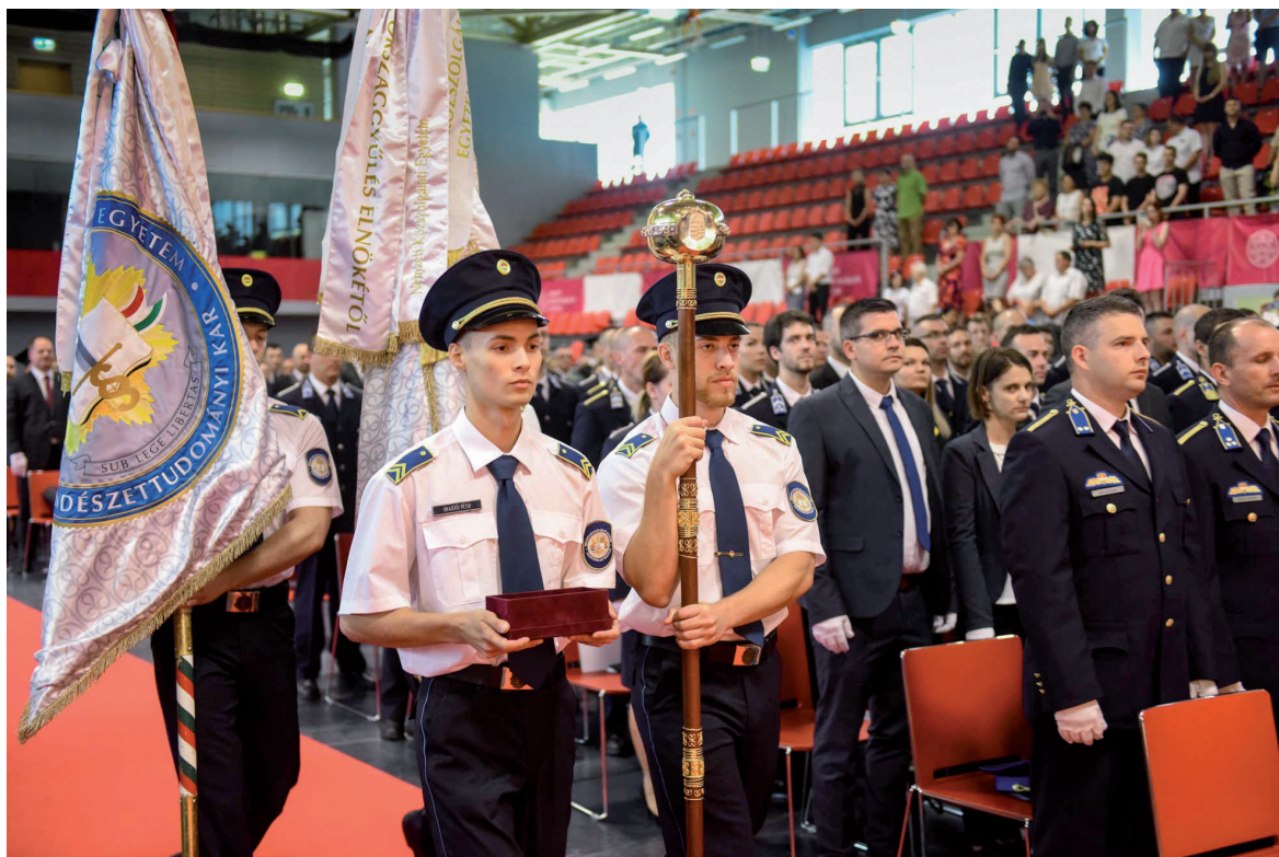
RTK oklevélátadó ünnepség 2019. június 28.