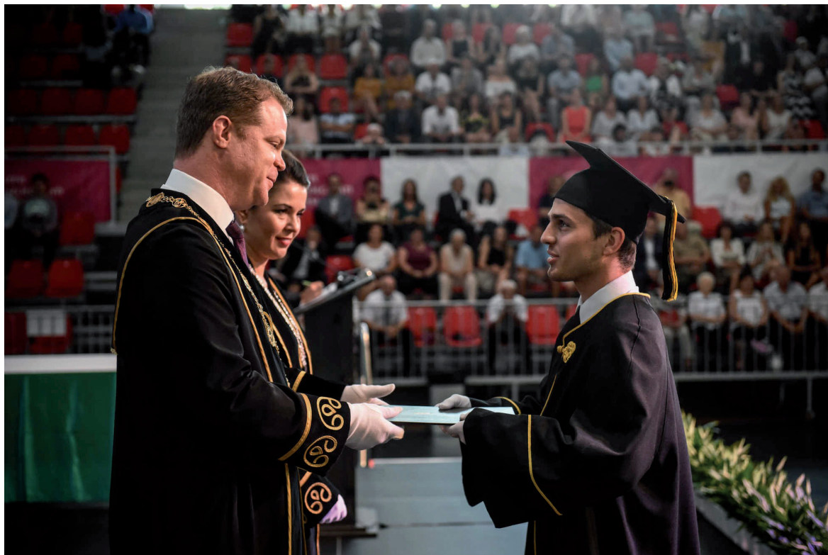
NETK oklevélátadó ünnepség 2019. július 6.