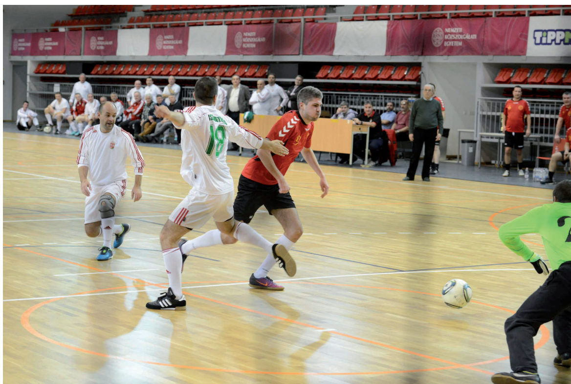
I. Ludovika Újévi Kupa 2019. január 14.