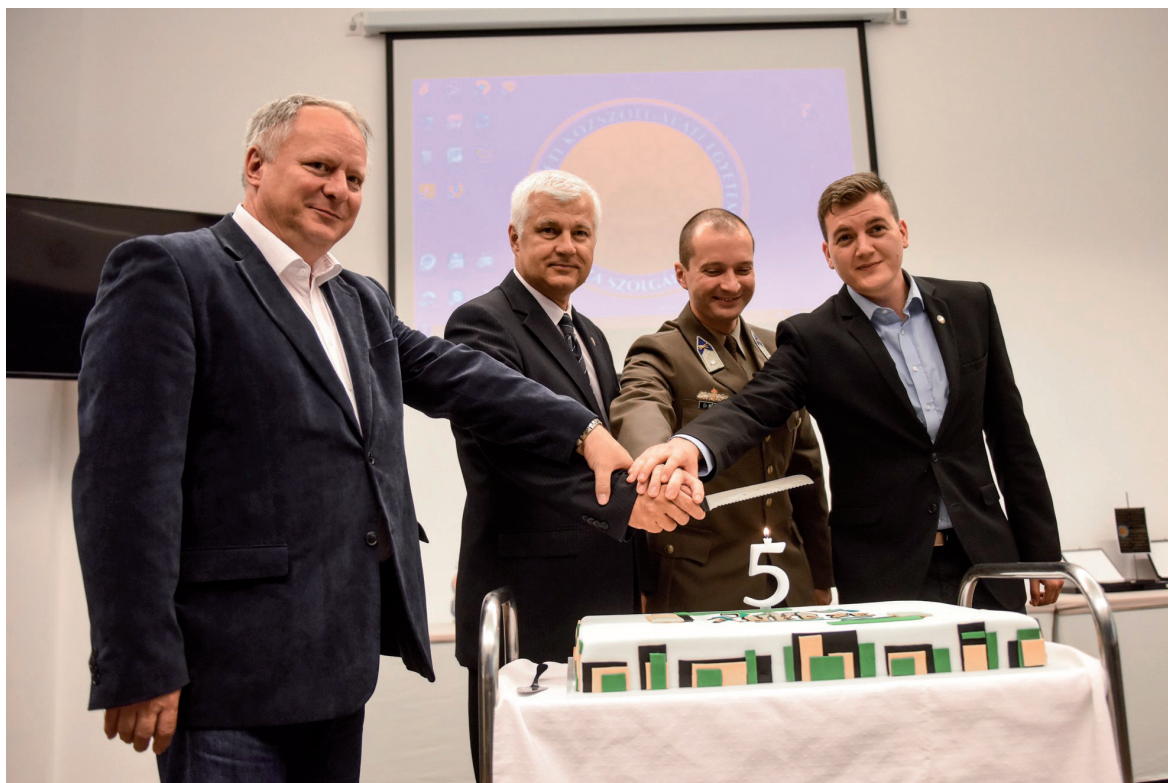
5 éves az NKE SE 2019. május 28.