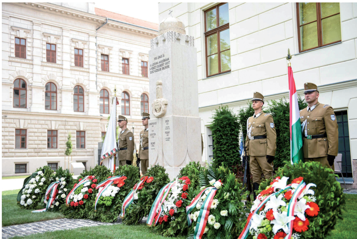
Emlékoszlop-avatás 2019. június 24.