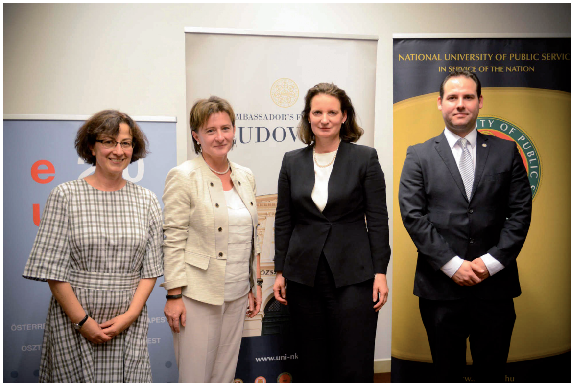
A Ludovika Nagykövetségi Fórum rendezvénysorozat első fórumbeszélgetése 2018. szeptember 12.