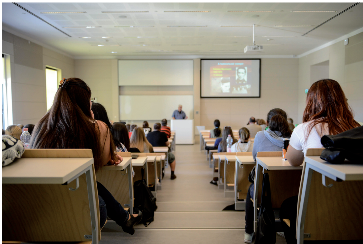
Kutatók Éjszakája 2018. szeptember 28.