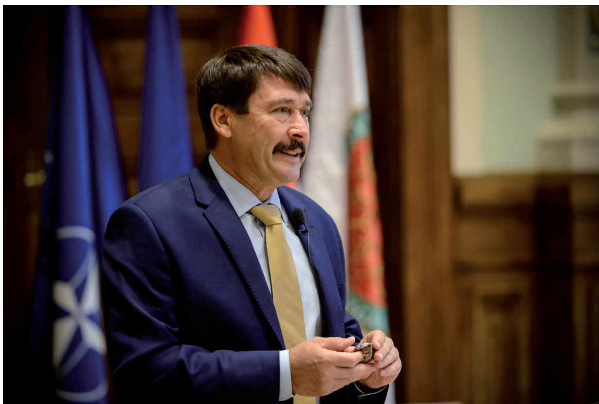
Biztonsági kihívások a 21. században 2018. október 3.