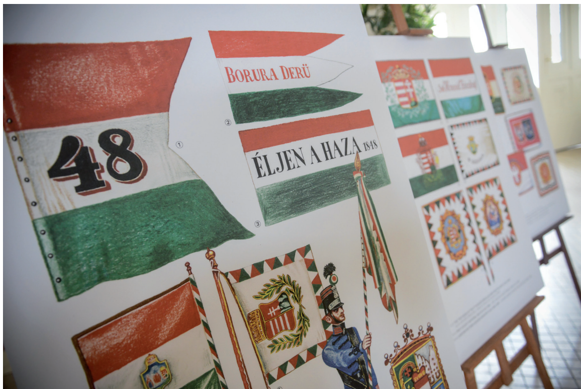
Március 15-i ünnepi megemlékezés 2019. március 14.