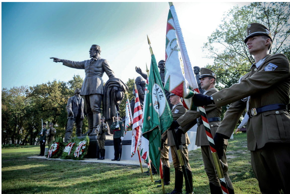
Kossuth-szobor-avatás 2018. szeptember 19.