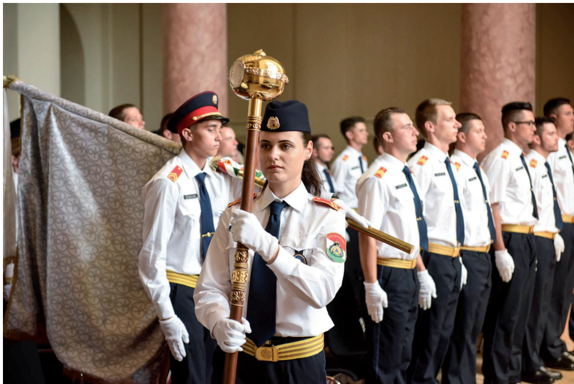
KVI oklevéltadó ünnepség 2019. június 27.