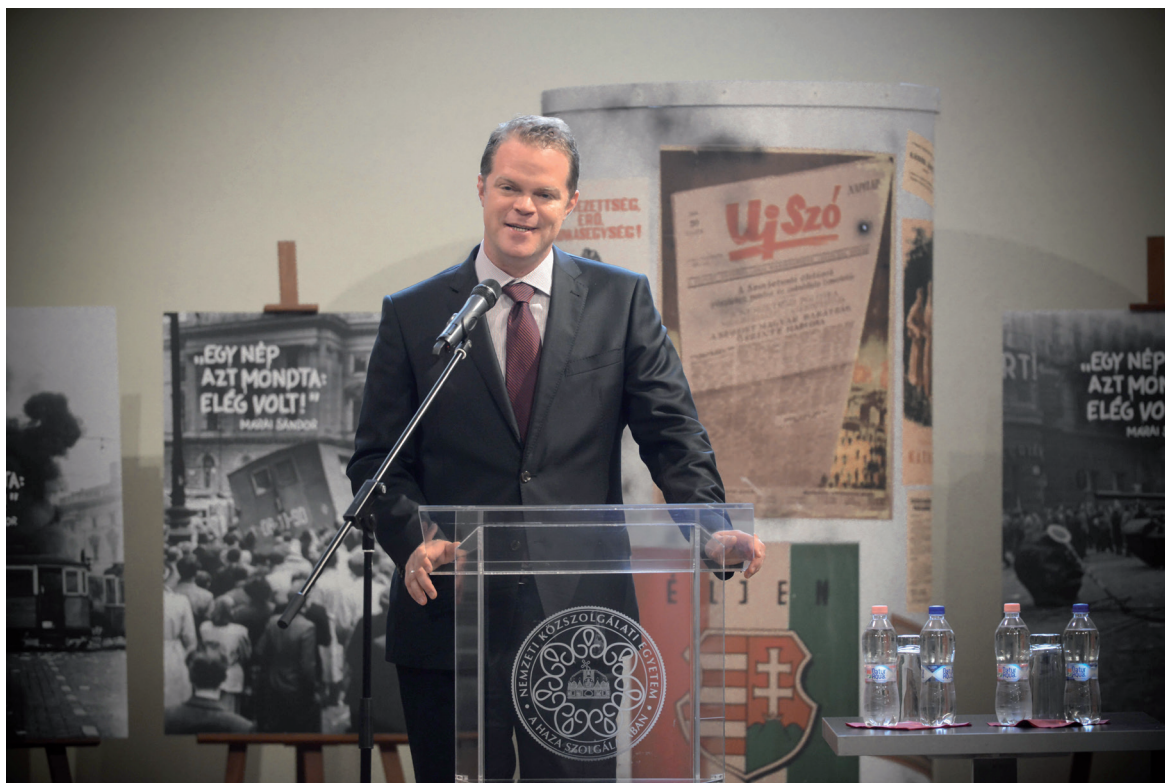
Ünnepi megemlékezés az 1956-os forradalom és szabadságharcról 2018. október 19.