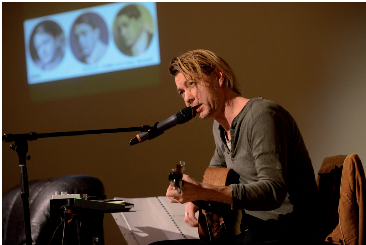
Valentin-nap Adyval 2019. február 14.