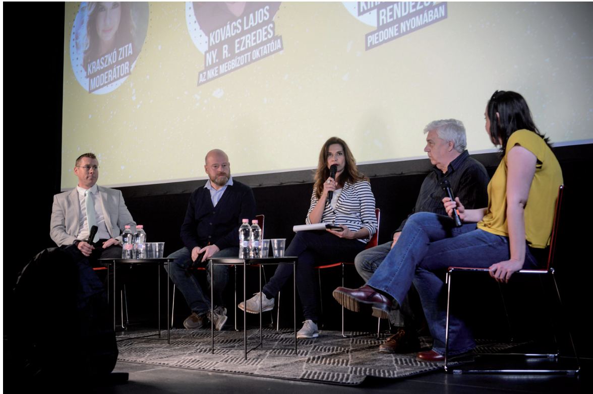
Ludovika Campus Filmfesztivál 2019. március 25–28.