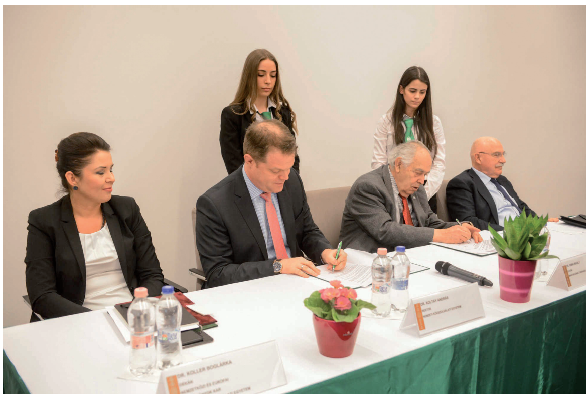
Konferencia és együttműködési megállapodás aláírása a Magyar ENSZ Társasággal 2019. február 13.