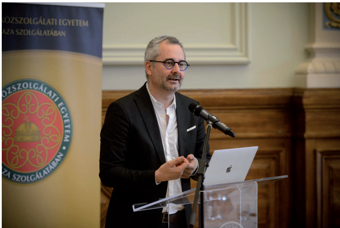
Hálózat kutatási konferencia 2018. december 19.