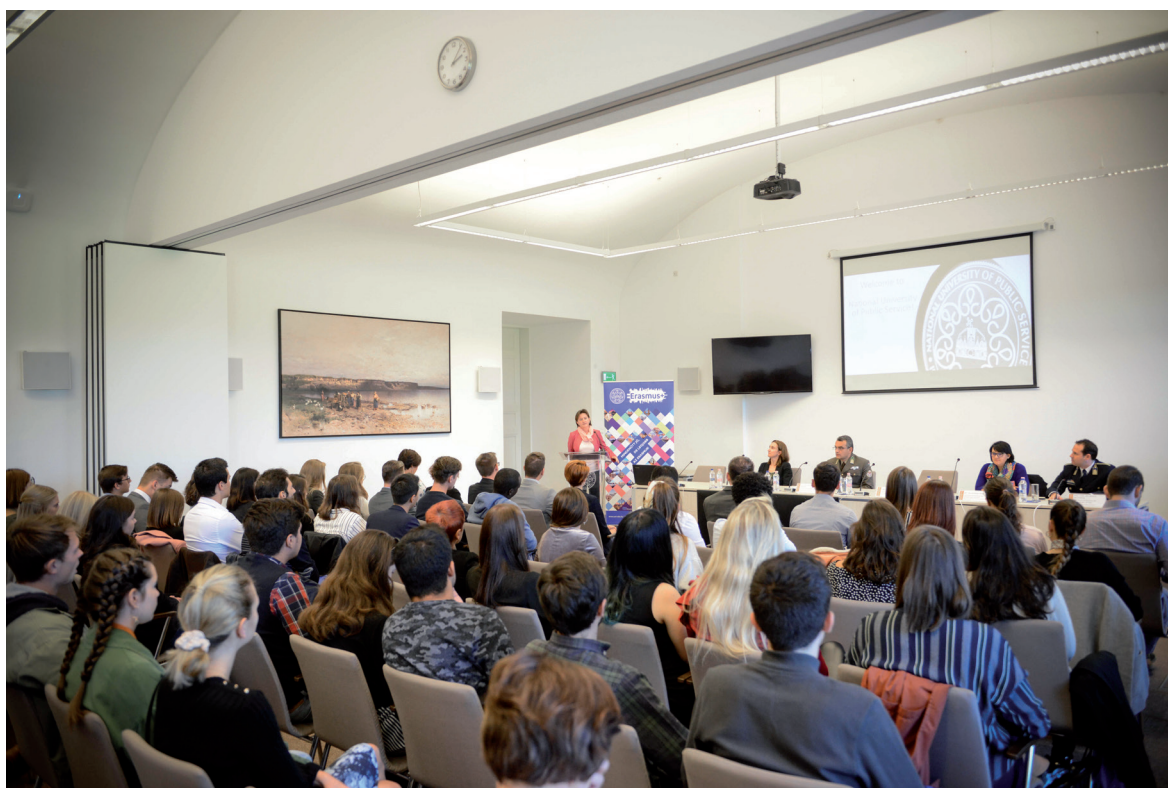
International Welcome Day 2018. szeptember 26.