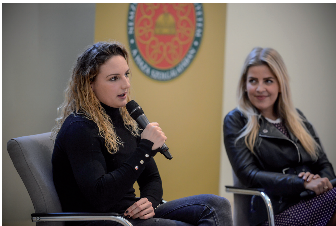
Siker és Kudarc programsorozat: Hosszú Katinka 2019. március 20.