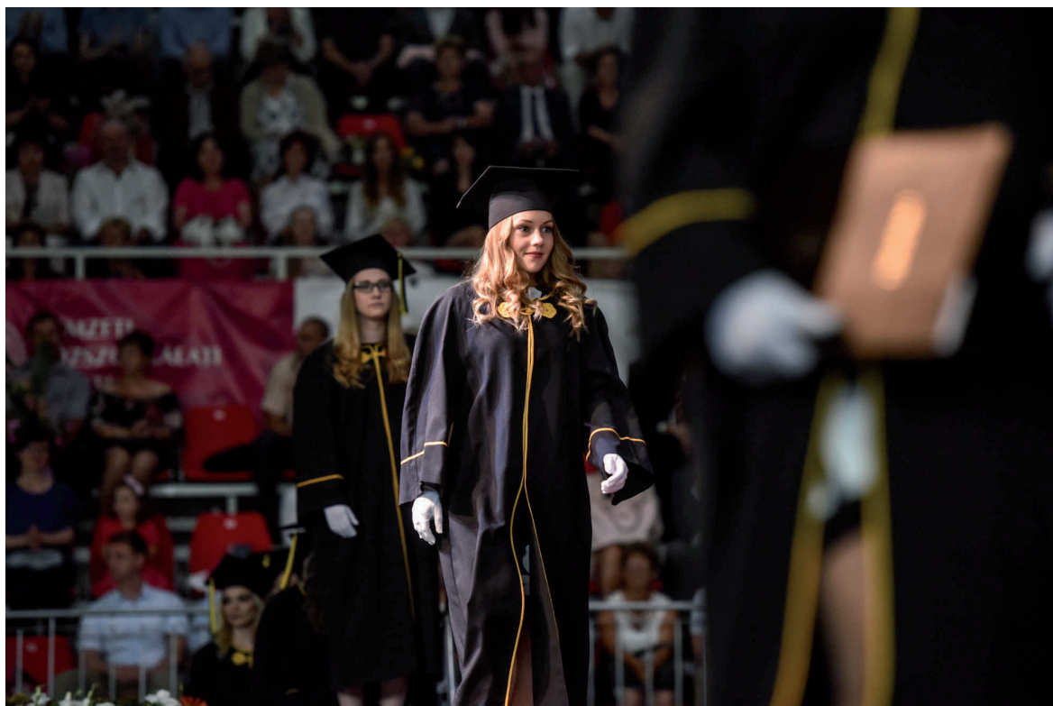
ÁKK oklevélátadó ünnepség 2019. július 12.