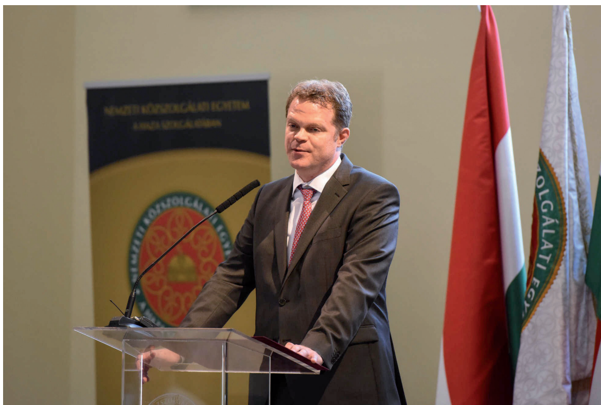
Tanévzáró 2019. július 11.