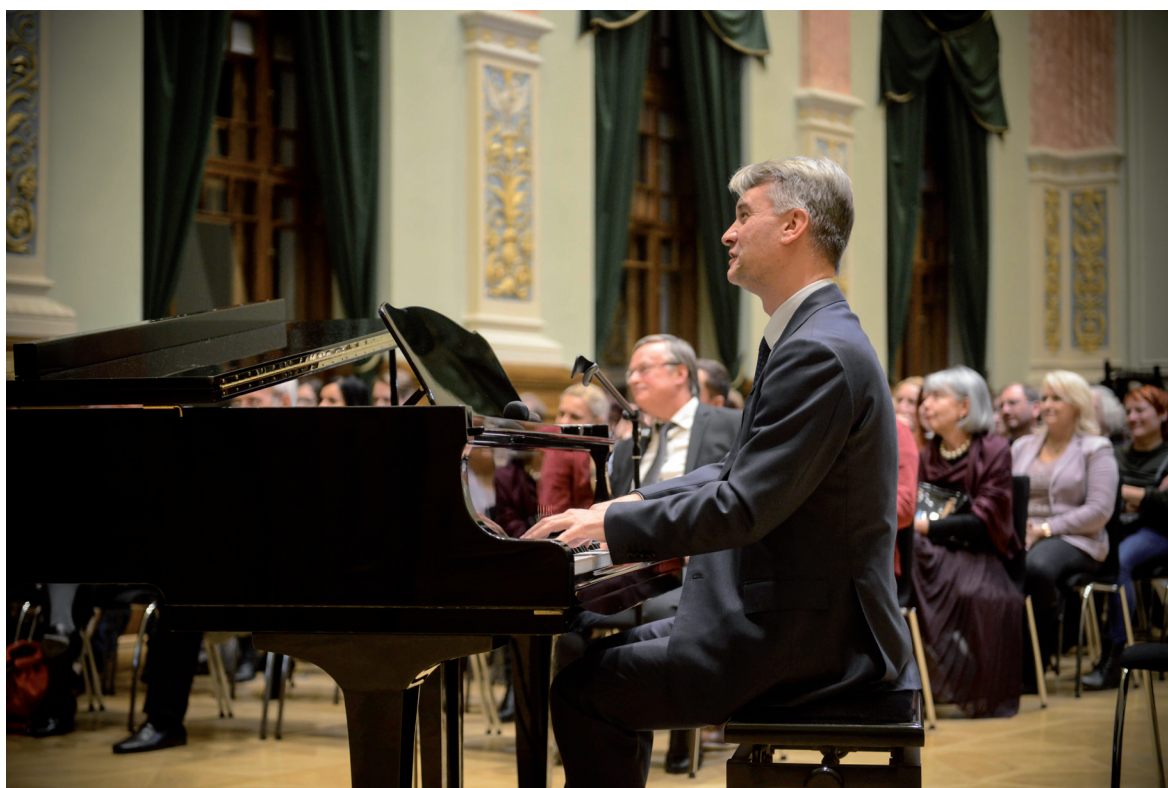
A Ludovika Zeneszalon programsorozat első estje 2019. március 6.