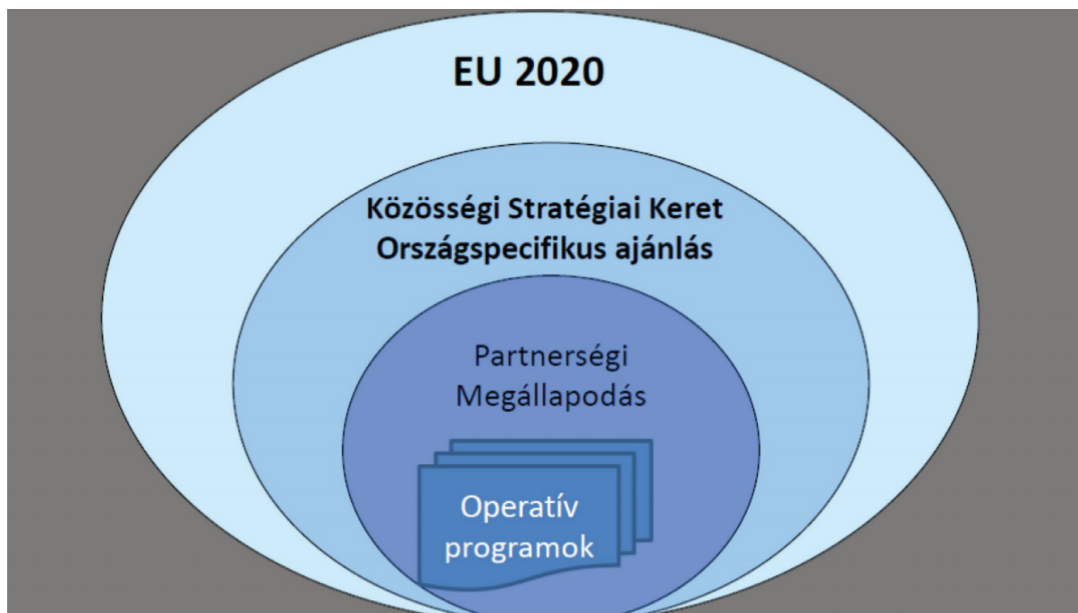
2. ábra: A stratégiák és fejlesztési dokumentumok egymáshoz való viszonya (Forrás: Faragó, 2013)