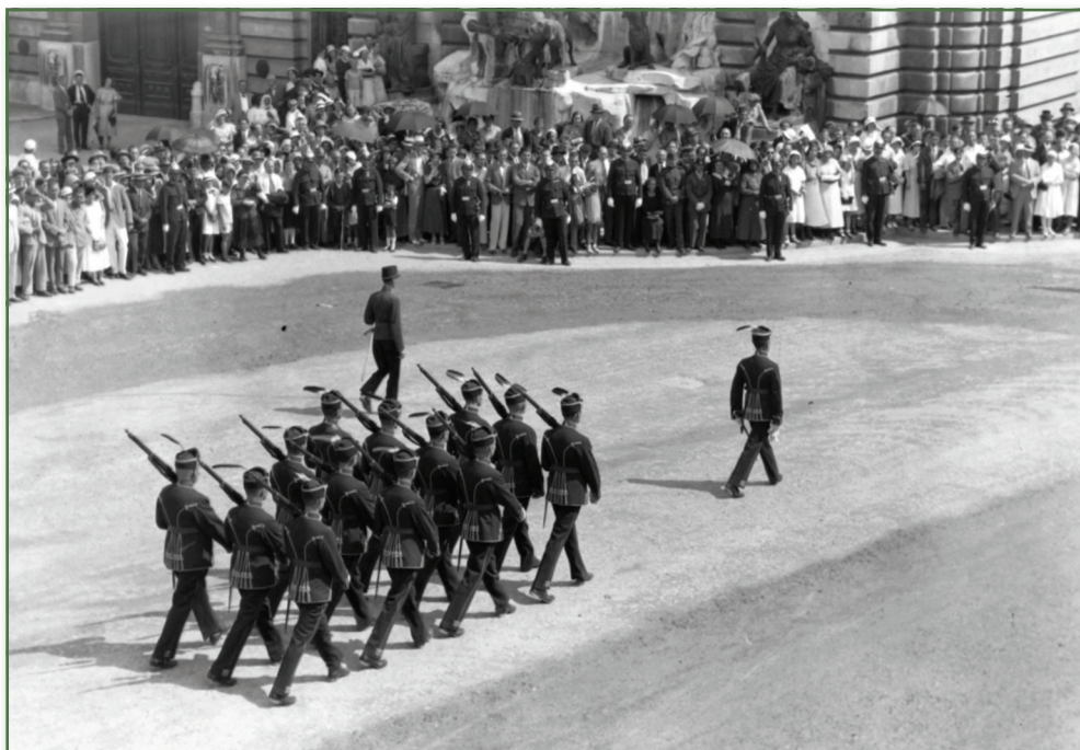
A Magyar Királyi Testőrség tagjai díszegyenruhában 1938-ban a Budai Várban a Királyi Várpalota Hunyadi udvarában

Forrás: Fortepan/Pálinkás Zsolt adományozó. Képszám: 32181 Creative Commons CC-BY-SA-3.0.