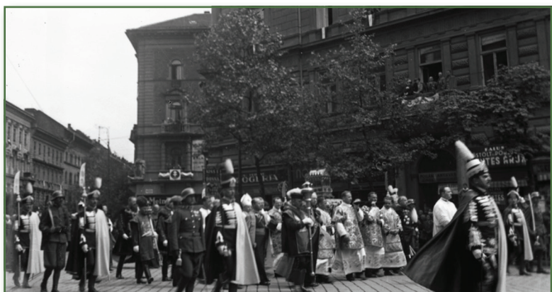
A Magyar Királyi Koronaőrség tagjai által kísért Szent Jobb körmenet 1938-ban a VI. Vilmos császár út és a Podmaniczky utca, valamint Nagymező utca kereszteződésénél

Forrás: Fortepan/orig: Fortepan. Képszám: 44484. Creative Commons CC-BY-SA-3.0.