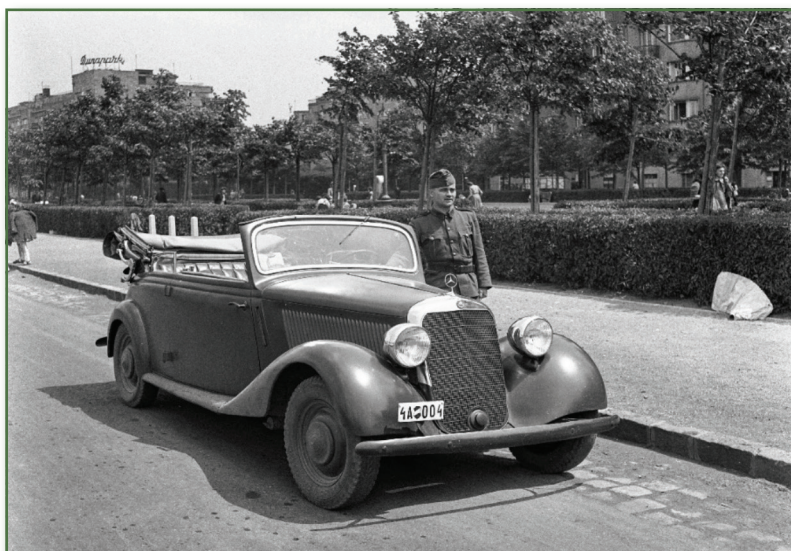
A Magyar Királyi Testőrségnél 1935-től rendszeresített Mercedes-Benz 170 típusú személygépkocsi