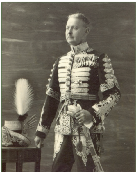
Perczel Olivér (1882–1970) koronaőr tiszt díszegyenruhája