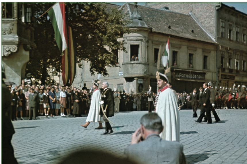
A Magyar Királyi Koronaőrseg tagjai díszelve kísérik dr. Kállay Miklós miniszterelnököt a Budai Várban a Szentháromság tér és a Szentháromság utca sarkán