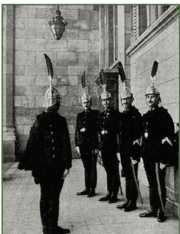
A Magyar Királyi Képviselőházi Őrség legénységének tagjai 1913-ban az Országgyűlés épületének bejárata előtt