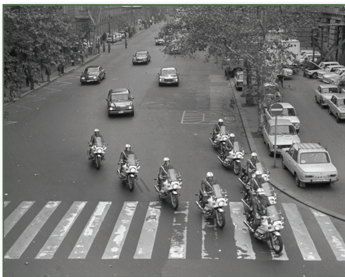
Delegációt kísérő motoros ék 1981-ben Budapesten a Nádor (Münnich Ferenc) utcán a Széchenyi utca felől a Kossuth Lajos tér felé nézve

Forrás: Fortepan/Magyar Rendőr. Képszám: 22494, Creative Commons CC-BY-SA-3.0.