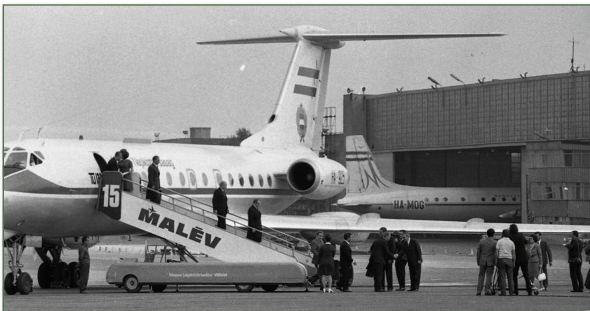
A magyar kormánygép. TU-134 típusú sugárhajtású utasszállító repülőgép a Ferihegyi – ma Liszt Ferenc – repülőtéren

Forrás: Fortepan/Urbán Tamás adományozó. Képszám: 88530, Creative Commons CC-BY-SA-3.0.