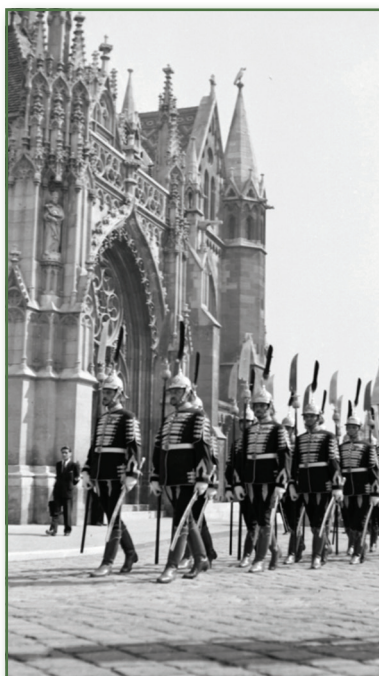
A Magyar Királyi Testőrség tagjainak díszfelvonulása 1938-ban a Budai Várban a Mátyás-templom előtt

Forrás: Fortepan/Pálinkás Zsolt adományozó. Képszám: 32194. Creative Commons CC-BY-SA-3.0.