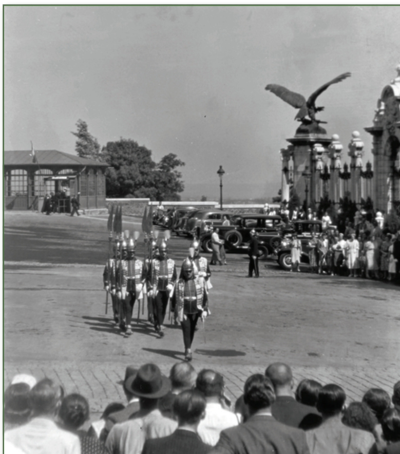
A Magyar Királyi Testőrség tagjai díszegyenruhában 1938-ban a Budai Várban a Szent György téren a Gózsikló végállomása előtt

Képszám: 32179