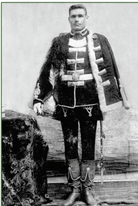
A Magyar Királyi Koronaórség 1871-ben rendszeresített egyenruhája