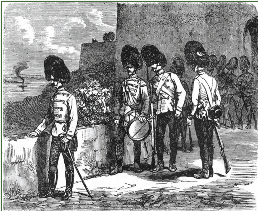
A budai koronaórség gránátosai a Bécsi Kapunál, 1866