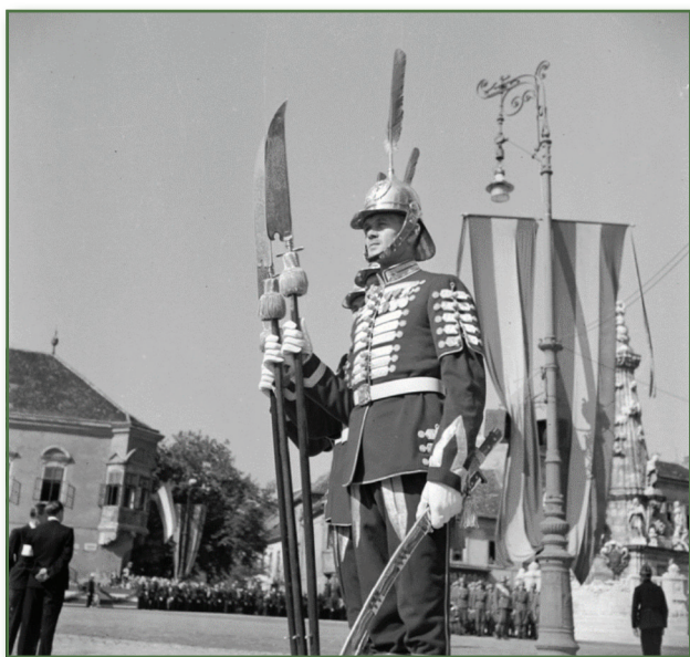
A Magyar Királyi Testőrség tagja díszegyenruhában 1938-ban a Budai Várban a Szentháromság téren

Forrás: Fortepan/Pálinkás Zsolt adományozó. Képszám: 32192 Creative Commons CC-BY-SA-3.0.