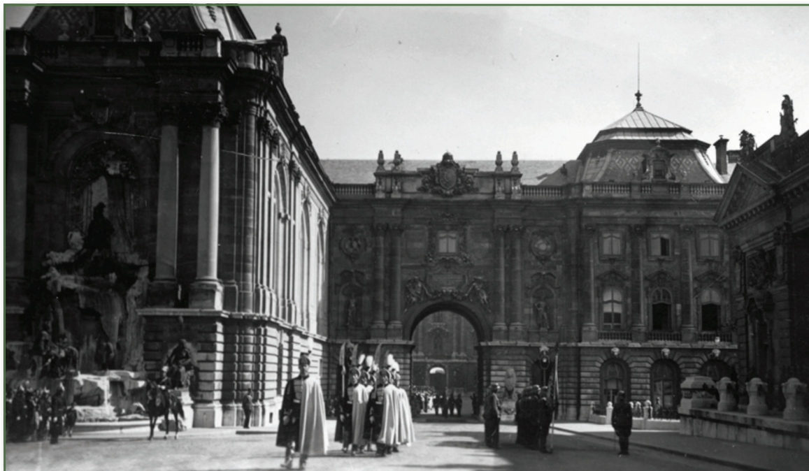
A Magyar Királyi Koronaőrség tagjai díszegyenruhában vonulnak 1936-ban a Budai Várban a Királyi Várpalota Hunyadi udvarán.

Háttérben az Oroszlános kapu, balra a Mátyás király kút