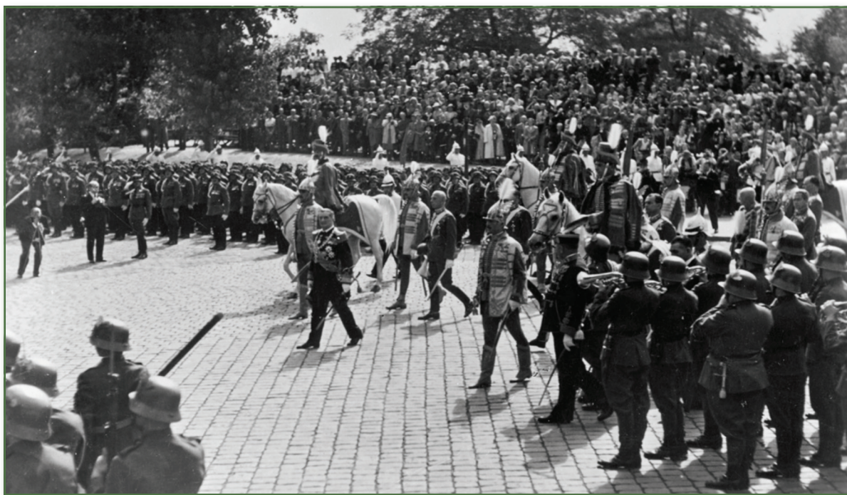
A Magyar Királyi Testőrség lovas testőr tagjai díszlegelve kísérik vitéz nagybányai Horthy Miklós kormányzót 1943-ban a Szent István-napi ünnepségen a Budai Várban a Szentháromság téren