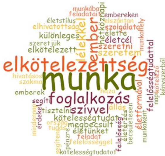
1. számú ábra: A pénzügyőri hivatás fogalmi elemei – szófelhőben