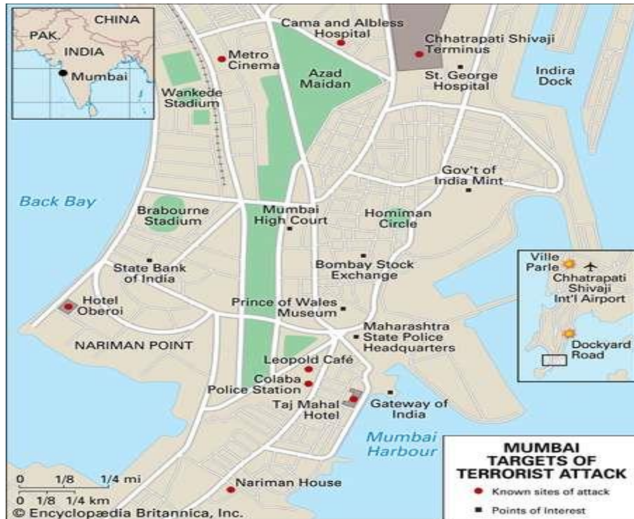
2. számú ábra: A mumbai támadás célpontjai. URL.: https://www.britannica.com/event/Mumbai-terrorist-attacks-of-2008 (letöltve: 2020. 03 07.)

elhagyása után robbantak fel, tovább növelték a zűrzavart. A több célpont egy időben való megtámadása által folyamatosan túlbecsülték a támadóegység méretét, amely megnehezítette a hatóságok számára a helyzetértékelést, és amelyet tovább rontottak a terrortámadások esetén szokásos téves jelentések érkezése. A támadó csoportok kis létszáma korlátozta képességeiket a rendvédelmi erőkkel vívott tűzharcok során, így ha nagyobb tüzerővel találták szembe magukat megszakították a harcot és tovább haladtak a következő célpont felé. 411