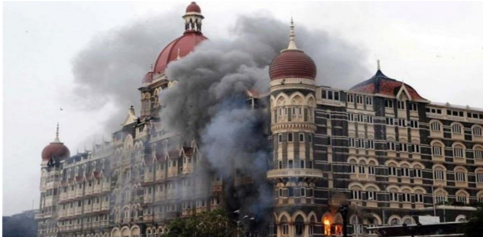
4. számú ábra: Taj Mahal Palace, Mumbai a terrortámadás idején. URL.: https://www.indiatoday.in/india/story/mumbai-attacks-eleven-years-since-26-11-nation-remembers-terror-victims-1622599-2019-11-26 (letöltve: 2020. 03. 07.)

támadók mozgását figyelemmel tudták követni, de a támadók létszám- és tüzereőfölénye miatt nem tudták felvenni velük a harcot. 412