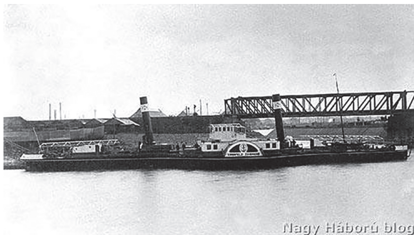
3. ábra. A Kornfeld Zsigmond gőzös