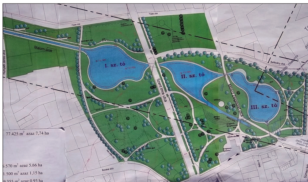
4. ábra: A devcséri emlékpark

Az iszapömlés egyéves évfordulóján, 2011. október 4-én avattak fel Devecserben a katasztrófasújtott lakóterület helyén egy 8 hektáros emlékparkot. A parkban három, egyenként félhektáros vízfelületű látványtavat alakítottak ki, amelyeket a Malom-árok forrásai és a Torna-patak táplálnak. Az emlékpark többi részét zöldterület fedi. A telekalakítási dokumentáció készítése, az ingatlan-nyilvántartási átvezetések és a hatósági engedélyezési eljárások időben lezárultak. Az emlékpark engedélyes terveinek készítése felajánlásból történt, valamint szintén felajánlásból az emlékpark területén egy játszótér kialakítására is lehetőség nyílt.