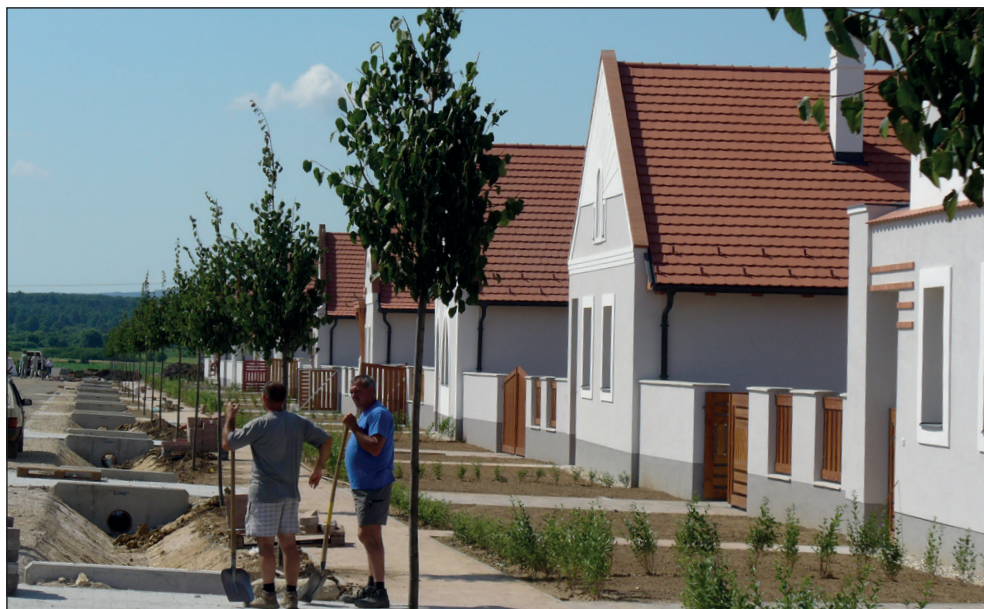
3. ábra: A kolontári lakópark építése

Devecser településen a megépült 89 lakóház műszaki átadása három ütemben történt: