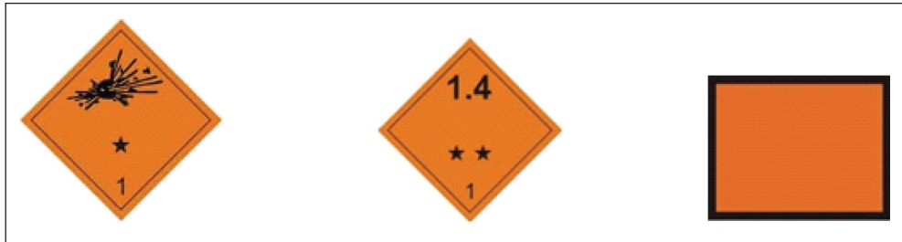
1. ábra: Veszélyességi bárcák [1]

Ezeknek az előírásoknak az ismerete nagy fontosságú a pirotechnikus szakember számára. Az ADR-szabályzókon kívül a szállításnál nagyon fontos az alábbi szempontok betartása is. Pirotechnikai termékek szállítására csak kifogástalan állapotban lévő szállítóeszközt szabad használni, amit – amennyiben a szállított mennyiség meghaladja az ADR 1.1.3.6 bekezdésben meghatározott mentességi határt – el kell látni a megfelelő, az ADR-ben előírt veszélyességi bárcával. (1. ábra) [1]