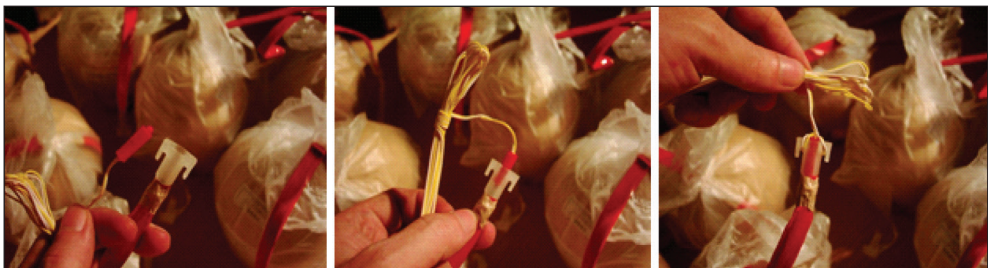
8. kép: Pirotechnikai test izzógyújtóval történő élesítésének lépései (készítette: Patyi György)

Az izzógyújtó az izzógyújtófejből és a ráforrasztott két, megfelelő hosszúságú, mipolán szigeteléssel ellátott, ónozott vashuzal vezetékből álló, pirotechnikai termékek (bombák, mozsarak, stb.) indítására szolgáló gyújtó (indító) eszköz. (8. kép)