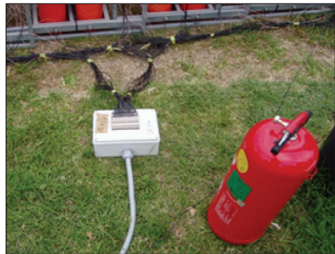
2. kép: Tűzoltó készülék készenléti helyen (készítette: Patyi György)

7. A telepítést a pirotechnikai termékek kihelyezésével kell folytatni. Minden terméket rögzíteni kell elmozdulás ellen. A töltetek élesítését követően a pirotechnikai anyagot el kell helyezni a vetőcsőben. Miután ez megtörtént, meg lehet kezdeni az indító vezeték-hálózat kiépítését. Nagy tűzijátékok készítésénél párhuzamosan több helyszínen végezhető a töltés és a vezetékkelés. (3. kép)