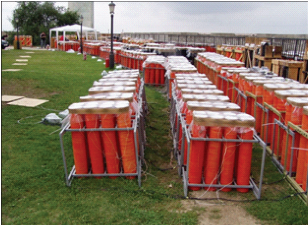
7. kép: Működési terület (készítette: Patyi György)

14. A működési területet a telepítés befejeztével át kell vizsgálni, és az esetleges tűzforrásokat (csomagolóeszköz, felesleges indítóeszközök stb.) el kell távolítani.