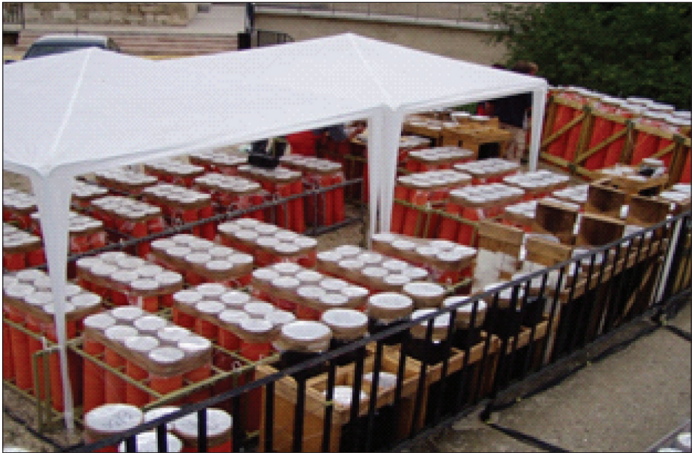
5. kép: Lefóliázott élesített töltetek (készítette: Patyi György)

11. A telepített pirotechnikai terméket védeni kell az időjárás káros hatásaitól. Ha olyan megoldást (fólia, sapka) alkalmazunk, amit a kirepülő eszköz átüt vagy a pirotechnikai eszköz működését nem befolyásolja, azt az indítás előtt nem szükséges eltávolítani. Egyéb esetben igen. A vetőcsöveket csoportosan csak úgy lehet ellátni védőfóliával, hogy csak az egy időben (egy tűzben) működtetett eszközök lehetnek egy védőfólia alatt, egyébként csak egyedi védelem alkalmazható. (5. kép)