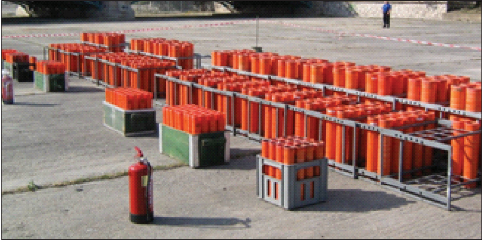
1. kép: Telepítés és működési hely kijelölése (készítette: Patyi György)

5. A telepítés a működtetési terület kijelölésével vagy lezárásával/elkerítésével kezdődik. A kordon távolsága a kilövőhelytől minimálisan annyi legyen, mint a felhasznált pirotechnikai termékek legnagyobb védőterülete. (1. kép)