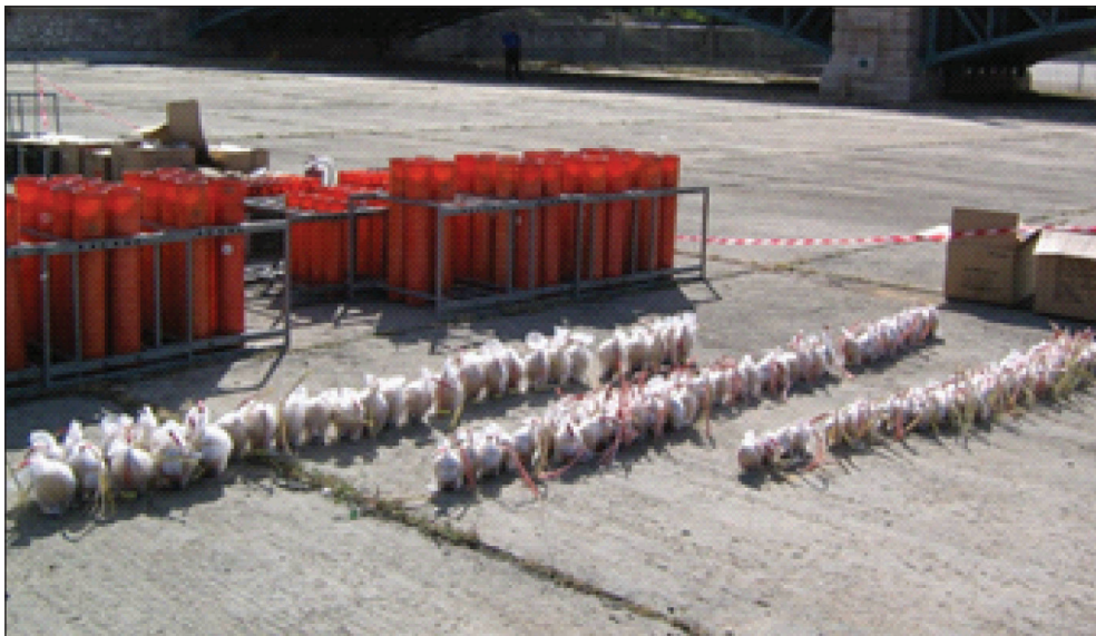
3. kép: Pirotechnikai termékek kihelyezése

8. A pirotechnikai termékeket elműködtetési sorrendben kell a telepítési helyre kihelyezni, olyan módon, hogy az esetleges hibás töltetek felrobbanásakor ne jelentsenek veszélyt a szomszédos egységekre.