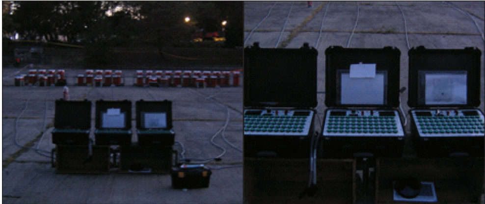
6. kép: Csatlakoztatott áramforrás és indítógép

13. A telepítés megkezdésétől állandó felügyeletről gondoskodni kell. A működtetés során, a működtetési helyen az indítást végző személyzet kivételével más személy csak a felelős pirotechnikus engedélyével tartózkodhat.