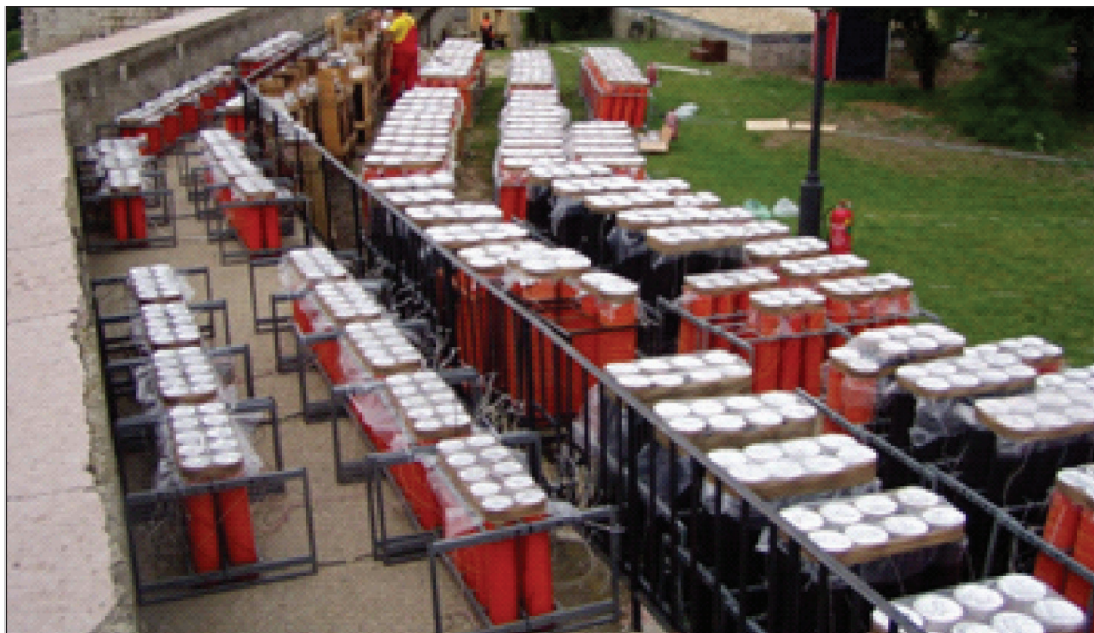
4. kép: Kialakított közlekedési utak (készítette: Patyi György)

9. A telepítésnél közlekedési utakat kell kialakítani. A kilövés irányába akadály nem lehet. A nézők fölött átlőni szigorúan tilos. (4. kép)