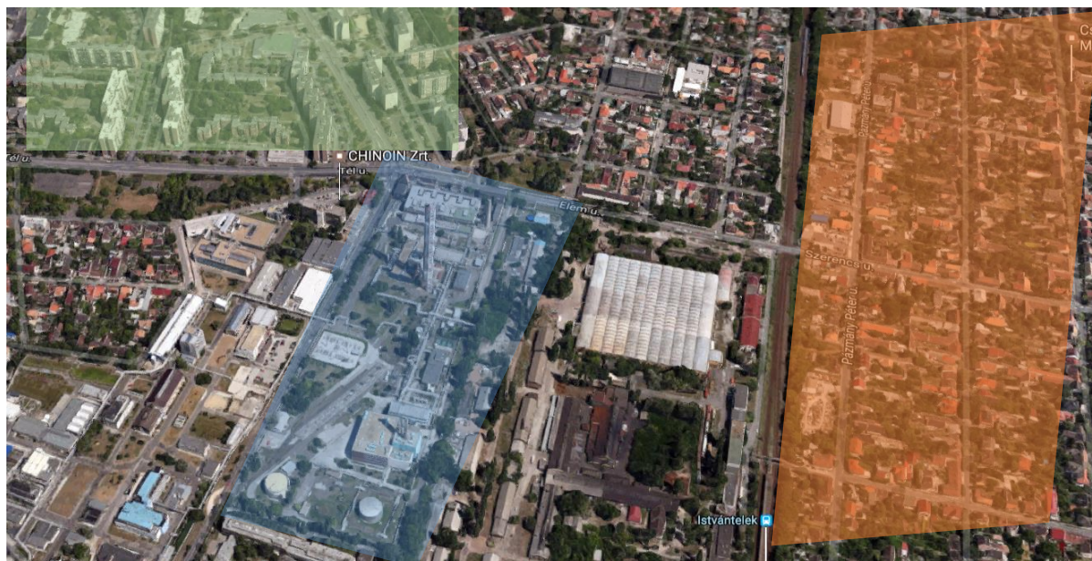
1. ábra: Chinoin gyár és vonzáskörzete [2]

Az üzemek telepítésének elvét, elsődleges szempontjait az Athéni Charta (Modern Építészet Nemzetközi Kongresszusa 1928-1959, IV. kongresszus: 1933 Athén, Görögország) határozta meg, amely szerint az ipari szektornak függetlennek kell lennie lakó övezetektől, amelyektől