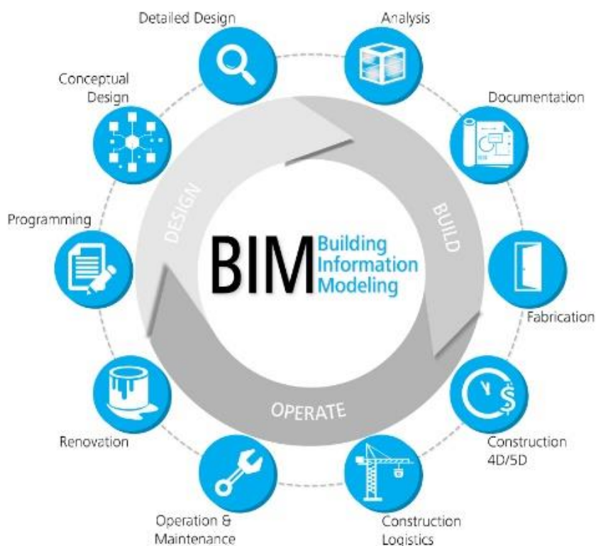
4. ábra BIM [22]

háromdimenziósak, csakúgy, mint a tűz jelensége, vagy a kiáramló veszélyes anyag terjedése, ezért a 3D tervezés, modellezés kompatibilis elvek alapján működhet, és kellene is, hogy működjön. El kell felejtetni a 2D-ben történő gondolkodást mind a tervezői, mind a hatósági, szakhatósági oldalon, mert a valóság 3D. Ezt a tényleges térben történő tervezést és ellenőrzést nagymértékben elősegítik a már most rendelkezésre álló szoftverek. Képesek 3D metszetek felvételére, amelyeken látható a teljes épület mélységében átmenő tűzszakaszolás, amely sosem egy-egy vízszintes és/vagy függőleges vonal csak, hanem 3D-ban tört folytonos síkok kapcsolatrendszerre, amely tereket határol. A tűzterjedés elleni védelem mérnöki szemléletű elemzése már ebben a tervezési fázisban meg kellene, hogy történjen, és a fenti eszközök és módszerek alkalmazásával könnyedén meg is történhet. Az építészeti modell megfelelő adaptálásával, a hő-és füstelvezetést, vagy a kiürítést szimuláló szoftverek képesek lesznek és részben képesek ma is a hordozott információk felhasználásával egy a valósághoz hasonló szimulált jelenség leképzésére, ezáltal a tervezés és a mérnöki gondolkodás kiszélesítésére. Minden szereplő számára megkönnyíti, és nagymértékben pontosítja a megfelelő tűzvédelem megvalósulását a rendelkezésre álló szoftveres lehetőségek alkalmazása. [21]