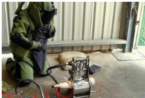
2. ábra: A robbanószerkezet veszélyes ABV töltetének átfajtése

Annak megállapítása, hogy a (robbanó)szerkezet tartalmaz-e ABV anyagot vagy sem, alapvető fontosságú, azonban ennek meghatározása megnöveli a hatástalanítási folyamat idejét. A CBRN–IED által tartalmazott veszélyes anyag beazonosítása is kiemelten fontos, hiszen ez határozza meg az ABV fenyegetés szintjét, valamint a szükséges biztonsági lépéseket és a kordontávolságot egyaránt.