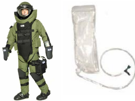
3. ábra: EOD-9 tűzserész ruha, valamint a folyadékfelvételt biztosító víztartály

A ruházat tartozéka az alábbi ábrán látható képliteres víztartály, amely lehetővé teszi a folyadékfelvételt a műveletek közben, azonban ez a lehetőség a továbbiakban ismertetett védőruhatípusoknál korlátozottan áll rendelkezésre.