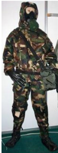
6. ábra: A 93M „szűrő típusú” védőruha (Készítette: Berek T.)

Erre a védőruhátípusra a szigetelő típusú védőruhához képest kiemelkedő komfortfokozat jellemző. A védőruhát úgy tervezték, hogy a verejtéket a szűrőrétegen keresztül, valamint a mozgás során képződő levegőáramlással külső környezetbe juttassa. Ez azt eredményezi, hogy a bőrfelület és a ruha közötti levegőrétegben a páratartalom növekedése mérsékelt marad csökkentve a hőstressz kialakulásának veszélyét. [12]