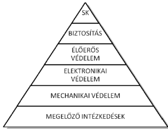
1. ábra: A komplex vagyonvédelem összetevői 4

A fenti csoportosítás komponenseit egyenként vagy akár egyszerre is alkalmazhatják, azonban a magas szintű biztonság a fentiek összehangolt, optimális, arányos alkalmazásával érhető el, ez a komplex őrzés-védelem, vagy az őrzés-védelem komplexitása. [5]