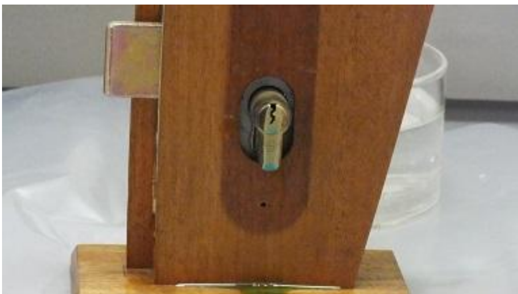
3. ábra: Hengerzár savazása, annak valóságos szerelési helyzetében

Az ezzel kapcsolatos modellkísérletek (Elek Imre 2010) során a hengerzárbetétek, a záruk valóságos szerelési helyzetében - 50 ml salétromsav felhasználásával - végzett savazását követően megállapítást nyert, hogy 24 óra eltelte után a reteszeléást végző szerkezeti elemek oxidálódtak, de sérülésmentes állapotban maradtak és a csapfészkekben lévő rugók az ellencsapok helyretolásához megfelelő rugóerőt biztosítottak. A hengerzárbetétekben lévő csapfészkek peremrészeinek sértetlen állapota alapján, zárt állapotban történt hengerkihúzás kizárható volt. A hengerzárbetétek hengereinek eltávolítása csak a henger elfordított, a hengerrögztő gyűrű eltávolított, vagy kitágított állapotában történhetett volna. [14]