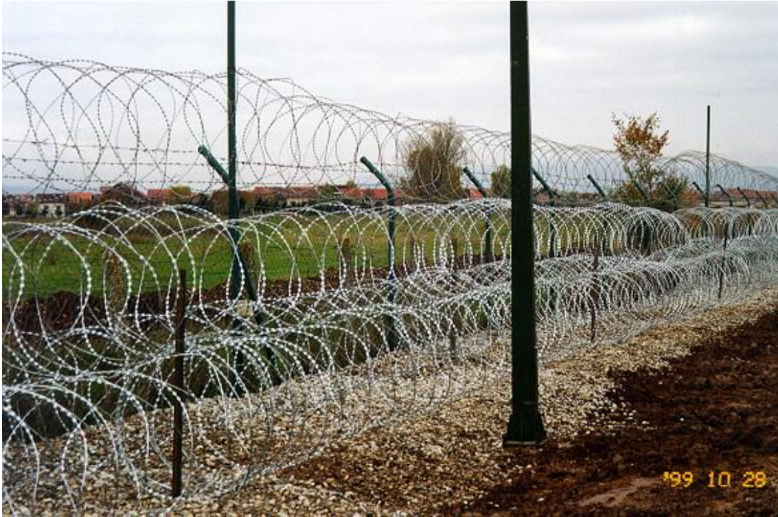
Katonai tábor védő kerítés 9

akadályozó elemeket gyakorta álcázzuk, addig a béketámogató műveletek többségében hangsúlyozzuk azok szerepét. Álcázásról nem beszélhetünk, hiszen a talaj felszínére, jól láthatóan helyezük el az elemeket. A telepített drótakadályok élettartamát növeli, hogy – megelőzve az aljnövényzet okozta problémákat – geotextil szőnyegre terített kavicsszórásra kerülnek az elemek. 8