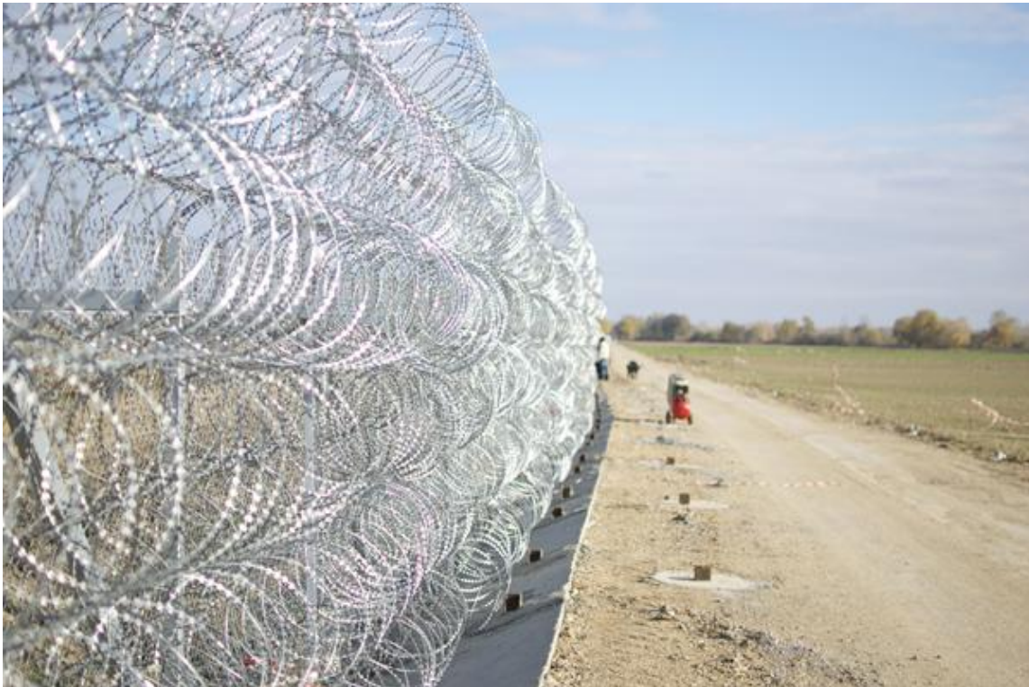
Kerítés a görög-török határon 15

mellette. 14 A fal megépítése azonnali eredménnyel járt, mert drasztikusan csökkent ezen a szakaszon a migránsok száma. Ugyanakkor a jelenség nem szűnt meg, csak az útvonal változott és a súlypont áthelyeződött az Égei-tengerre.