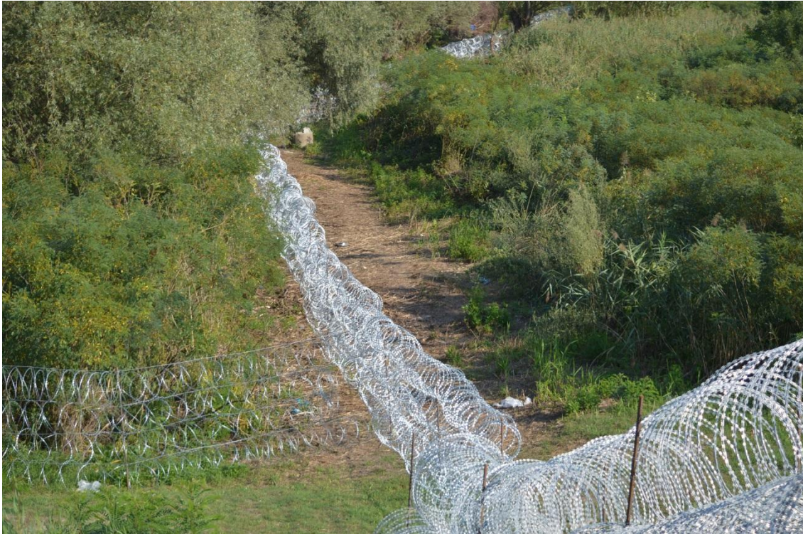
A határzár első üteme: a telepített dróthengerek 24