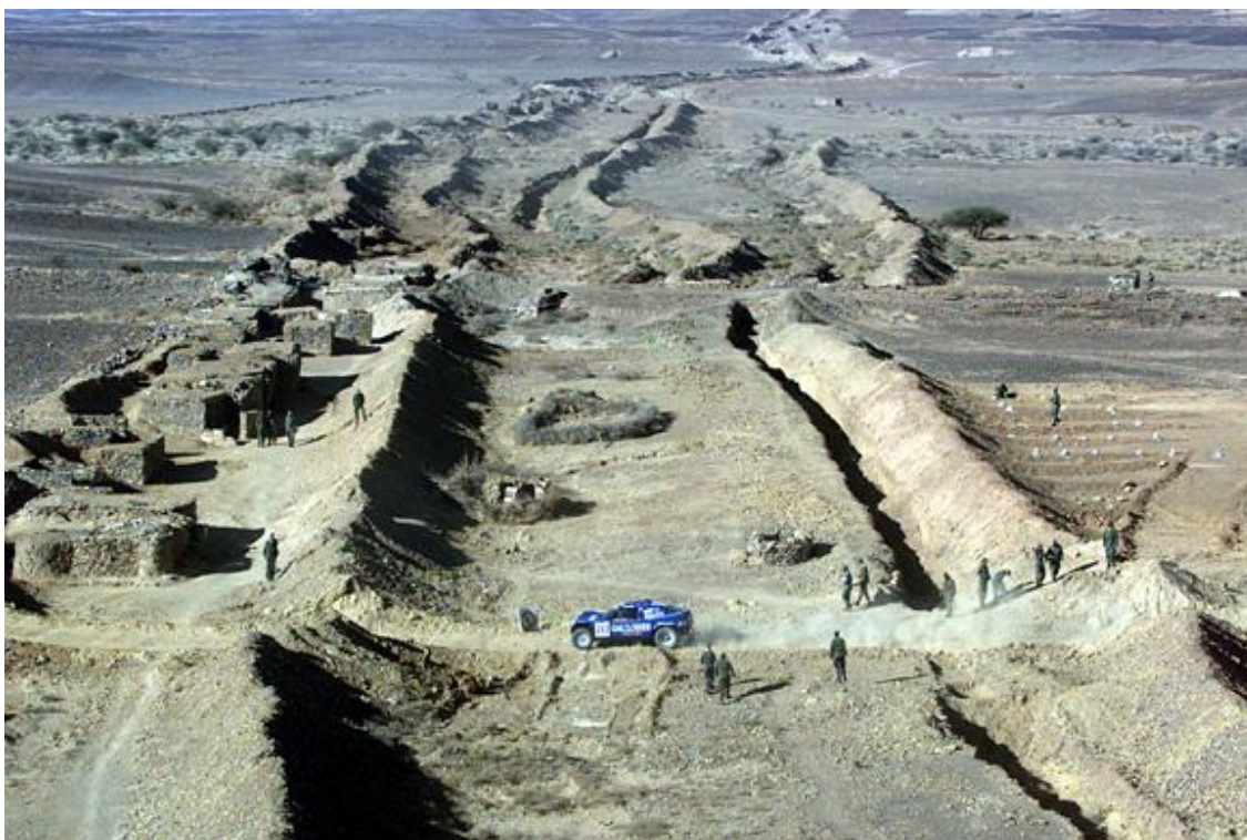
Műszaki zár a sivatagban 21

Nem lenne teljes a kép, ha nemoznánk a Magyarország déli határán létrehozott műszaki zárról, hivatalos nevén a határőrizeti célú ideiglenes biztonsági határzáról. 22 A hivatkozott kormányrendelet meghatározza mind az ideiglenes biztonsági határzár területét, mind az ideiglenes biztonsági határzár fogalmát. Eszerint: