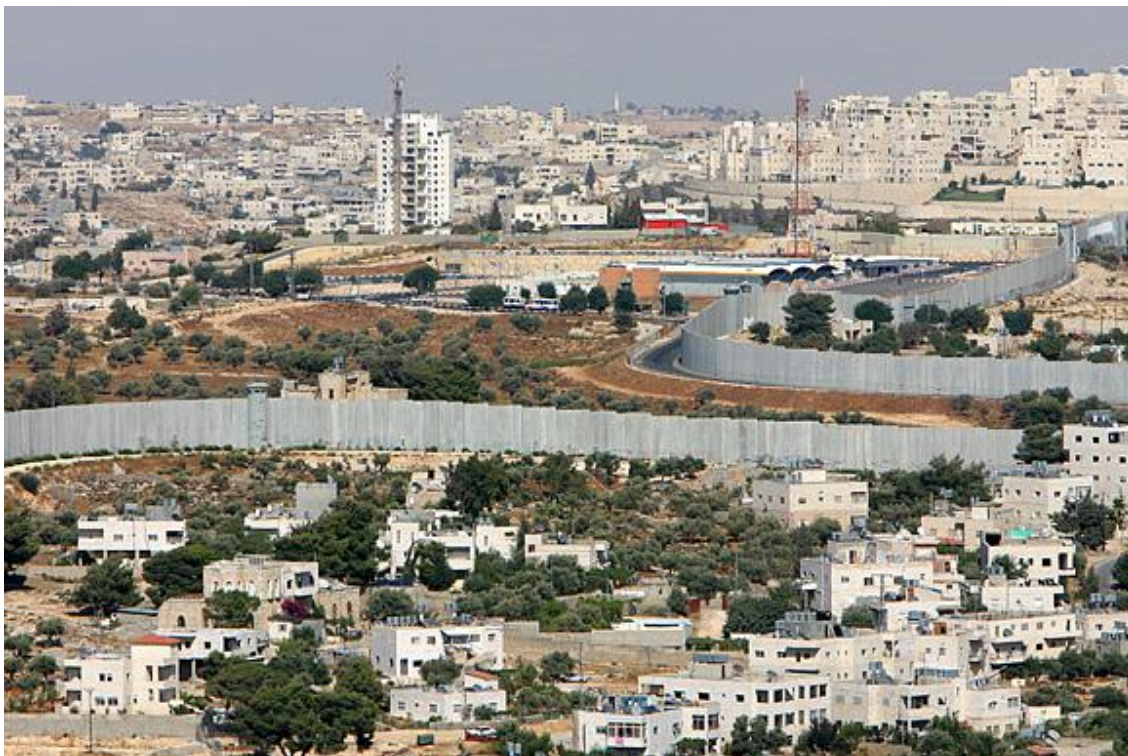
Beton elemekből épült kerítés Ciszjordániában 19

A marokkóiak 1980-tól kezdve hat ütemben felépítették a Bermet vagy más néven marokkói falat, amely 2700 kilométer hosszan húzódik a sivatagban (Nyugat-Szahara), nagyjából párhuzamosan az óceán partjával. A homokból és kövekből rakott falat és árkokat öt kilométerenként kisebb-nagyobb erődítmény töri meg, ahol katonák állomásoznak. A műszaki zár megépítésének célja az volt, hogy távol tartsa a gerillákat a Marokkó számára értékes szaharai területektől, valamint a megszállás törvényesítése, véglegesítése. 20