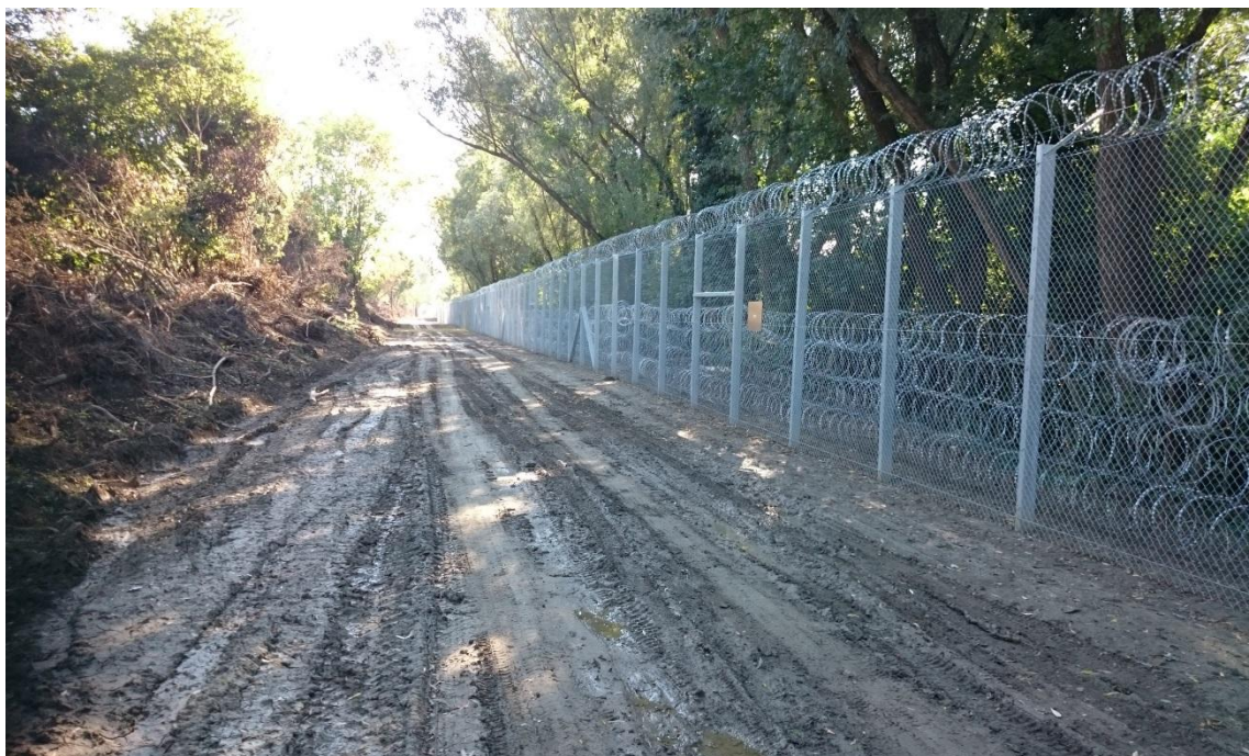
A határzár második üteme: a kerítés 25