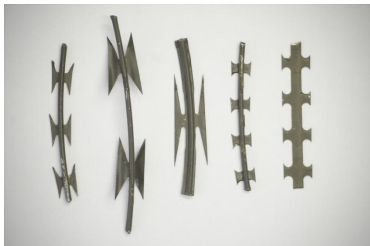
Különböző kialakítású vágó élek 5

A dróthengerek jól alkalmazhatóak a személyek és a járművek ellen, függően a felhasznált drót vastagságától, minőségétől. Egyik fontos ismérvük, hogy vágó éllel ellátott dróthuzalból készülnek.