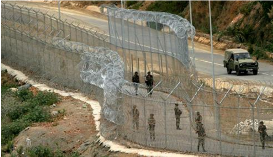
Kerítés Ceuta körül 16

hogy Ausztria 4 km hosszú kerítést épít a stájerországi Spielfeldnél, a szlovén határon. A kerítés magassága 4 méter, és polgári-katonai együttműködésben épül.