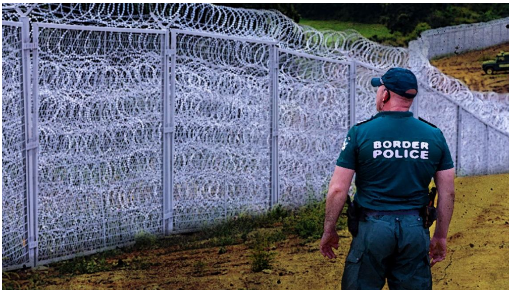
Kerítés a bolgár-török határon 12

Bulgária 2014-ben kezdett el egy 30 kilométeres kerítést felhúzni a főleg közel-keleti migránsok áradatának megfékezésére, Törökországgal közös határán. A kerítés ötmillió dollárba került, a hadsereg fejezte be, és ezzel hetedére csökkent az illegális határátlépések száma.