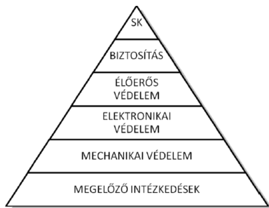
A komplex vagyonvédelem összetevői 4

A komplex vagyonvédelem egymásra épülő összetevőkből áll, melynek célja a kockázatok előfordulási valószínűségének és az egyes, mégis bekövetkező kockázati események káros következményeinek minél nagyobb mértékű csökkentése. [7] Összetevőinek kapcsolatát legérzékletesebben piramisban történő ábrázolással szokták kifejezni