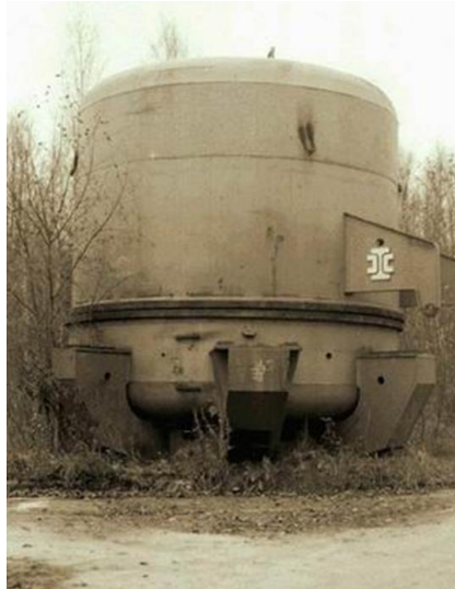
8. ábra: VK-10 típusú robbantókamra

(National Academy of Sciences of the republic Belarus, Research Institute of Impulse Processes with Pilot Plant) kifejlesztett és megépített VK-10 típusú robbantókamrát a 8. ábrán mutatjuk be.