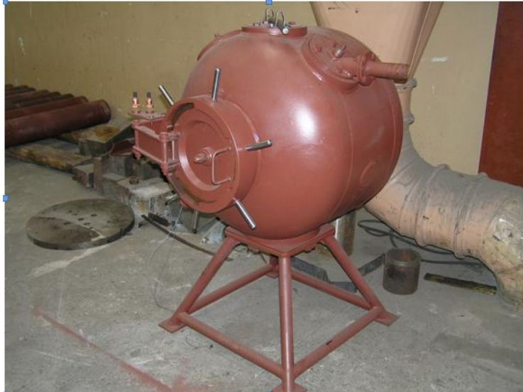
4. ábra: KV-0.2 tip. robbantókamra. A kamra össztömege 1.3 t, fő méretei: 1800 x 1200 x 1630 mm

Egyszerűsített kivitelű robbantókamrák (KV-0.2 és KIP-0.2)