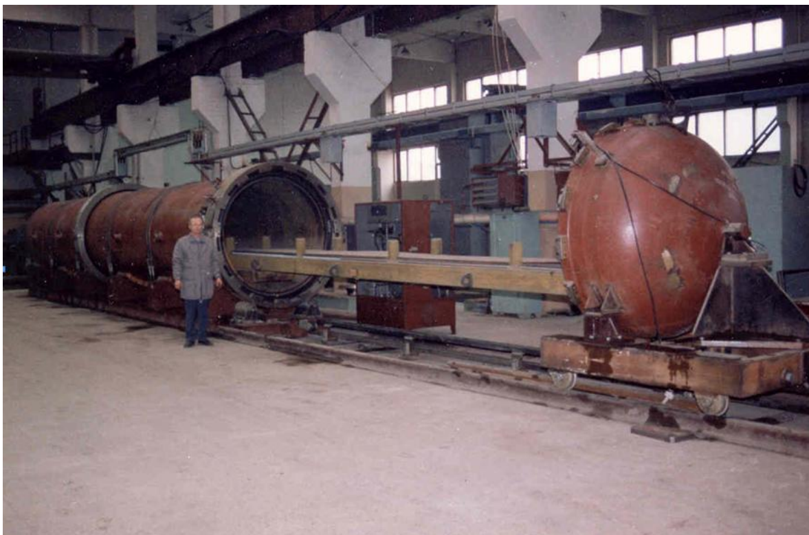
7. ábra: A KVG-16 típ. robbantókamra munkaasztala 10 m hosszúságú sínen mozog; A felhasználható robbanóanyag tömege 2 kg/1 m. A kamrát elsősorban vasúti sínek robbantásos keményítésére tervezték.