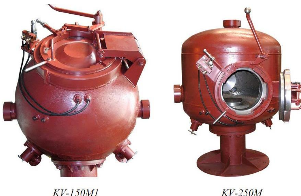
3. ábra KV-150M1 és KV-250M robbantókamrák

Ezen kamrákat tudományos kutatások, technológiafejlesztések és robbanóanyagok vizsgálata céljára tervezik és gyártják. A kamrák acél tartállyal épülnek, 150 gramm illetve 250 gramm TNT egyenértéknek felelnek meg (3. ábra).