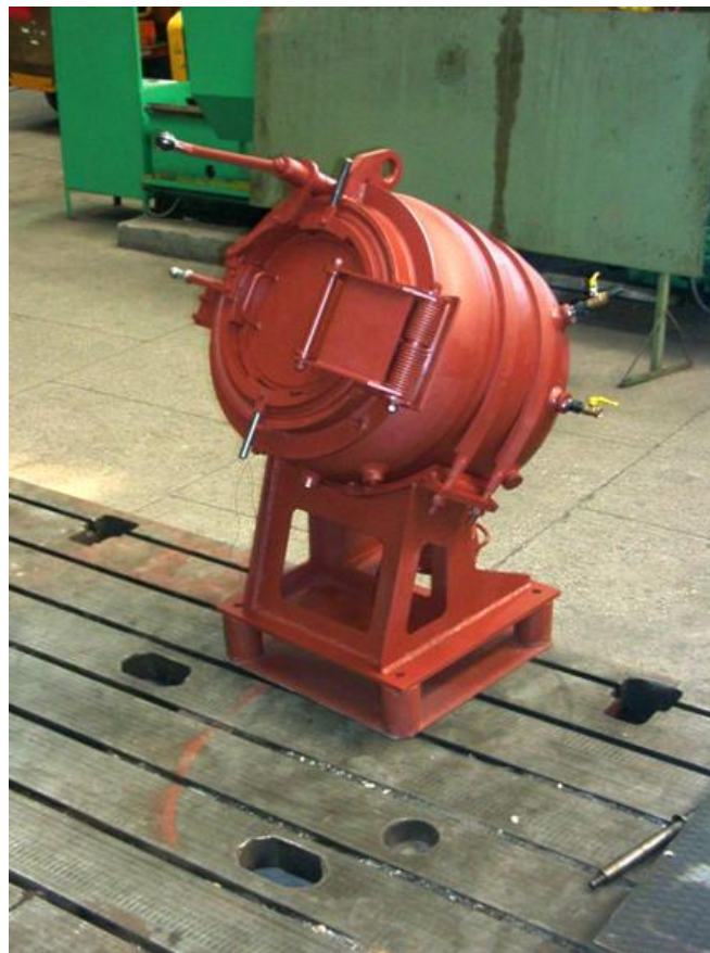
5. ábra: KIP-0.2 tip. robbantókamra; A kamra össztömege 0.85 t, méretei: 1030 x 850 x 1400 mm

További típusok ebből a sorozatból: KV-2 és KV-5, 2 kg illetve 5kg TNT egyenértékre tervezve.