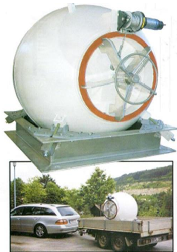
9. ábra: GUT55 típusú robbantókamra

A robbantókamra különlegessége, hogy tehergépkocsival könnyen szállítható kivitelű.