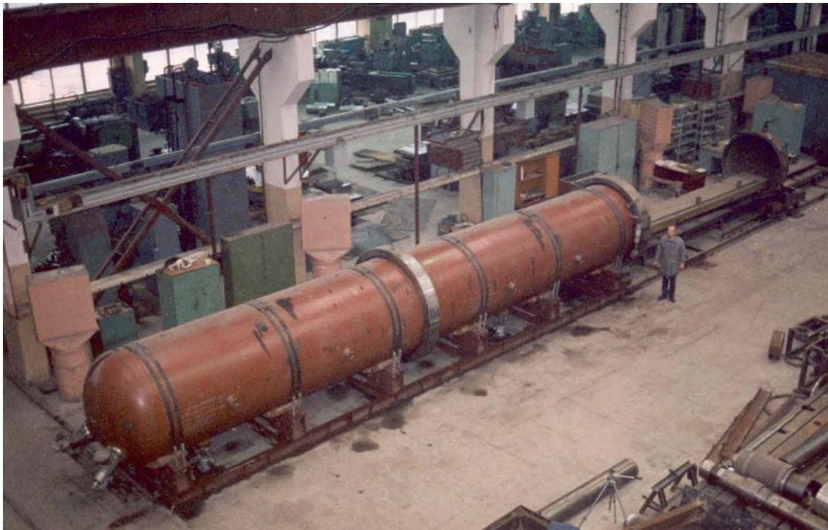
6. ábra: KVG-16 típ. robbantókamra; A kamra össztömege 76 t , fő méretei: 27210 x 2200 x 2460 mm