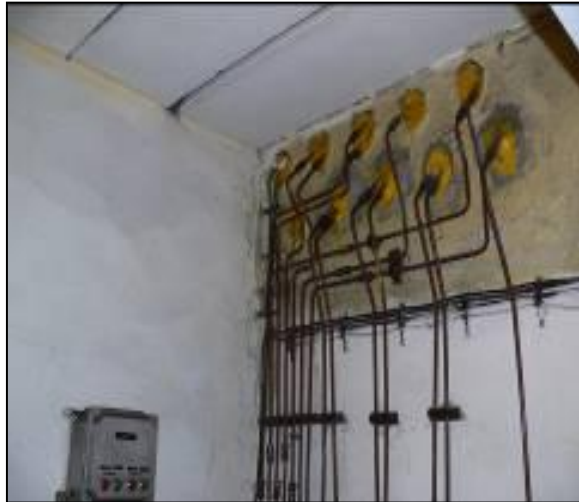
3. sz. kép: Hermetikus, tömszelencés kábelátvezetés 5