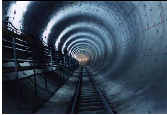
2. sz. kép: Mélyvezetésű beton – tübbinges technológiával épült alagútrészlet 4