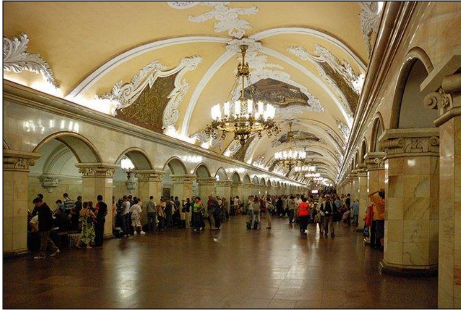
1. sz. kép: A moszkvai metró egyedülálló építészeti megoldásai 2

Az eltérő megvalósítás a fentiekén kívül, a különböző építési módokra és az alkalmazott technikai színvonal különbségeire vezethető vissza.