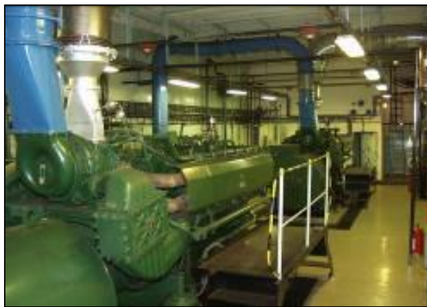
7. sz. kép: 2 X 8 hengeres Diesel motor 9

Az óvóhelyi funkció üzembiztosságának ez az egyik legalapvetőbb követelménye. A szektorok generátorai szinkron üzemben működve közel 2 MW villamos energiát képesek előállítani. A szükséges üzemanyag-mennyiség, mely egy 72 órás üzemet feltételez, a helyszínen rendelkezésre áll. A 7. számú képen egy szektor energiaellátó gépegysége látható.