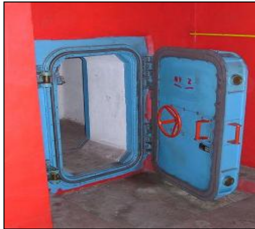
5. sz. kép: Expanziós tér, kézi működtetésű ajtóval 7

A robbanások által előidézett túlnyomások elleni védelmet biztosítják az expanziós (5. sz. kép) és a porkamrák, továbbá az ott beépített „ZS” szelepek.