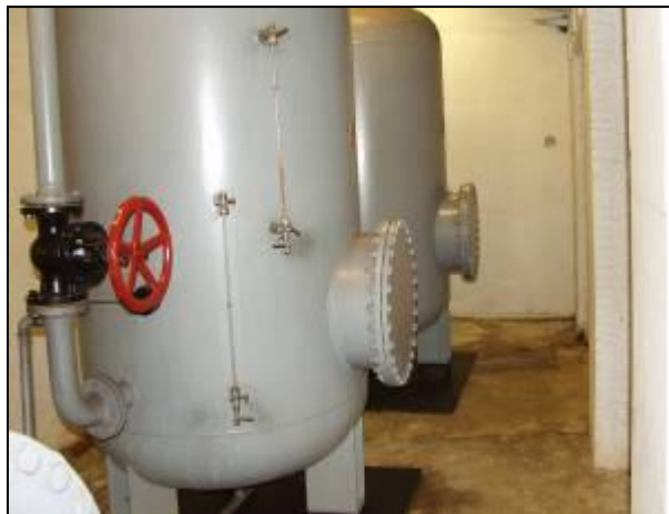
8. sz. kép: A nyomásfokozó berendezés gépháza 10

A metró „forgalmi” és „védelmi” üzeméhez szükséges vízmennyiséget a városi, valamint a szektorok önálló kútjai biztosítják. A vízhálózat a városi vízről és a szükség – vízellátó rendszerekkel üzemeltethető. A szektorok szükség víz ellátó rendszerének (csápos vízhálózat) feladata, hogy óvóhelyi üzemmódban a védett térben tartózkodók részére, megfelelő mennyiségű és minőségű ivóvizet, és használati vizet biztosítson. A dízel üzemű gépek hűtéséhez szükséges ipari vizet is a két hálózatról nyerik. A rendszer használatára csak akkor kerül sor, ha a városi vízhálózat olyan mértékben sérül és szennyeződik, hogy a víz emberi fogyasztásra alkalmatlan lesz, vagy a hálózat használhatatlanná válik. A rendszer az elzárkózott lakosság számára a napi ivóvíz és használati víznormának megfelelő mennyiséget képes biztosítani. A 8. számú képen a csápos vízhálózat nyomásfokozó berendezései láthatók.