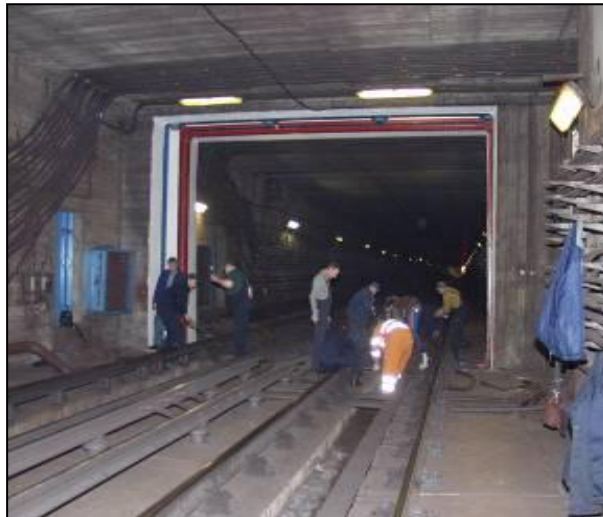
4. sz. kép: Vonali elzáró kapu bezárás előtti munkálatai 6

A metró kapui biztosítják a védett tér külvilágtól történő elzárását. Továbbá, a metró rendszerén belül az egyes szektorok egymástól történő elválasztását. A 4. számú képen egy vonali elzáró kapu látható.