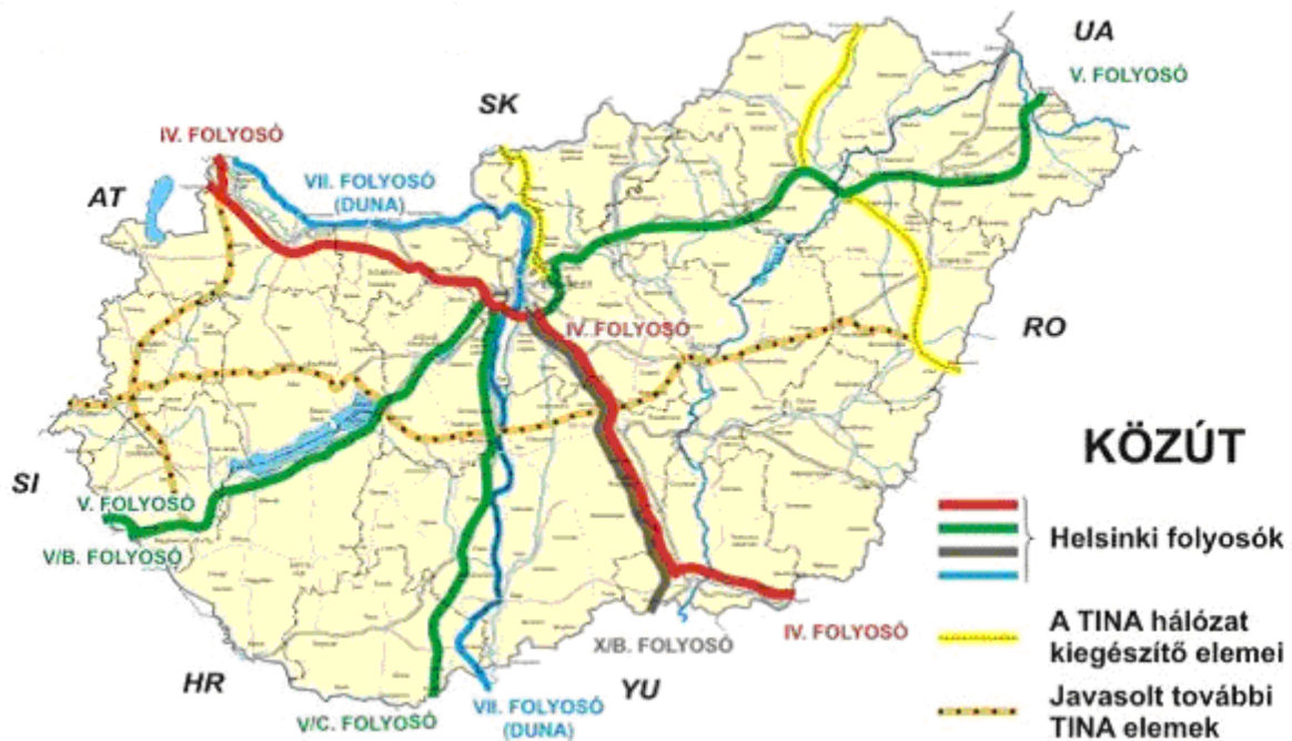
2. sz. ábra: A fővárost érintő főbb közúti vonalak 7

A veszélyes anyagok szállítása vízen, közúton, levegőben és vasúton történhet. A legtöbb szállítással összefüggő baleset a közúti szállítás során következik be. Budapest központi helyet tölt be a belföldi közlekedési funkciók tekintetében, és emellett több európai közlekedési korridor is érinti a fővárost. A nemzetközi és hazai szállítási útvonalakat a 2. számú ábra mutatja.