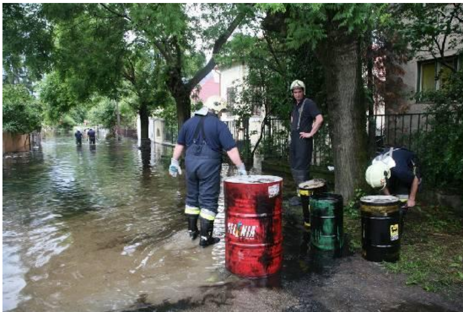
1. sz. kép: Megáradt Hosszúrét-patak Budapesten. 11

Ezeket a lehetséges károkat szemlélteti az 1. számú és a 2. számú kép. [11], [12]