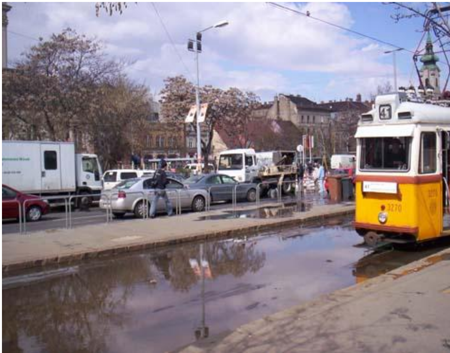
2. sz. kép: Víz okoz gondot a villamos közlekedésében (2006). 12

Az árvizek elleni védekezés nagy erőket igényel, és a védekezés hatékonysága nem minden esetben képes megakadályozni a víz okozta rombolást. A megemelkedett talajvízszint belvizeket okozhat, mely ellen nem lehet hatékony megelőzést folytatni. A már kialakult magas vízszintet szivattyúk segítségével lehet csökkenteni. A hirtelen jött, nagy intenzitású esőzések bizonyos esetekben váratlanul érik a közterületeken tartózkodó lakosságot, és szinte teljesen védtelenek a szél és az eső okozta hömpölygő víztömeg hatása ellen.