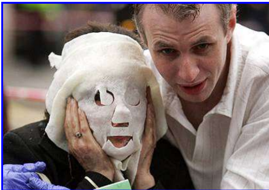
4. sz. ábra: világhírűvé vált kép egy sérültről és a segítségére siető mentőorvosról London bombings, 2005.

az akkori londoni gyakorlat, hogy a londoni mentőszervezetek a megelőző időszakban orvos „aranycsapatot” állítottak fel, akiket, és még 200 főnyi egészségügyi személyzetet nagyon rövid időn belül tudtak riasztani, aktiválni és alkalmazásba helyezni a több mint 52 halott és 700 sérült ellátására. (lásd. 4. sz. ábra.)