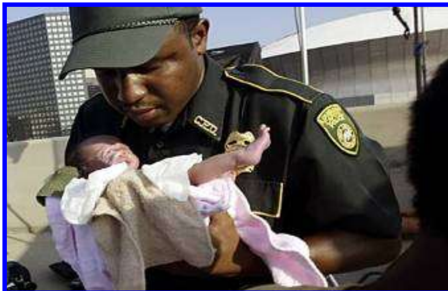
10. sz. ábra: Új élet a romok között, forrás: 19

beteg, gyermekek elhalálzásának veszélyét, hiszen a természet és az élet nem állt meg. (10. sz. ábra)