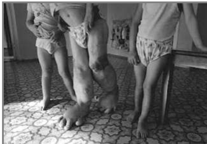
3. sz. ábra: genetikai eredetű károsodások, készítette: Paul Fusco, Forrás: 7

1986-ban, a Csernobil atomerőmű katasztrófája során, ugyancsak a hatóságok késedelme, a lakosság megkésett tájékoztatása miatt, ezrek haltak meg vagy szenvedtek el gyógyíthatatlan betegséget okozó hatásokat, illetve az utódok károsodását előidéző genetikai torzulásokat. (Lásd 3. sz. ábra)