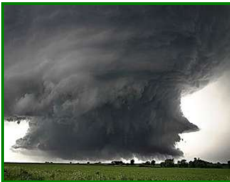
1. sz. ábra: Katrina hurrikán