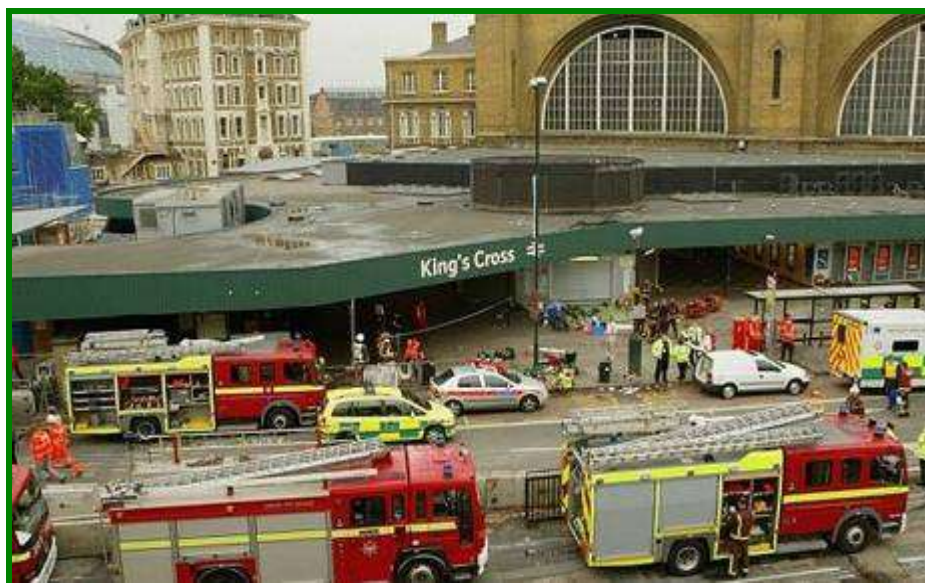
5. sz. ábra: katasztrófagyakorlat, Készítette: Dean Mouhtaropoulos, forrás: 10

Sajnálatos jelensége ezeknek a nagy katasztrófáknak, hogy a mentőerők élete is veszélyben van, a döntéshozók pedig gyakran figyelmen kívül hagyják, hogy a segítők, mentők komoly károsodásokat szenvedhetnek. Így volt ez Csernobilban is 1986-ban. A munkálatokhoz rendelt katonákat nem kímélték, minimális védőfelszereléssel érkeztek, a még meleg grafit és fűtőelem-darabokat kézzel szedték össze velük. Ők és a helikoptereken dolgozók is halálos dózist kaptak a sugárzásból. Nem kímélte ez a hazánkból segélyszállítmányokkal és eszközökkel érkező kamionosokat sem.