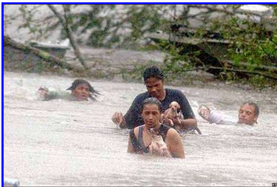
6. sz. ábra: fuldoklók az utcán, New Orleans, Forrás: 14

Voltak ugyan ingyenes iránybuszok és irányvonatok, de azok a lakosság kis százalékát tudták csak kitelepíteni a víz megérkezéséig. (lásd 7. sz. ábra)