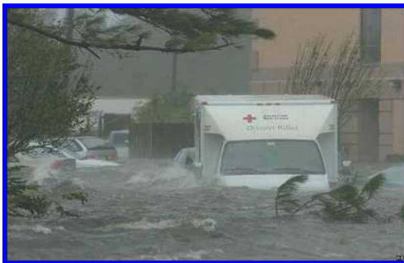
8. sz. ábra: Mentőerők a bajban, letöltés: 2005. szeptember 10. Forrás: 17

védelmére nem sok esély volt. A szervezett bűnözés gyorsan reagált, csoportokban érkeztek fosztogatók még más városból is.