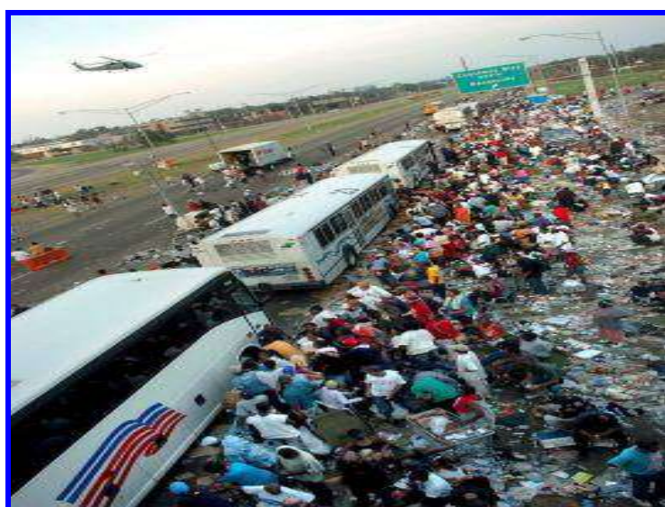
7. sz. ábra: Megkésett kitelepítés (letöltés: 2005. szeptember 10.) Forrás: 15

Voltak ugyan ingyenes iránybuszok és irányvonatok, de azok a lakosság kis százalékát tudták csak kitelepíteni a víz megérkezéséig. (lásd 7. sz. ábra)