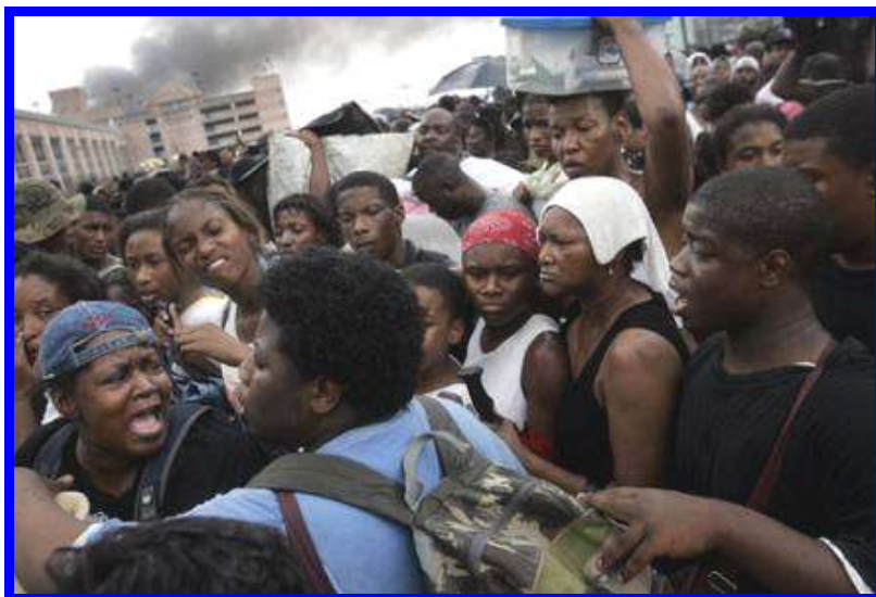
9. sz. ábra: Dallas Morning News, Michael Ainsworth: Hurricane Katrina hits New Orleans, August 29, 2005. Forrás: 18

következtében a veszély jelzésekor a lakosok nem vették tudomásul a veszély mértékét, nem menekültek el időben, és a városban rekedtek.