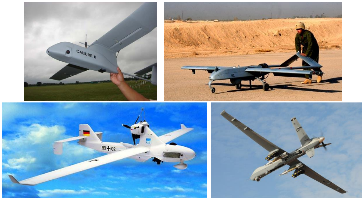
3. ábra a kis-, a rövid-, a közepes és a megnövelt hatótávolságú közepes kategóriájú UAV-k

Mint ahogy azt az előzőekben is tettem, először bemutatom ezen kategóriájú eszközöket. (3. ábra)