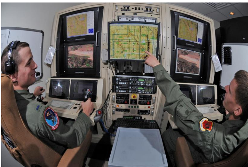
4. ábra Közepes kategóriájú UAV alkalmazására történő képzést támogató szimulátor

A fentiek alapján a képzést támogató szimulátor berendezés minimum 2 fő kezelő (irányító és szenzorkezelő) egyidejű képzését biztosítja. (4. ábra)