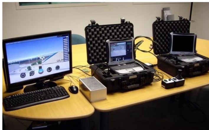
2. ábra: Nano-, micro és mini UAV-k alkalmazására történő képzést támogató szimulátor

A repüléstechnikai készségek kialakítását biztosító szimulátorok két fő egységből épülnek fel. Az egyik az a számítógép (hardver eszköz), amely a rátelepített szoftverének segítségével a szimulációs térben képes megjeleníteni az adott UAV-t, a másik pedig a számítógéphez kapcsolt UAV irányítószerve. Az irányítószerv általában nem nagy különbséget mutat azon eszközöktől, melyeket a polgári életben is alkalmaznak a modellek irányításánál. A szenzorkezelő képzést támogató szimulátor hozzá van kapcsolva az előzőekben leírt szimulátor modulhoz, hiszen önmagában a szenzorok működtetésének lehetősége nem értelmezhető (2. ábra)