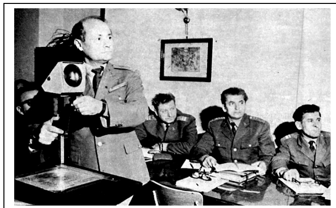
3. számú kép: Tanóra (1975.)

A budapesti „BM Rendőrképző Iskola” 1976-1980 között Csepaki Kihelyezett Tagozatán úgynevezett „gyorsított képzés” keretében négy hónapos rövidített tanfolyamokat hajtott végre. Egységes (közrendvédelmi és közlekedési) képzésben 928 fő, a budapesti iskolán szakosított (közrendvédelmi őr-járőr, valamint közlekedésrendészeti forgalomellenőrző járőr) képzésben 1475 fő vett részt. A különböző módosítások eredményeként az alapfokú rendőrképzés időtartama ismételten tíz hónap lett. Ezen belül a tanintézeti képzés időtartama 5–7 hónap között váltakozott. A fennmaradó időt a már véglegesített, de ki nem képzett rendőrök „gyakorló szolgálat” címszóval az idegenforgalmilag frekventált, illetve nagyobb létszámihiánnyal küszködő rendőri szerveknél létrehozott „gyakorló őrök”-ön teljesítették. Az országban 22 gyakorló őr működött, egyedül Budapesten nem került létrehozásra. Budapesten a különböző kerületekben teljesítettek „megerősítő” rendőri szolgálatot.