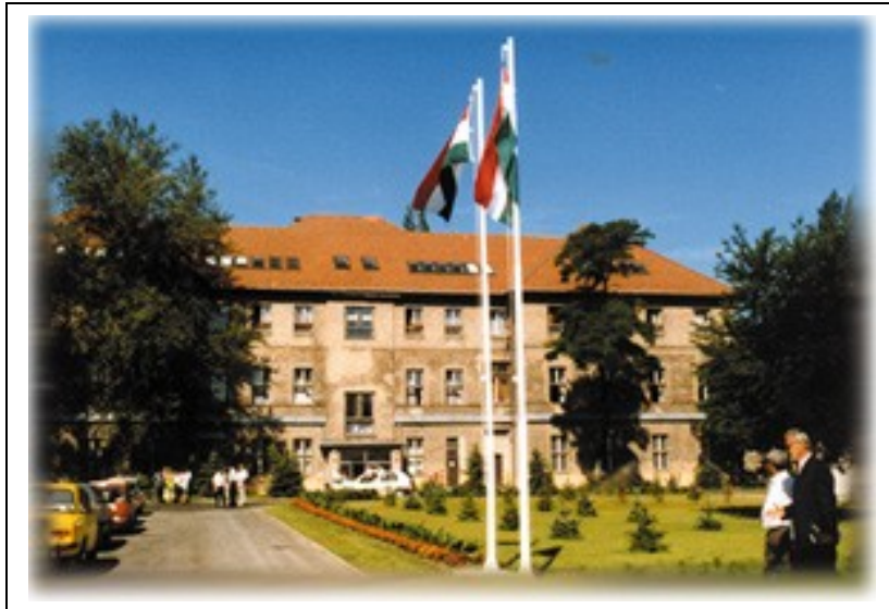
5. számú kép: A Budapesti Rendőr Szakközépiskola

1994-ben az önálló Szombathelyi Rendőrtiszthelyettes-képző Iskola és a Szegedi Rendőrtiszthelyettes-képző Iskola megszűnt. A Szombathelyi a Budapesti, a Szegedi pedig a Miskolci Rendőr Szakközépiskola tagozataként végezte tovább a rendőrképzést. Később 1996-ban a csopaki iskola, valamint a szegedi tagozat önálló szakközépiskolává alakult.