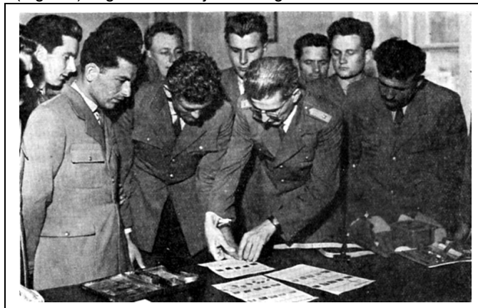
2. számú kép: Tanóra a BM Alapfokú Rendőriskolán 1966-ban