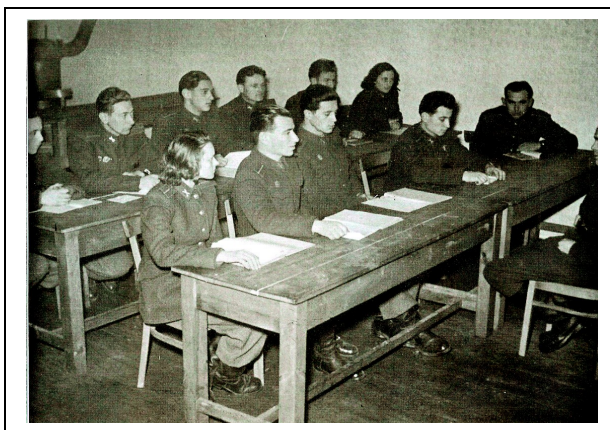
1. számú kép: Oktatás az Őrsparancsnokképző Tanosztály képzésén

Az „ Őrsparancsnokképző Tanosztály ” Budapesten a Budapesti Főkapitányság szervezetében működött, közvetlen miniszteri irányítás alatt. A tanosztály egy zászlóaljat alkotott, amely 1–5 századból állt, a kiképzés részleteit külön rendelet szabályozta.