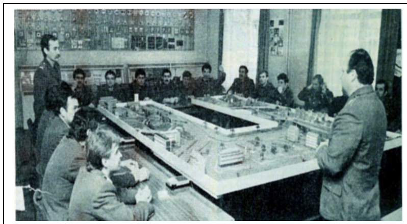
4. számú kép: Tanóra a BM Rendőrtiszthelyettes-képző Iskolán (1986.)