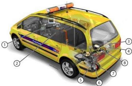
5. sz. kép A hordozó jármű [5]

Maga a rendszer egy VW SHARAN hordozó gépjárműből és a mérőrendszerből áll, mely a hordozó gépjármű módosított hátsó hídjára van telepítve.