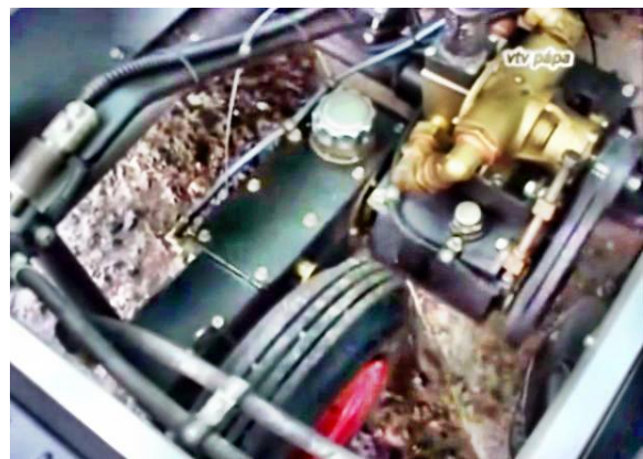
8. sz. kép A mérőkerék „mérési állás-