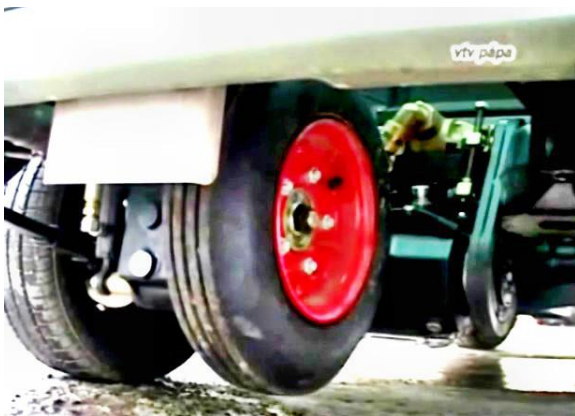
7. sz. kép A mérőkerék

A fékhatás (felületi súrlódás) mérő berendezés egy speciális mérőkerékkel rendelkezik, melynek az üzemi méréshez használt gumiabroncs anyaga, formája és futófelülete nagyon hasonló a normál légi jármű gumiabroncsaihoz. Ez olyan súrlódási adatokat produkál, melyek nagyon hasonlítanak a légi jármű gumiabroncsainál üzemkőzben tapasztalt súrlódási értékekhez.