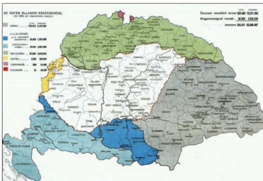
20. számú ábra: A trianoni békediktátum területi változásai 1920.

Mindezek következtében korábban prosperáló gazdasági kapcsolatok szűntek meg, évszázadok kulturális és emberi kapcsolatai szakadtak szét, melyek mind negatívan érintették a vidékbiztonságot. A korabeli magyar társadalmat valósággal sokkolta, hogy a közel ezeréves államot szétszabdalták. 326 A korszak magyar politikai elitje tehát természetes módon helyezkedett a revízió talajára, s a magyar külpolitikát ez hatotta át.