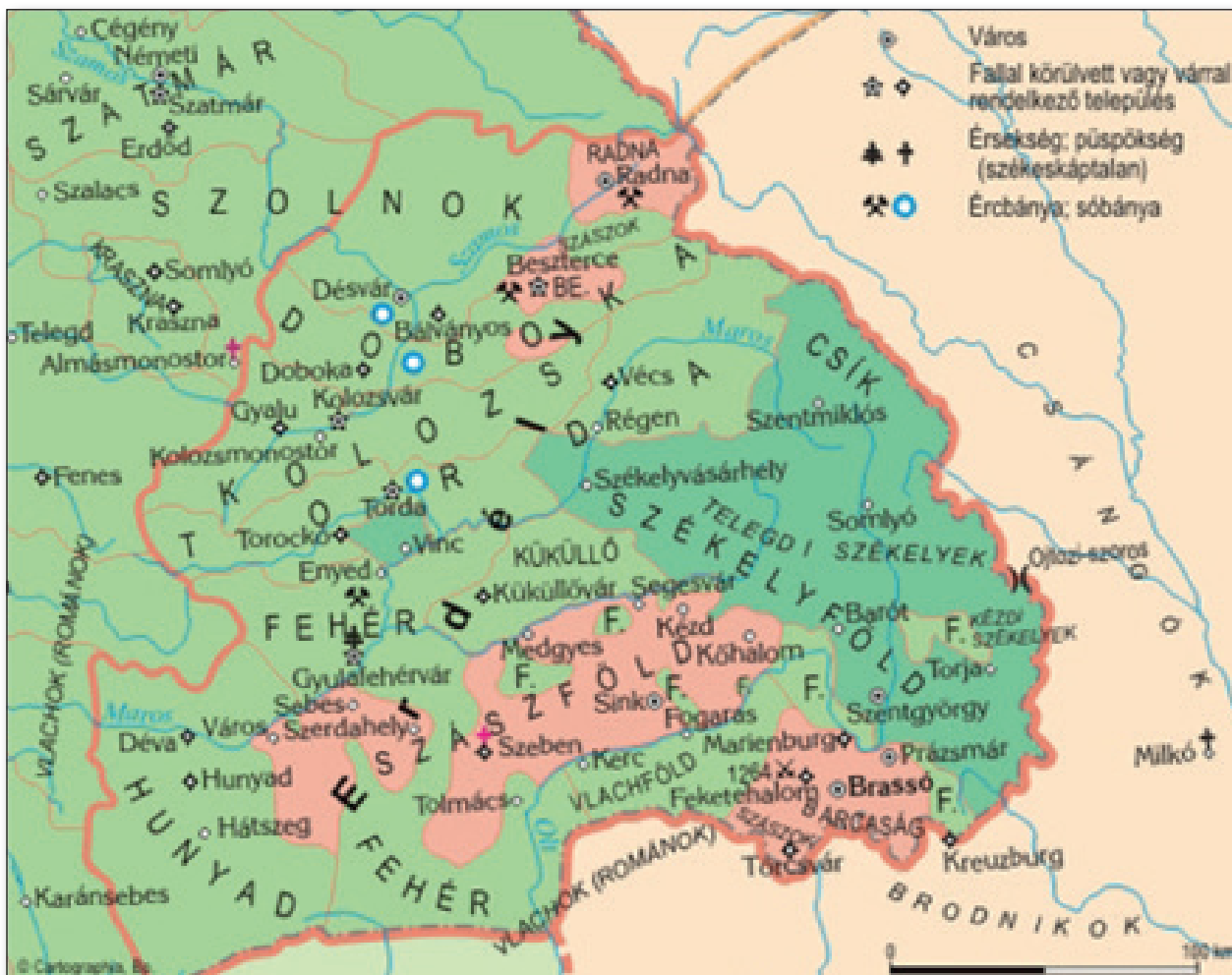
12. számú ábra: Erdély területe a XIII. században.