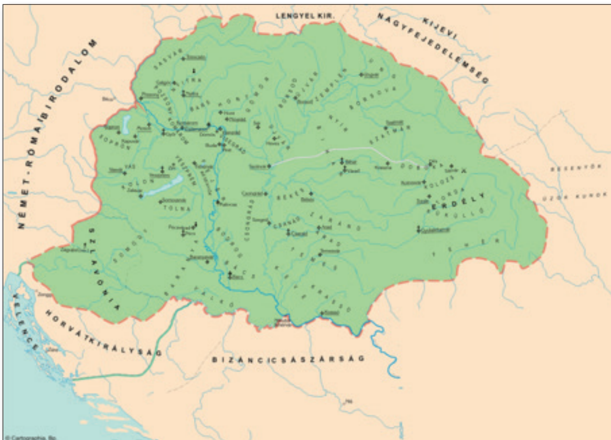
11. számú ábra: A Magyar Királyság a XIII. sz. elején.

A Szent Istváni alapokon berendezkedő feudális magyar állam a XIII. századra már túl volt a régi rendet visszaállítani akarók és a trónt megszerezni kívánók által okozott belső válságokon, valamint több nagyhatalmi befolyásolási, terjeszkedési kísérletet is sikeresen elhárított. Az államalapítástól a tatárjárásig terjedő időszak háborúiban a magyar haderő helytállt ellenfeleivel szemben, s ennek köszönhetően nemcsak a haza védelmét, az ország külső és belső biztonságát biztosította, hanem a magyar királyok hódító politikájának (elsősorban a Balkán-félsziget irányába) is ütőképes eszköze lehetett. Ekkor azonban szembekerült egy keleti nomád nép támadásával, mely majdnem pusztulását eredményezte.