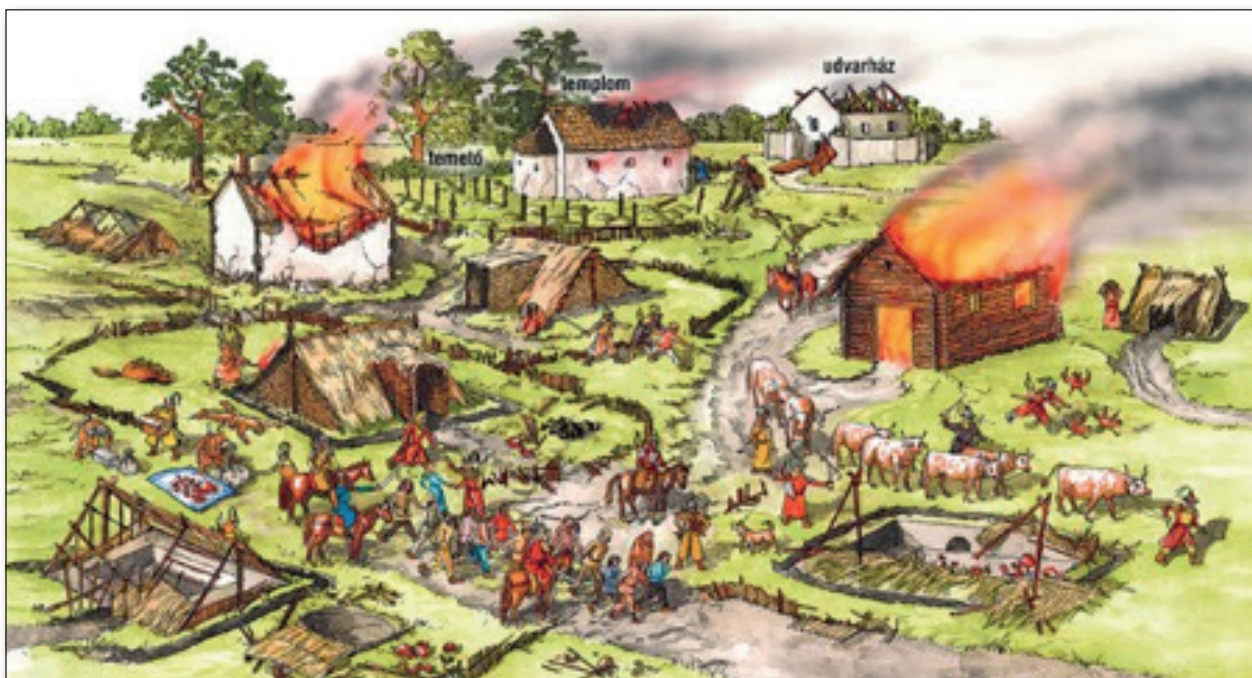
14. számú ábra: A tatárjárás hatásai vidéken.

„Én pedig bujdosóként, mindenkinek a segítségétől cserbenhagyva, koldulgattam az erdőben, és az, akinek én korábban nagy adományokat adtam, még alamizsnát is alig nyújtott, úgyhogy amikor az éhség és a szomjúság kényszere már nagyon gyötört, éjszaka kénytelen voltam bemenni a szigetre és a holttesteket forgatni, hogy elásott lisztet, vagy húst, vagy más ehető dolgot találjak táplálásomra. És amit csak találtam éjjel, azt jó messze bevittem az erdőbe. [...] Tíz vagy húsz nap múlva megint bementem a szigetre, és a holttesteket emelgettem. [...] Üreget kellett keresnem, vermeket ásnom, odvas fákat felkutatnom, hogy valahol meghúzhassam magamat, míg a tatárok, mint a nyulakat és vaddisznókat nyomon követő kutyák, átfutkosták a túskebokrok sűrűjét, az árnyékos berkeket, a vizeknek mélységét és a puszták belsejét.” 217 Rogerius fenti sorokkal teljes egészében mikroszintre viszi le egy, a társadalom teljes összeomlása következtében közösség nélkül maradt menekülő mindennapjainak leírását. Rogerius kísérlete, hogy biztosítsa életben maradása minimális feltételeit, egyetemes, korokon átívelő módszereket mutat be, amelyek minden hasonló kataklizma után megfigyelhetők.