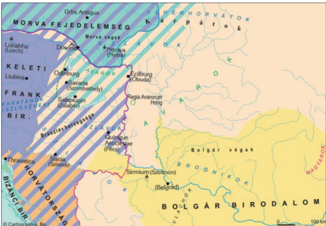
9. számú ábra: A Kárpát-medence a magyar honfoglalás előtt.

A magyarság Etelkőzből kiindulva – a nomád „hagyományoknak” megfelelően – folyamatosan indított portyázó hadjáratokat Közép- és Délkelet-Európába, hiszen az európai hatalmak szívesen használták fel fegyveres erejüket az egymás elleni fegyveres konfliktusokban. A korabeli források alapján valószínűsíthető, hogy 881-ben a morvák szövetségeseként jelentek meg először a Duna völgyében, de csak a 890-es években jelentek meg aktívan a térség hatalmi harcaiban. A IX. sz. végén a Kárpát-medence három birodalom határterülete volt. A Dunántúl a Keleti Frank Birodalomhoz tartozott, a Felvidék egy része a Morva Fejedelemséghez, Erdély déli fele és a Dél-Alföld pedig a Bolgár Cársághoz. 141