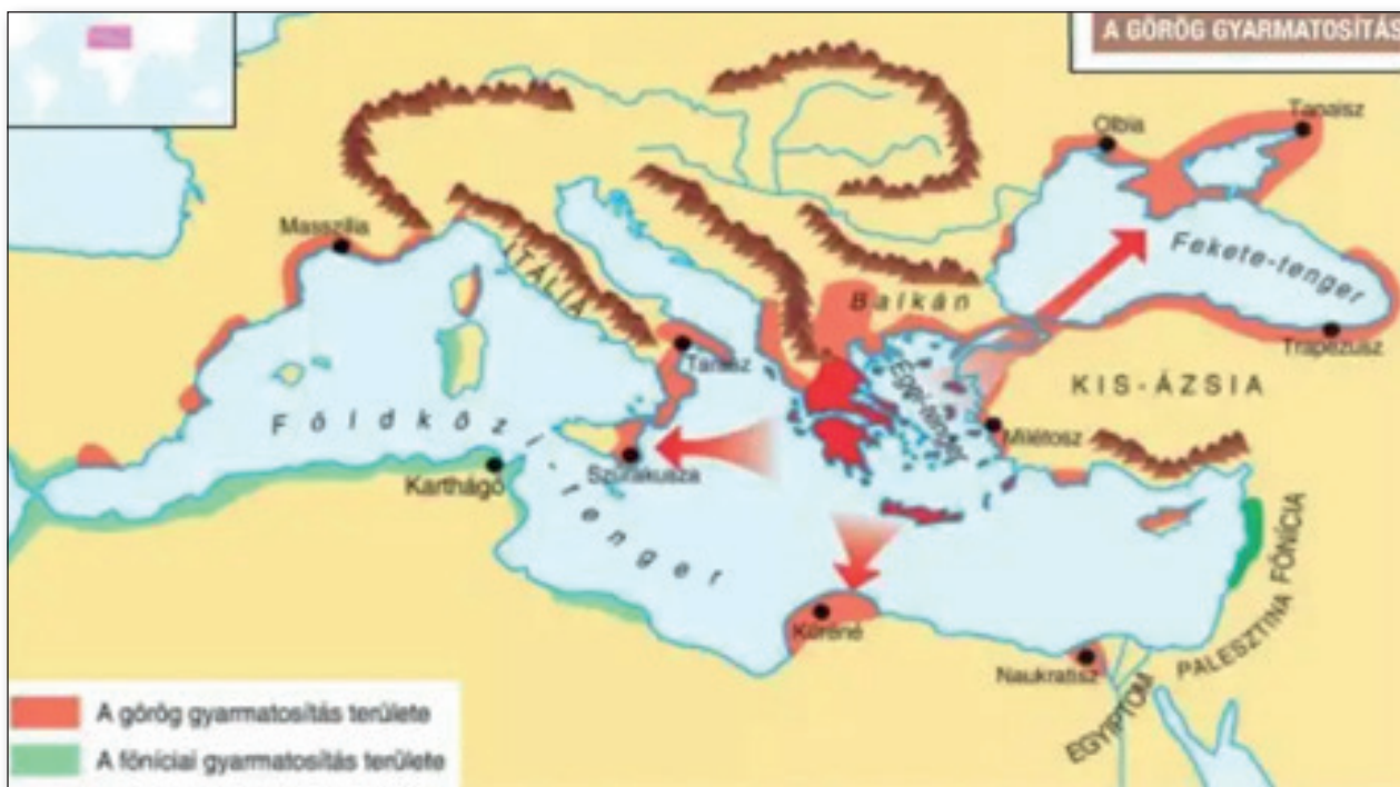
3. számú ábra: A föníciai és görög gyarmatosítás által érintett területek az ókorban.