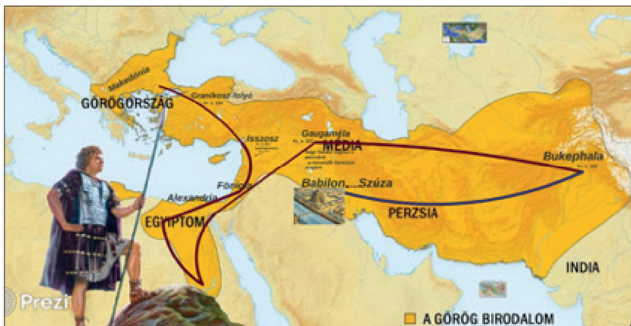
4. számú ábra: Nagy Sándor birodalma.

alattvalóinak etnikai-kulturális egybeolvasztása. 65 Maga Nagy Sándor rövid uralkodása alatt mintegy hetven várost alapított (ezek nagy részét önmagáról nevezve el), mert felismerte jelentőségüket. Halála után a folyamat tovább zajlott, kisebb-nagyobb eredményekkel.