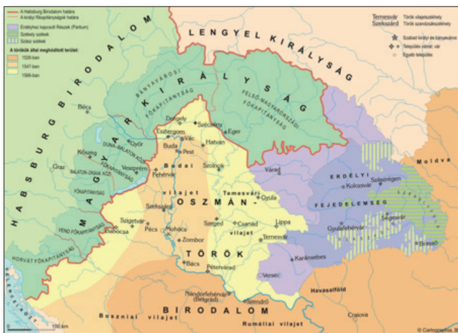
18. számú ábra: A három részre szakadt Magyarország (1526-1699).

Tehát a középkori magyar állam bukását követően a korábbi Magyar Királyság területén három állam osztozott: a Török Birodalom , a Habsburg Birodalom részét képező Magyar Királyság , illetve a török vazallusállam Erdélyi Fejedelemség . E három államalakulat a következő közel másfél évszázadban sorozatos háborúkba és fegyveres összecsapásokba bonyolódott egymással, amelynek következményeként a korábbi politikai, katonai, gazdasági és társadalmi stabilitás – így a vidékbiztonság is – teljesen felborult, ráadásul a helyzetet súlyosbította az európai modelltől teljesen eltérő török berendezkedés meghonosodása a korábbi Magyarország központi területein. 290