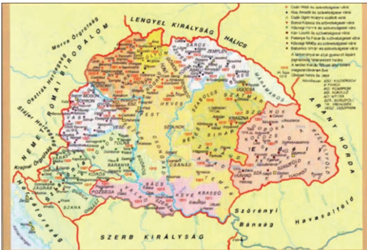
17. számú ábra: A tartományurasságok leverése (1310-1323).

(forrás: http://www.sulinet.hu/oroksegtar/data/telepulesek_ertekei/visegrad/visegrad_ezer_eve_almanach/pages/visegrad_18_03.htm ; A letöltés dátuma: 2018. 04. 30.)