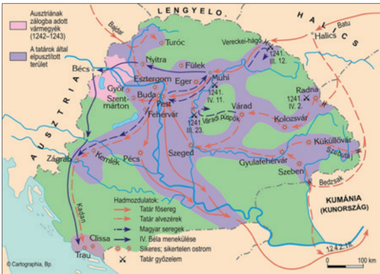
13. számú ábra: A tatárjárás a Magyar Királyság területén 1241-1242.

„Mi pedig, akik az erdőkben a gyepük között tartózkodtunk, éjjel futásnak eredtünk Tamáshida, a németek nagy városa felé, amely a Körös mellett fekszik. 208 De a németek semmiképp sem engedtek bennünket átmenni a hídon, sőt a legtöbbben arra ösztönöztek, hogy velük együtt védelmezzük jól megerősített városukat. Ez nagyon nem tetszett nekünk. 209 Itt egy újabb momentumát láthatjuk a vidéki lakosok védekezésének: a lakosság egy része végig az erdőkben vagy a lakatlan helyeken bujkált a támadók elől, és csak éjjel mozgott, hogy nehezebb legyen felderíteni őket. Igyekeztek megtalál- ni az ellenség által még érintetlen területeket, ahol ellátásra és fizikai védelemre lelhetek. Érdekes megfigyelni, hogy Rogerius és társai Tamáshida szász lakóival ellentétben nem bíztak a város sikeres védelmében, amelyben szerepet játszott, hogy látták Nagyvárad – jóval komolyabban megerősített – városának és főként várának pusztulását.