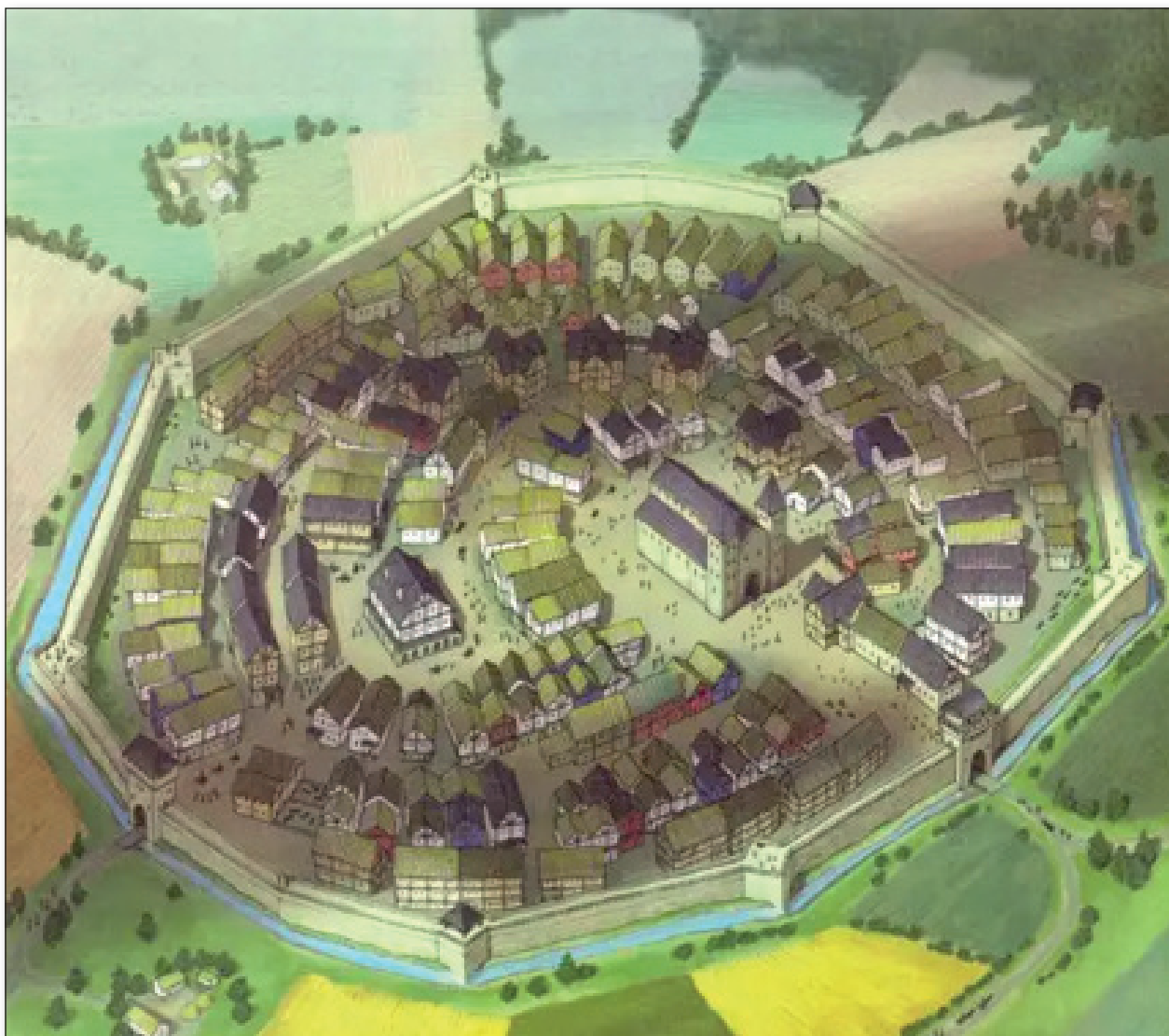
6. számú ábra: A középkori város.