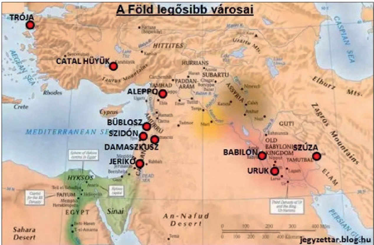
1. számú ábra: A föld legősibb városai

A városok megteremtették saját identitásukat, elkülönítve magukat a vidéktől, többnyire pozitív jelentéstartammal a vidék rovására. Hogy a városok életben maradása szempontjából ez mennyire fontos jelentőséggel bír, azt mutatja a városok történelmének tanulmányozása során levonható következtetés: erkölcsi kohézió vagy saját polgári identitás nélkül még a gazdag, prosperáló városok is dekadenciára és hanyatlásra vannak ítélve. 15