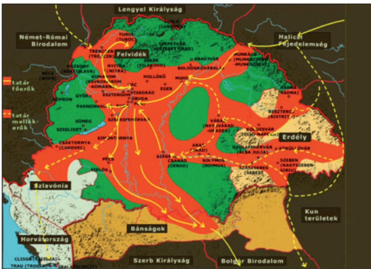
15. számú ábra: A tatárjárás a Magyar Királyság területén 1241-1242.

(forrás: https://www.hirmagazin.eu/a-tatarjaras-dramai-reszletei-tarulnak-fel/ ; A letöltés dátuma: 2018. 04. 30.)