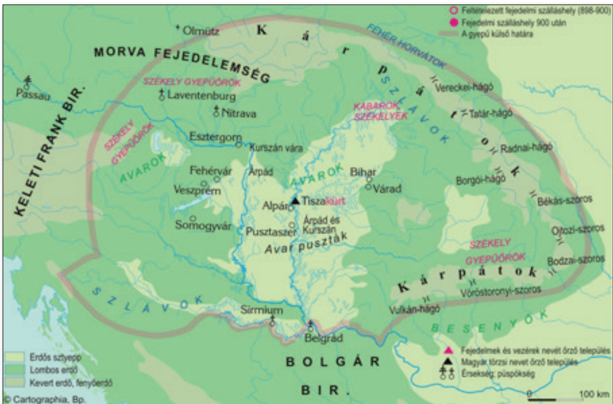
10. számú ábra: Honfoglalás és letelepedés a Kárpát-medencében.

túl északi és keleti sávjának dombvidékeit szállta meg, míg a többség a síkvidéki területeket, a Kárpát-medence centrum területeit. Nem volt viszont magyar szállásterület a Dunántúl nagyobbik része (a Mezőföldet kivéve), a Felvidék északi része, és Erdély nagy része sem, hiszen a hegyes-dombos vidékek nem voltak megfelelőek a magyarság nomád nagyállattartó életmódjának. A szállásterület azonban nem esett egybe a fennhatósági területtel. A külső támadásokkal szembeni védelemül, a politikai és katonai biztonság megteremtése érdekében – a nomád szokásoknak megfelelően – gyeput hoztak létre. 152