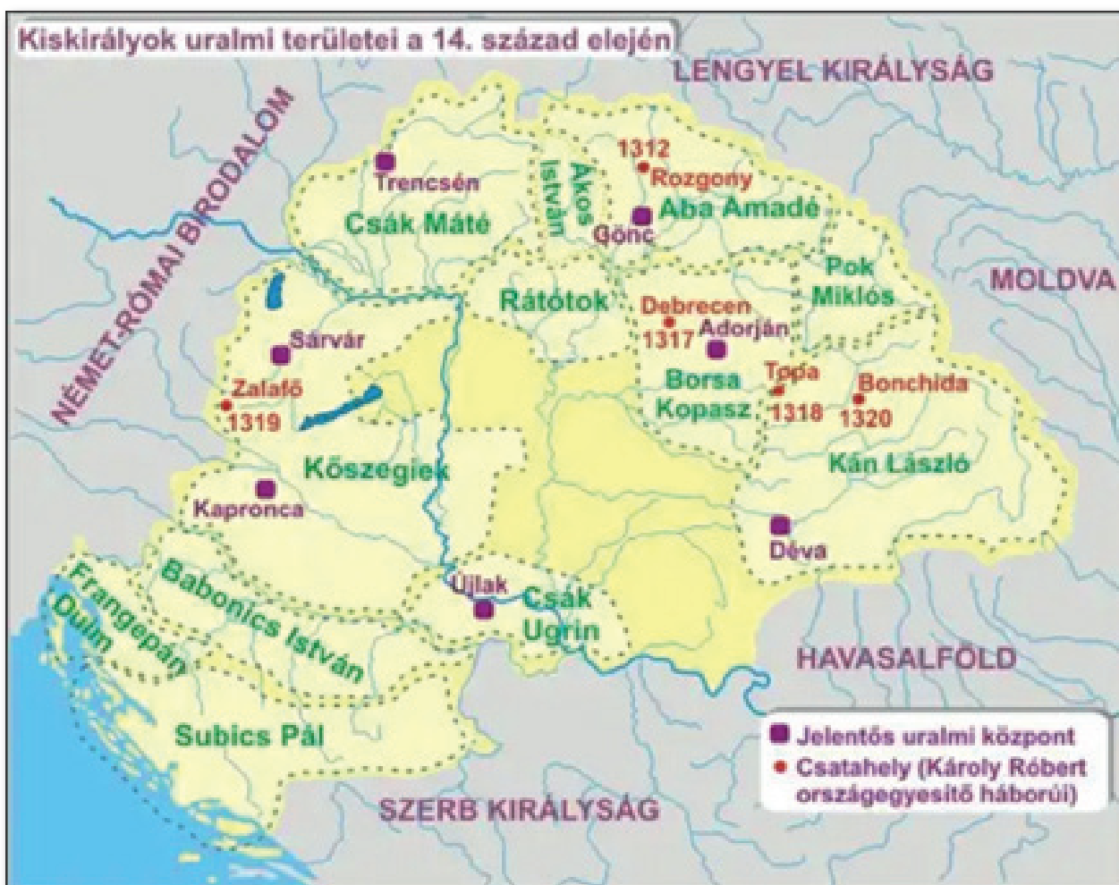
16. számú ábra: A „kiskirályok” uralmi területei a XIV. sz. elején.