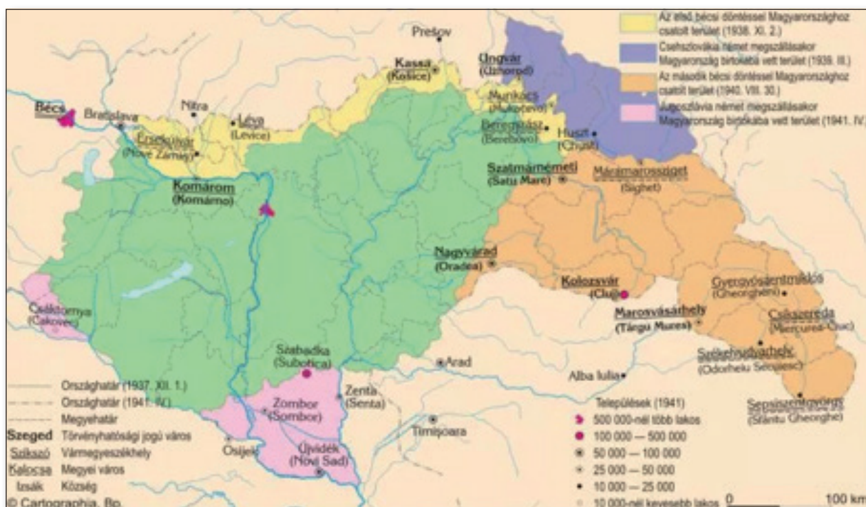
21. számú ábra: Magyar területi revízió 1939-1941 között.

A második világháború kitörését követően, Franciaország kapitulációja után, 1940 júniusában a szovjet kormány ultimátumban követelte Romániától Besszarábia és Észak-Bukovina átadását, majd elfoglalta e területeket és a Szovjetunióhoz csatolta. Mindez lehetőséget kínált Magyarországnak is, hogy önerejéből valósítsa meg Erdély és Kelet-Magyarország visszacsatolását. Megkezdődtek a magyar katonai előkészületek, közel félmillió haderőt vonva össze a Tiszántúlon. A német vezetés – melynek a térség nyugalma volt az érdeke – kétoldalú magyar-román tárgyalásokat javasolt. Ez elől a magyar kormány nem térhetett ki. A tárgyalások viszont eredménytelenül végződtek, mire a románok Németországot és Olaszországot kérték fel döntőbíróknak. Ezzel megghiúsult Erdély önerőből való visszaszerzésének terve, s ismét a tengelyhatalmak döntőbírárságára került sor. Az 1940. augusztus 30-ai második bécsi döntéssel Magyarország 43.492 km 2 területet kapott vissza, benne a Székelyfölddel. Az 1941. évi népszámlálás adatai szerint a visszacsatolt Észak-Erdélyben 2.460.000 fő élt, melyből 54,6% magyar, 43,5% román, és 1,9% német volt. Dél-Erdélyben körülbelül 400.000 magyar maradt. Magyarország a második bécsi döntés következményeként 1940. november 20-án csatlakozott a háromhatalmi egyezményhez, mellyel tovább mélyítette a németbarát külpolitikai kényszerpályáját. 327