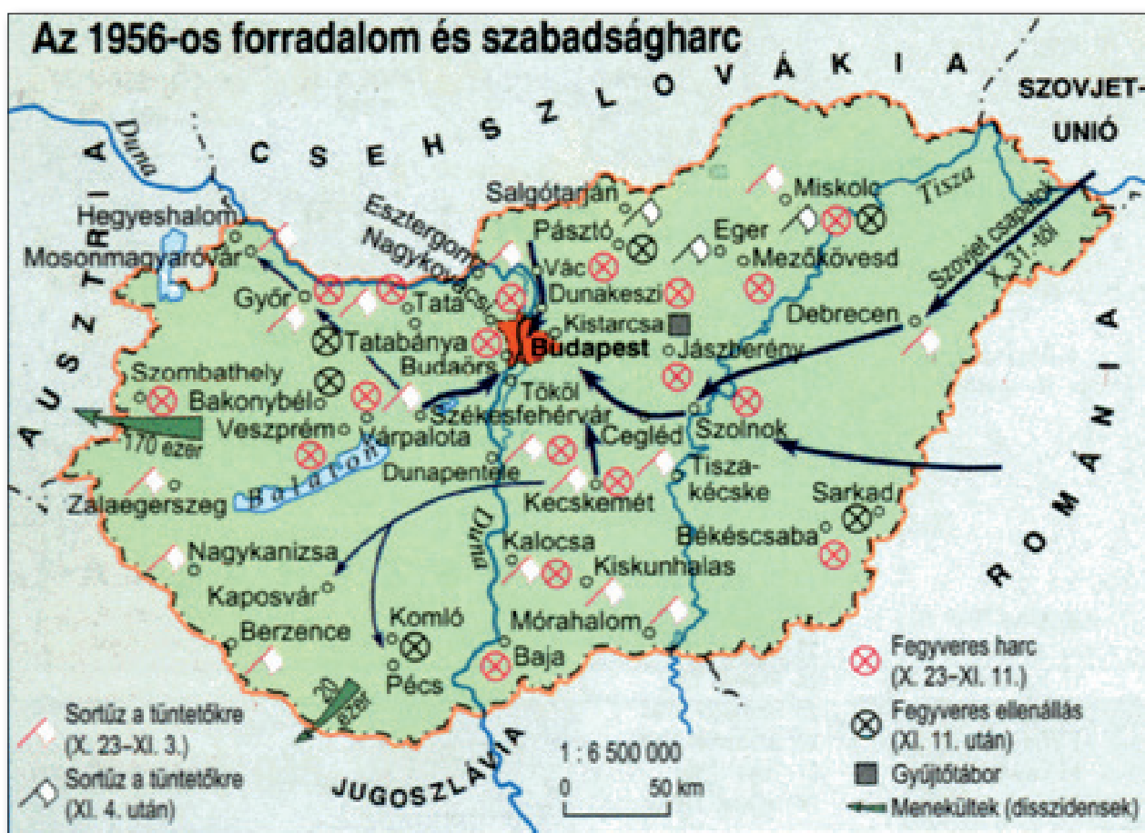
19. számú ábra: Az 1956-os forradalom és szabadságharc.

Vidéken nemzetőrséget a települések fele (51%-a, 1678 település) hozott létre. Döntő többségük október 25. és november 1. között alakult, s közülük a legtöbbet forradalmi szervezetek hozták létre vagy voltak ellenőrzésük alá. A parancsnoki állomány döntő többsége civilekből állt, de találunk közöttük rendőrt, katonát, határőrt és tüzoltót is. A nemzetőrségek alig több mint fele (54%) teljesített fegyverrel szolgálatot, de többségük kizárólag a szolgálat ideje alatt viselt fegyvert. Mintegy 80 településen csak éjszakai őrséget állítottak fel. 320