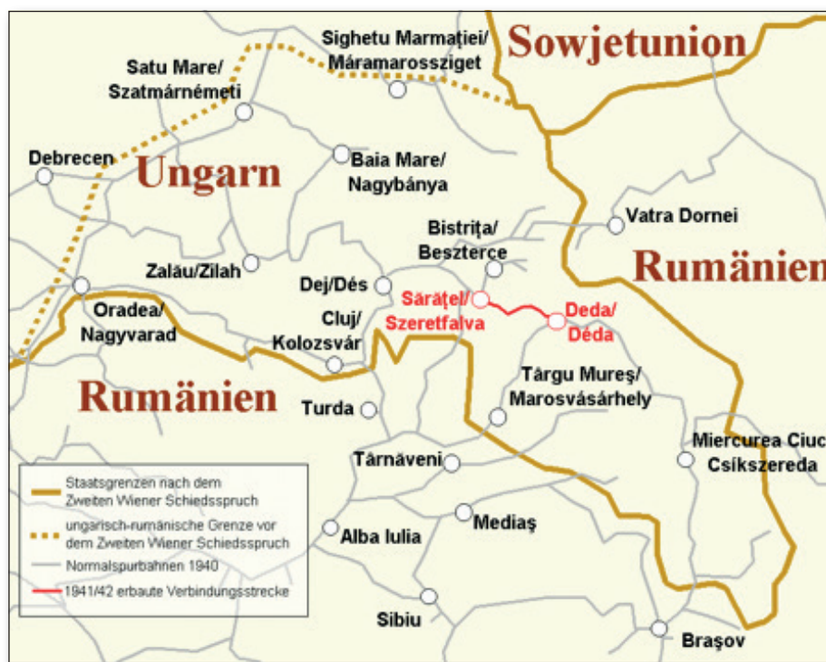
22. számú ábra: A Szeretfalva-Déda vasútvonal 1941-1944.

(forrás: https://hu.wikipedia.org/wiki/Szeretfalva%E2%80%93D%C3%A9da-vas%C3%BAtvonal ;