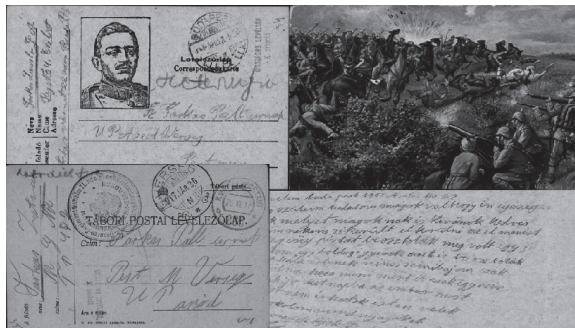
2. ábra • Tábori levelezőlapok

A dokumentumokat a hadbavonultak által szüleiknek küldött tábori levelezőlapok gazdagítják megrázó, hogylétükről és bajtársaik miatti aggodásról szóló személyes üzenetekkel. 16