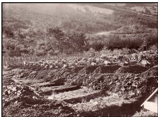
A nagy veszteségek miatt előre megásott sírok Devetakiban