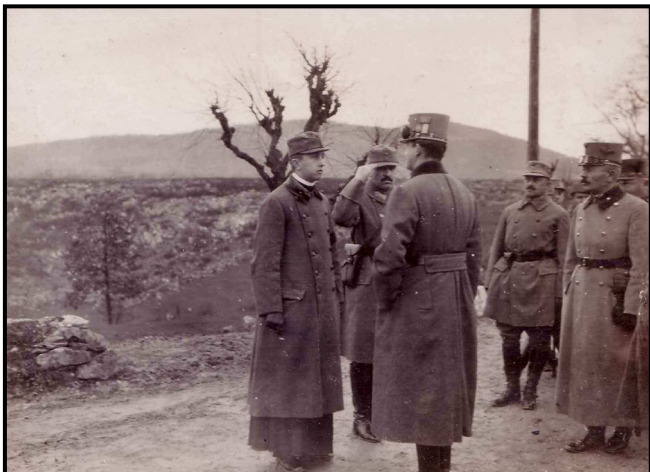
Kun páter, a székesfehérvári 17-es honvéd gyalogezred lelkésze