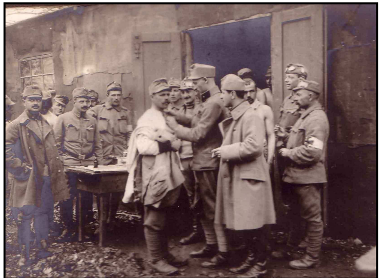
Katonák védőoltást kapnak a járványok ellen