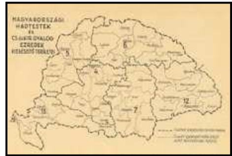
A honvéd és a közös gyalogezredek hadkiegészítésének ábrázolása térképen