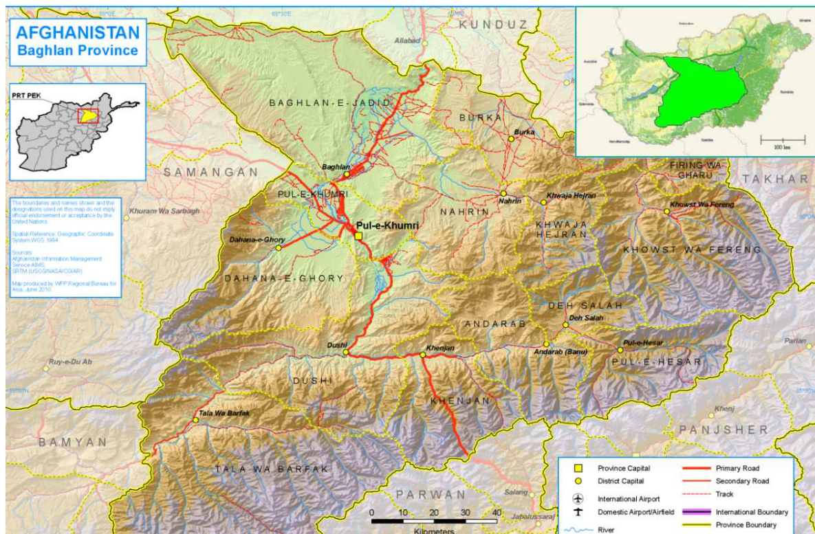
2. ábra: A magyar felelősségi terület

(Szerkesztette: Bokros Tünde Ibolya a World Food Programme térképe alapján)