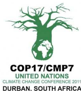
3. ábra: A Durban-i csúcstalálkozó reklámszimbóluma