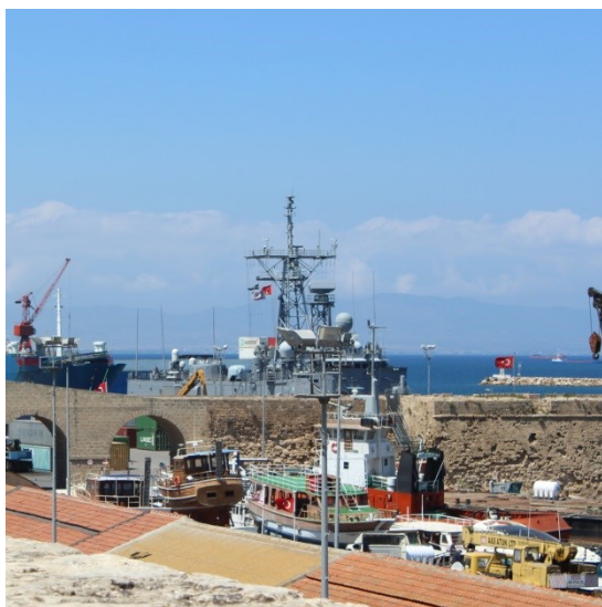
Török hadihajó Famagustában

Visszatérve a szigeten létesülő új katonai bázisok kérdésére, Oroszország véghezvitte 2015-ben a katonai támaszpontok előfutáraként kötött szerződéskötéssel azt, ami előtte elképzelhetetlen volt, és pedig a kommunista múlttal és kötődéssel rendelkező Christofias után a 2013-ban megválasztott jobboldali Nicos Anastasiades cirusi elnökkel (aki korábban rosszalta Christofias baloldali bekötését az oroszokhoz) szentesítették a megállapodást Moszkvában. A ciprusi politikai belviszonyokat ismerve ez 2008-ban Anastasiadestől még elképzelhetetlen lett volna, annak ellenére, hogy az ortodoxia összeköti Oroszországot Ciprussal, sőt Görögországgal is. Utóbbi kapcsolatot nem szabad fogymen kívül hagyni, és itt emlékeztetnék a 2015-ben kicsúcsosodó görög gazdasági krízisre, amikor Alexis Tsipras görög miniszterelnök Vladimir Putin orosz elnök szövetségét kereste moszkvai látogatása alkalmával, hogy kipuhatholja Oroszország szövetségének valóságát a jövőre nézve, nem kis borsot törve az Európai Unió orra alá, hiszen az orosz-ukrán konfliktus és a Krím bekebelezése miatt komoly szankciókkal sújtott „agresszor” Oroszország egy kitörési lehetőséget kaphatott elszigeteltségéből a nemzetközi politikai porondon. 14