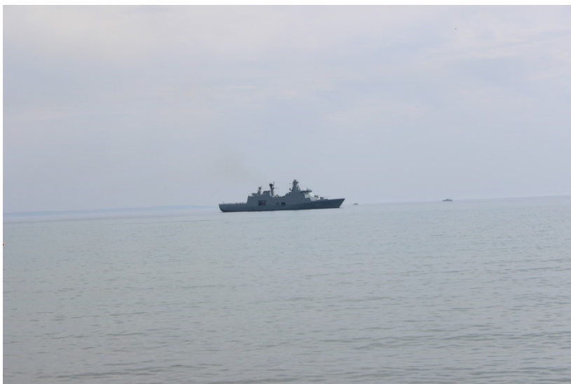
Görög hadihajó Larnaca partjainál (saját felvétel – 2014)

Mielőtt folytatnám, kitérek egy igen fontos eseménysorozatra. A 2011-ben kirobbant Arab Tavasz elnevezés alatt egy, az észak-afrikai és a Közel-Kelet kikiáltott diktátorainak és rezsimeiknek elsöprését célzó forradalmi hullám hátterében igenis komoly hírszerzési munka folyhatott, amikor Assad a megdöntésére irányuló hírek nyilvánosságra kerülése előtt Iránból fegyvereket és lőszereket próbált beszerezni. Történt ugyanis, hogy egy ciprusi hajó zászlaja alatt a Földközi-tengeren lefűelt fegyverszállítmányt az ENSZ fegyverbargójára hivatkozva (amerikai nyomásra) bevontattak a sziget déli részén található (Evangelos Florakis Naval Base) katonai kikötőbe még 2009-ben. Ezt a szállítmányt nem semmisítették meg, de az ENSZ fegyverellenőreinek sem engedték átvizsgálni, míg végül a szíriai események eszkalálódása körül, pontosabban 2011. július 11-én megsemmisült, valahogy felrobbant, és a robbanás ereje eltakarította a 150 méterre lévő Vassilikos erőművet is a föld felszínéről, hatalmas gazdasági hátrányt és időleges áramkimaradást okozva a Ciprusi Köztársaságnak. Feltáró vizsgálat indult, és az akkori ciprusi elnök Demetris Christofias több támadás keresztüzébe került, mert neki tulajdonítják az említett rakomány sorsa körüli időhúzás miatt bekövetkezett katasztrófát, ami nem mellesleg legalább tizenhárom ember halálát okozta.