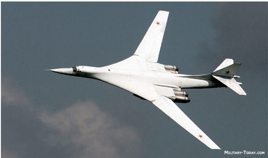
1.sz. kép: Tu-160

Bizonyára másképpen alakultak volna a függetlenségét nem oly régen elnyerő állam területi épségét befolyásoló dolgok, ha az még mindig rendelkezik atomfegyverrel. A világ és Európa szerencséjére, hogy ma nem kell tartanunk atomháborútól, de Ukrajna valószínűleg úgy véli, hogy ez olyan elrettentő erő lenne a kezében, ami garantálta volna az ország szuverenitását, területi épségét. A taktikai atomtölteteket egyébként még 1992-ben átszállították Oroszországba, két évvel a megállapodás aláírása előtt, a TU-160 típusú stratégiai bombázókból pedig 1999-ben gáztartozás ellentételezéseként 8 db-ot átadtak Oroszországnak, a többi haditechnikai eszközt az évek alatt darabolták fel, vagy más módon semmisítették meg.