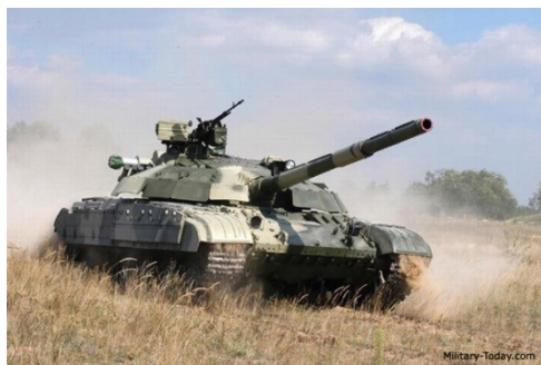
2-3. sz. kép: A szovjet gyártmányú T-64 (balra) és az ukrán hadiipari mérnökök által továbbfejlesztett T-64 modernizált változata Bulat (jobbra)