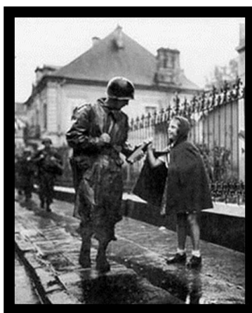
1. sz. kép: A „Pezsgős Kampány”

This study is a short summary of the Allied invasion of Southern France between 15. August 1944 and September 14. The operation's early name was Anvil until 24 June 1944 when the action was renamed to Dragoon. It was one of the most complex amphibious and airborne military operation in World War II but it was overshadowed by the earlier and larger Operation Overlord.