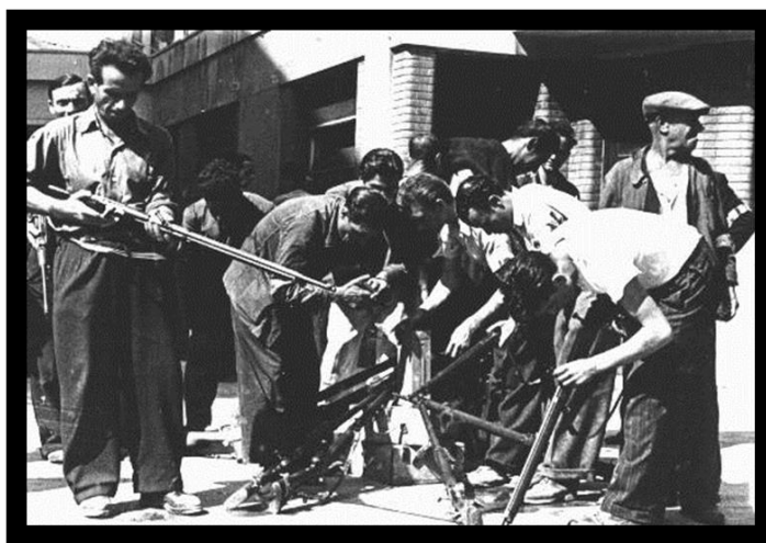
2. sz. kép: Marseilles-i felkelők gyűjtik fegyvereiket

elég ereje volt ahhoz, hogy egyszerre támadja meg a két várost: Toulont két gyalogos hadosztállal, Marseille-t pedig egygel, amiket harckocsikkal és különleges alakulatokkal erősített meg. 68 A német védelem Toulonban 18.000, 69 Marseille-ben 13.000 katonából állt, 70 de a műszaki akadályok a szárazföld felől kevésbé voltak kiépítve. 71 Végül 28-ára mindkét várost sikerült elfoglalni súlyos harcok árán. A német védők végül a Führer parancsa ellenére kapituláltak. A franciák Toulonban 2.700, Marseille-ben 1.800 embert vesztek, míg német oldalról összesen 28.000 ember adta meg magát. 72