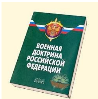
4.sz. ábra. Az Oroszországi Föderáció Katonai Doktrínája 16

Az új Nemzeti Biztonsági Stratégia megteremti az elméleti alapokat az új orosz Katonai Doktrína megírásához.