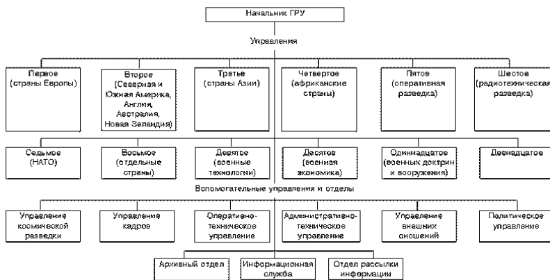
9.sz. ábra. A GRU szervezeti felépítése 28