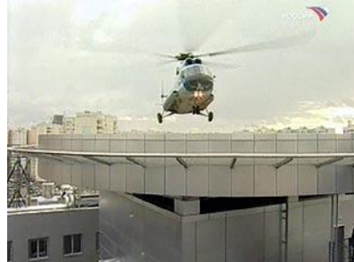
8.sz. ábra. A GRU új székhelye 27

Ez az egyedüli biztonsági szolgálat, amelynek nincsen közvetlen kapcsolata a sajtóval. A főcsoportfőnökség közvetlenül a vezérkari főnöknek, illetve a miniszternek van alárendelve. A szolgálat vezetője egyben a vezérkari főnök helyettese is. A főcsoportfőnöknek nincs meghatározott, állandó fix időpontja az elnöknek történő közvetlen jelentésre. Ezzel szemben a Külső Hírszerző Szolgálat (SZVR) vezetője minden hétfőn tesz jelentést az elnöknek. Szakértők szerint ez azzal magyarázható, hogy a katonai felderítés inkább a fegyveres erők számára szerez információt. Ezek az adatok és elemzések annyira konkrétak és részletekbe menőek, hogy az elnöknek nincsen szüksége ilyen mélységű tájékoztatásra. Azonban adott esetekben az elnök, mint legfelsőbb főparancsnok bármikor kérhet konkrét információkat és elemzéseket a katonai felderítéstől.