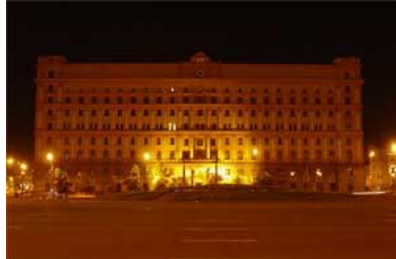
5.sz. ábra: Az FSZB Címere és a Ljubljánkai Központja 23

Az FSZB az egész ország területére kiterjedő szervezeti struktúrával rendelkezik. Ugyanakkor egy igen erősen centralizált vezetési rendszert foglal magában. Ez azt jelenti, hogy minden tevékenységet – régi szovjet módon – központilag rendelnek el és központi ellenőrzés mellett vezetnek le.