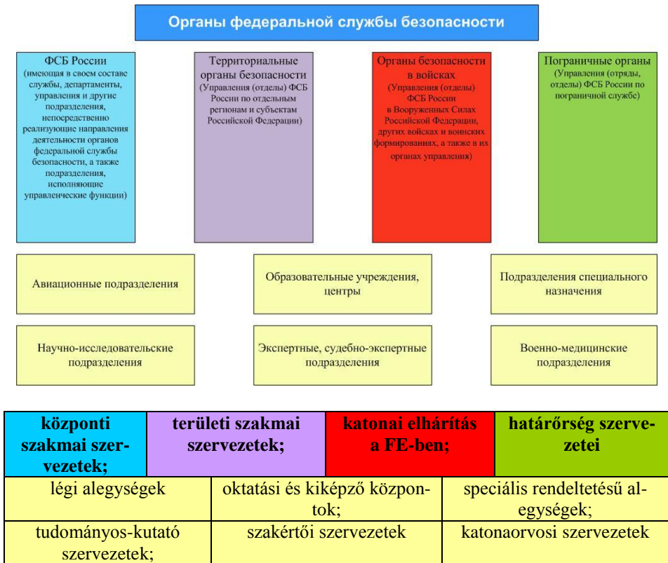
6.sz. ábra. Az FSZB szervezeti felépítése 24

Az FSZB fő szervezeti egységei, objektumai: