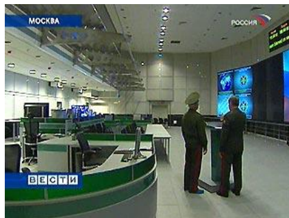
10.sz. ábra: A GRU új székhelye 30