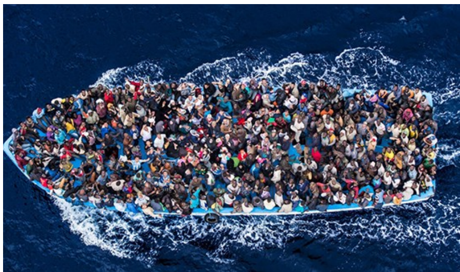
3. sz. kép: Menekültek a Földközi tengeren 18

Európa országai között különbség van abban a tekintetben, hogy egy bizonyos ország „belépési országgént” (például Görögország, Magyarország, Olaszország), vagy tranzit-országgént (például Macedónia, Szerbia, és részben Magyarország is), illetve célországként (például Németország, Nagy-Britannia) szerepel. Mindhárom kategória országainak más-más nehézségekkel kell megküzdeniük.