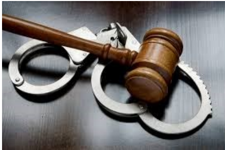
1. számú ábra 4

c) más állam alkotmányos, társadalmi vagy gazdasági rendjét megváltoztassa vagy megzavarja, illetve nemzetközi szervezet működését megzavarja,