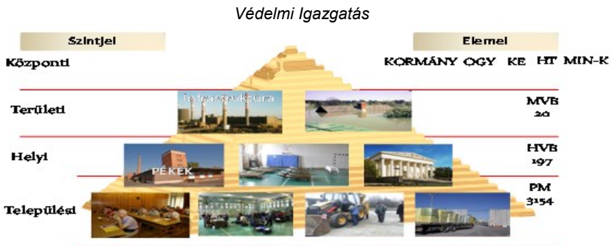
2. számú ábra: A Védelmi Igazgatás piramisa 7

A védelmi igazgatás a háborúban, katasztrófák estén vagy más rendkívüli helyzetekben (időszakokban) az állam és a közigazgatás működését irányító hierarchikus felépítésű közigazgatási szervezet. Ha a védelmi igazgatást az ország teljes védelme, azaz a honvédelem rendszere oldaláról vizsgáljuk, akkor fogalma a következőképpen határozható meg: „A védelmi igazgatás az ország civil rendszerének meghatározó eleme, az ország védelmi felkészítését irányító, szervező, koordináló kormányzati-közigazgatási rendszer.” 6