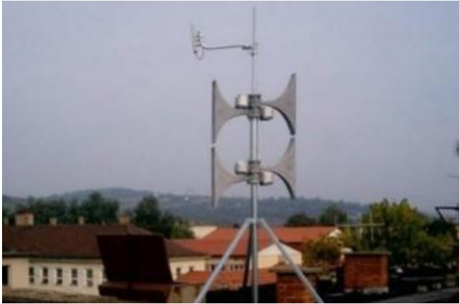
4. számú ábra: Lakossági riasztó és tájékoztató rendszer 10

Hivatali kötelezettségén alapul, hogy a települési preventív szervezet létrehozása és megalkotása során szakmai javaslatokkal segíti a polgármester döntéseit: a települési veszélyelhárítási tervben foglaltakat pedig megvizsgálja. Az adatok ismeretében összeállítja a védekezéshez szükséges preventív szervezet struktúráját, annak megismerése után javaslatot tesz a szervezetbe beosztható (beleértve a vezetőket is), polgári védelmi kötelezettség alá eső állampolgárok személyére. Megvizsgálja a logisztikai szükségleteket és kezdeményezi a szükséges beszerzéseket, a gazdasági- anyagi szolgáltatásokra vonatkozó döntéseket. Részt vesz a preventív kötelezettség alatt álló állampolgárok köteles polgári védelmi szervezetbe történő beosztásában, a szervezetek kiképzéseinek és gyakorlatainak előkészítésében és lebonyolításában is, tehát végzi a kötelezett személyek nyilvántartását, melyet naprakészen tart. Döntésre előkészíti a köteles polgári védelmi szervezetbe való beosztásra, gyakorlatra és szolgálat-teljesítésre vonatkozó határozatokat, előkészíti ezen szervezetek megalakításának dokumentációját, szervezi a polgári védelmi szervezetek gyakorlatait, a riasztást és mozgósítást, elkészíti ezek dokumentációját.