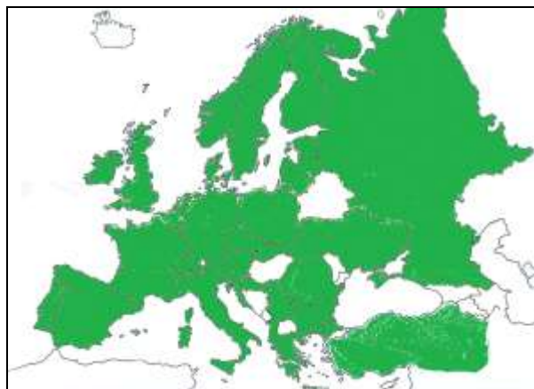
1. számú térképvázlat (Szerkesztette: Dr. Vida Csaba)