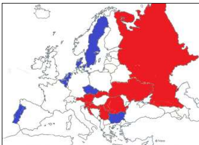
2. számú térképvázlat (Szerkesztette: Dr. Vida Csaba)

A főbb európai és az Amerikai Egyesült Államok nemzetbiztonsági szolgálatait érintő szélesebb vizsgálat mellett meg kell vizsgálni Magyarország nemzetbiztonsága szempontjából releváns országokban működő nemzetbiztonsági rendszereket is, hogy még pontosabb következtetéseket tudjunk levonni a nemzetközi trendek vonatkozásában. Ehhez az országok két csoportját kell elemzés alá venni. Az első csoportba tartoznak azok az országok, amelyek közvetlen hatást gyakorolnak hazánk nemzetbiztonságára. Ezek közé tartozik Ausztria, Szlovákia, Ukrajna, Románia, Szerbia, Horvátország, Szlovénia, valamint Oroszország és az Amerikai Egyesült Államok. (A 2. számú térképvázlaton piros színnel jelölt orszá-